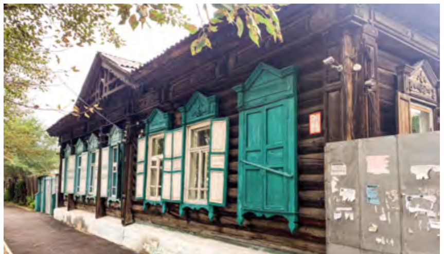
v Рис. 5. Кastrинская, д. 12. Дом Смирновой. 1914

Что касается фронта застройки вдоль улицы Ленина, то здесь произошло следующее. Планом города 1956