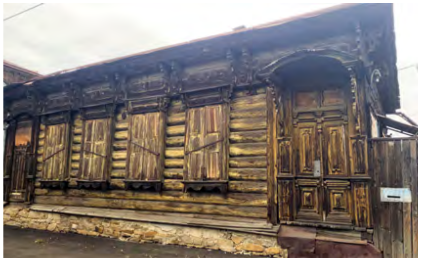
^ Рис. 6. Кastrинская, 14. Дом Войлошниковой. До 1915

высокими бревенчатыми сараями, флигелями, зимовьями (теплыми), погребами, ледниками, конюшнями, банями и амбарами. Дома имели изразцовые печи, глубокие и просторные подвалы и подполья.