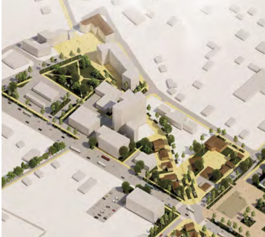
^ Рис. 12. Северный фрагмент

тала и бульвара, дополнительным драйвером развития территории.