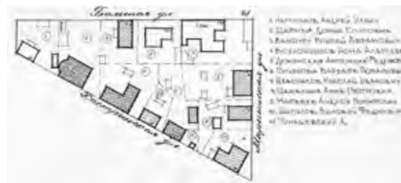
^ Рис. 8. Утраченная застройка вдоль ул. Большая (Ленина)