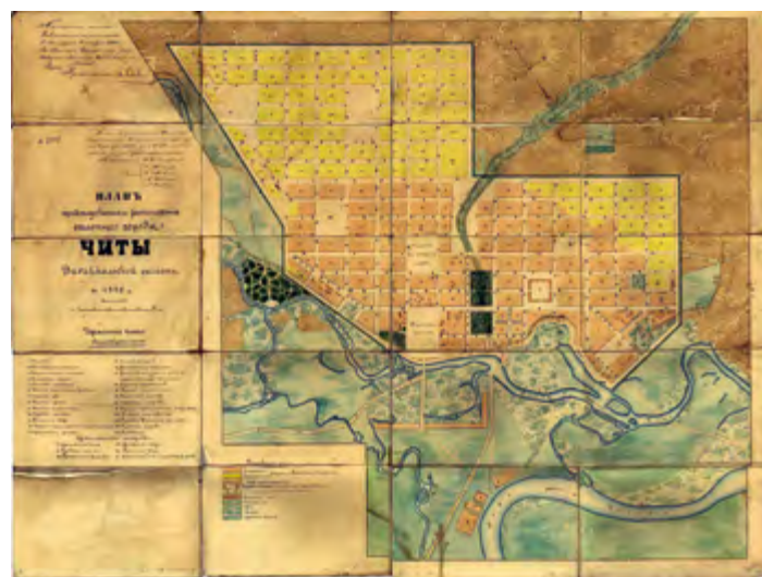
^ Рис. 3. Проектный план. 1885