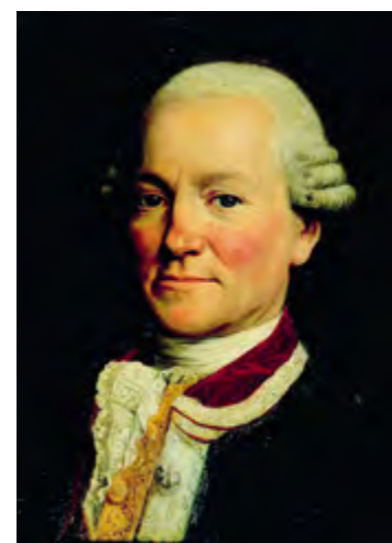
в Рис.1. Жан-Франсуа де Гало де Лаперуз (1741 – около 1788)