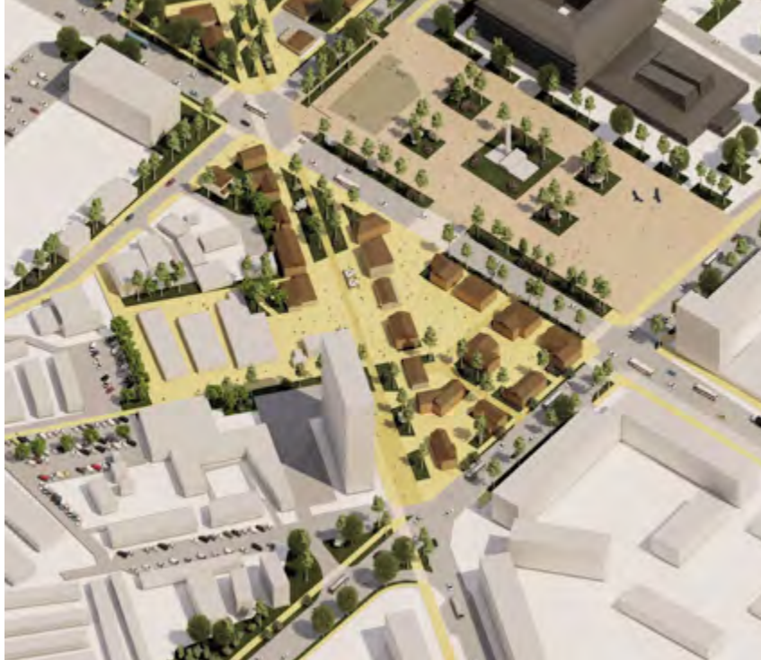
^ Рис. 11. Южный фрагмент

Внутренняя площадь и Бульвар – связанное, взаимопроницаемое пространство. Оно имеет свой ресурс – развитие по направлению к реке, причем не только вышеперечисленными бульварами по улицам, но и внутри квартала. Автокластер в перспективе может получить новую специализацию: обслуживание автобусных и автомобильных туристических маршрутов, музей автомобилей и техники, там же возможно размещение объекта крупной торговли. Таким образом, примыкающий к пешеходному бульвару с юго-запада большой участок [2, с. 121–123] нынешнего автосервиса при успешном развитии событий может стать для собственника, за счет своего выгодного положения относительно яркого привлекательного квар-