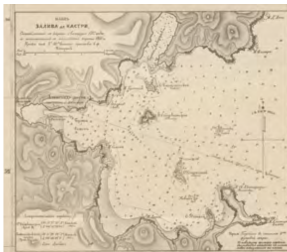
< Рис. 2 План залива Де-Кастри, составленный с карты Лаперуза 1787 года и дополненный с английской карты 1855 года

Keywords: neighbourhood regeneration; pedestrian boulevard; accesses to the river; self-sufficiency and payback; tourism.