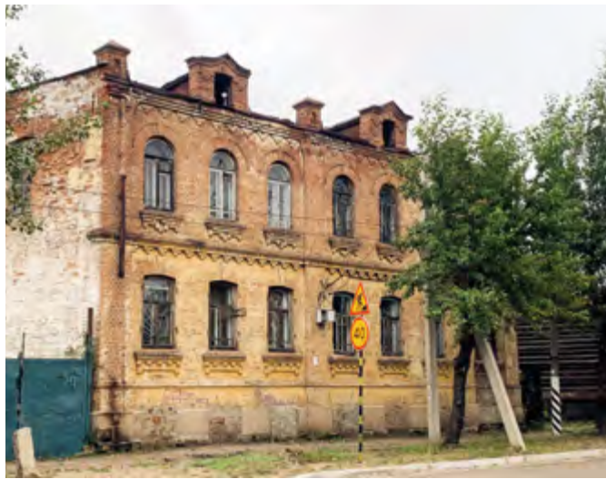
^ Рис. 7. Кastrинская, 16. Дом Шатовой. 1906–1907