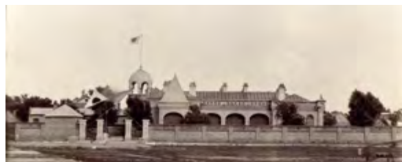
^ Рис. 11. Консульство России в Инкоу. Постройка 1904