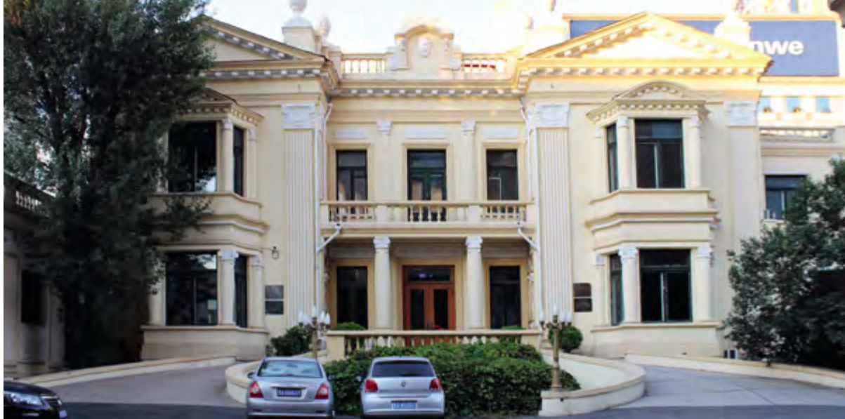
< Рис. 20. Консульство Франции в Харбине. Постройка 1914

центром служит изящный портик коринфского ордера с треугольным фронтоном, украшенный венком с лентами, что характерно для стилистики классицизма.