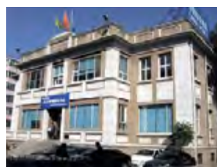
^ Рис. 24. Здание консульства Франции в Шэньяне. Постройка 1931