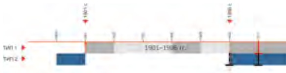
> Рис. 6. Временные рамки второго периода (1906–1915)

Первые консульские учреждения Великобритании в Маньчжурии, выполнялись по проектам архитектурного бюро НВМ, офис которого располагался в Шанхае. Офисные особняки представлены преимущественно русскими консульскими объектами (рис. 10, 11) [9]. Интересно, что в зависимости от смены политического влияния, консульства могли совмещать в себе выполнение нескольких консульских функций разных стран.