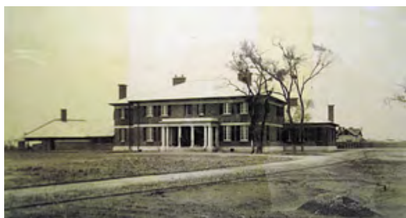
v Рис. 9. Консульство Великобритании в Шэньяне. Постройка 1910

городов Маньчжурии, медицины и человеческой деятельности. В результате консульские учреждения имели территории с развитой инфраструктурой. Активное проектирование объектов консульских учреждений для работы и проживания консульского корпуса началось с 1911 года. Для консульства Российской империи в 1913–1914 годах инженером Николаем Александровичем Казы-Гиреем были созданы проекты построек в Харбине, непосредственно консульского здания, дома генерального консула и дома для двух вице-консулов [8].