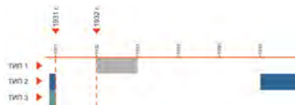
< Рис. 21. Временные рамки пятого периода (1931–1945)

В здании бывшего харбинского отделения ЮМЖД, построенном по проекту талантливого инженера