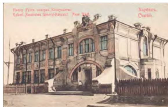
< Рис. 13. Генеральное консульство Российской империи. Постройка 1904

В это время снижается потребность в автономных территориях повышенного функционального состава. Это становится актуально даже для крупных консульских учреждений. Связано это прежде всего с развитием городов и их инфраструктуры в целом, а также с качеством обслуживания, что и привело к отсутствию необходимости в дополнительных консульских функциях, напрямую