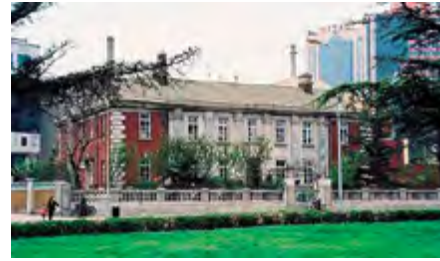
^ Рис. 18. Консульство Великобритании в Даляне. Постройка 1914