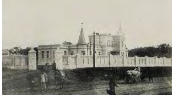
^ Рис. 10. Консульство России в Чанчуне. Постройка 1914