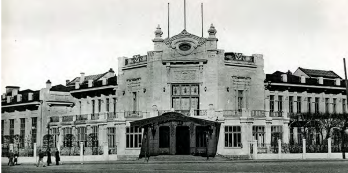
< Рис. 12. Генеральное консульство Российской империи. Постройка 1904

пы с выступающим навесом. В настоящее время здание используется как гостиница.