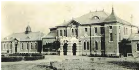
^ Рис. 7. Японское консульство в Шэньяне. Постройка 1911