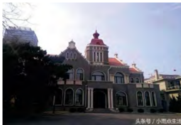
^ Рис. 2. Консульство Германии в Даляне. Постройка 1927 года

Они имели автономную территорию непосредственно для нужд консульства и представлены сооружениями российской, японской, английской, американской консульских служб. Полифункциональность таких объектов возникла на фоне слаборазвитой инфраструктуры