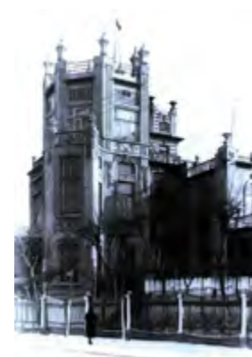
^ Рис. 3. Здание итальянского королевского консульства. Постройка 1919 года