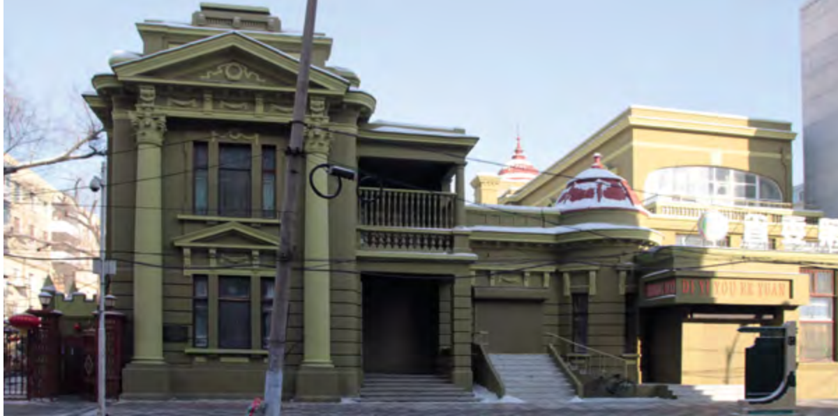
< Рис. 1. Консульство Португалии в Харбине. Постройка 1912 года

вались и имели преимущественно временный характер использования. Для них были характерны постройки утилитарного характера, складские и технические объекты, не имевшие архитектурной ценности, а также культовые объекты. Так, например, консульство США было расположено в храме Игун в Шэньяне и находилось там с 1904 по 1920 год. Храм подвергся значительной реконструкции, были построены новые объекты в границах храма. Вторым примером адаптации здания является консульство Российской империи, которое размещалось в здании разрушенной церкви начала XX века после ее реконструкции в 1906 году и использовалось до 1917 года.