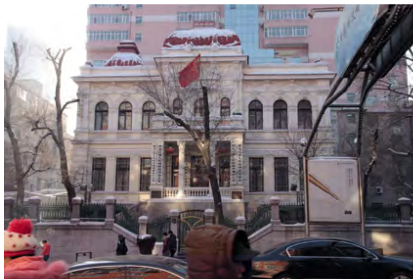
v Рис. 4. Особняк японского генерального консула. Постройка 1920 года