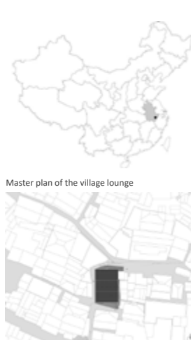
Master plan of the village lounge