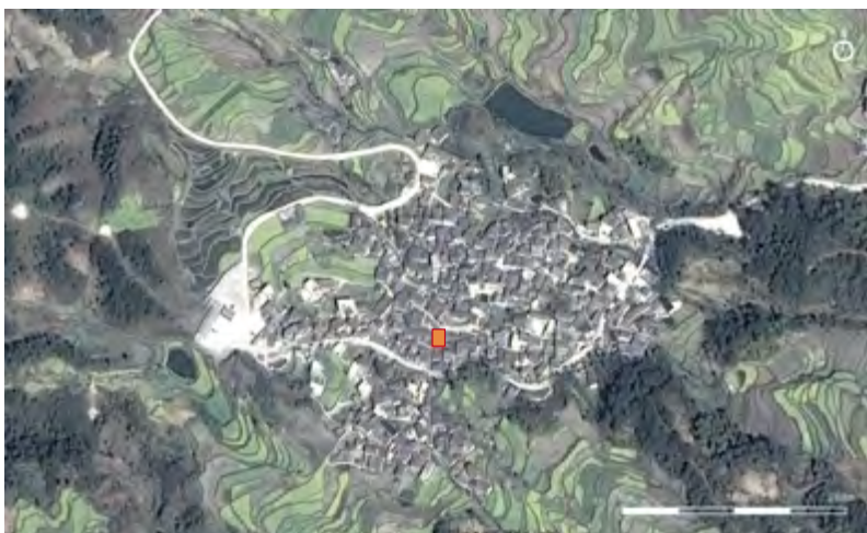
Site within the village

^ Премия МСА «Дружелюбные и инклюзивные пространства», победитель в категории «Новые здания»: Деревенская гостиная в Шангуне по проекту SUP Atelier of THAD (Китай) / The UIA Friendly and Inclusive Spaces Awards, winner in the New Buildings category: "Village Lounge of Shangcun" by SUP Atelier of THAD (China)