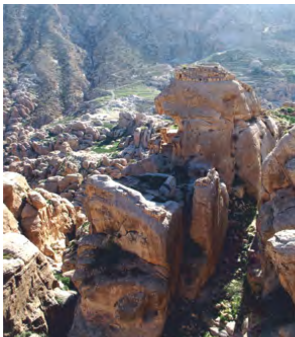
> Рис. 2. Вход в крепость Ас-Села, вид с воздуха / Figure 2. Entrance to As-Sela' fortress, aerial view

Некоторые признаки указывают, что набатейцы высекали крепость Ас-Села раньше знаменитой Петры.