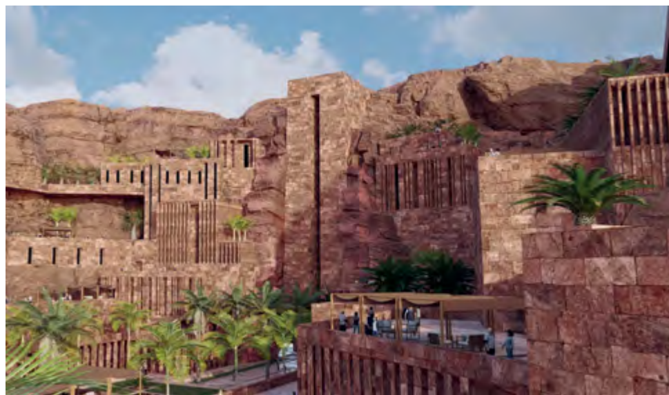
Figure 5. Most likely, this is what the interior of the Nabataean mountain fortresses looked like during the period of prosperity of the state. The restoration was carried out at the Royal Commission for the Protection of the Memory of Alula (Dubai, UAE). The Nabataean civilization and the preceding kingdom of Dadan included the entire North Arab region

в сфере управления развитием городов. В таком случае мы могли бы предложить следующие пункты: