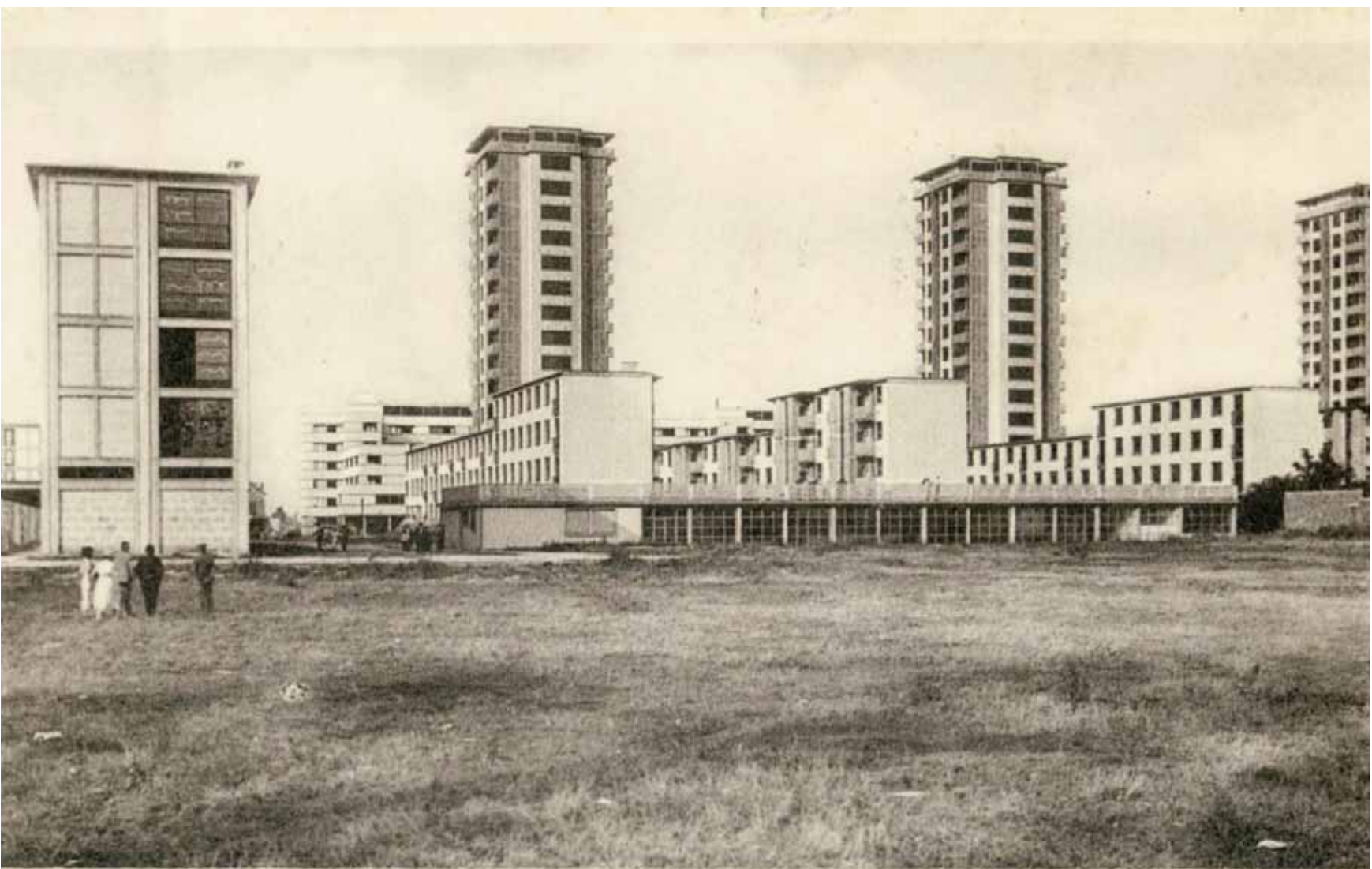
408 DRANCY. — Les Premiers Gratte-Ciel de la Région Parisienne

Эти 15-этажные небоскребы ругали за все, но особенно за то, что рабочие, которые будут в них жить, слишком легко смогут превратить их в крепость. А потому, чтобы избежать какой бы то ни было опасности, вместо рабочих в небоскребах Бодуэна и Лодса поселили... полицейских (Швидковский О., Хан-Магомедов С. Архитектура капиталистических стран // Всеобщая история искусств. Т. 6. Кн. 1. Искусство 20 века / под ред. Б. Веймарна, Ю. Колпинского. М.: Искусство, 1965. С. 932)