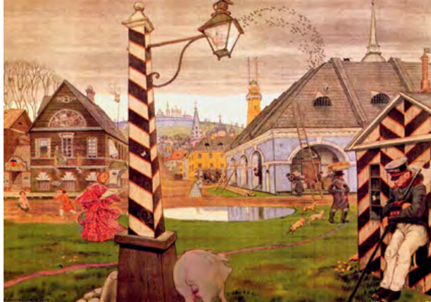
^ Рис. 5. М. В. Добужинский. Провинция 1830-х годов. 1907–1908. Образ провинции исторически менялся. В частности, он зависел от настроений в обществе. В XVII и XVIII веках провинция представлялась в пасторальном и романтическом духе, в конце XIX – начале XX вв. – в свете социальной сатиры. Но XVIII век был эпохой децентрации, продолжающейся на излете географических открытий, в т. ч. и персональных. В путешествиях по периферии цивилизации обретался новый дух: «Путешествия воспитывают юношество». А со второй половины XIX в. – время централизации власти и промышленной концентрации, провинции быстро уходят в «отвал» прогресса. В XVIII веке на провинции еще смотрели как на источник новых образов, идей, чувств; а в конце XIX и в XX в. от них уже ничего не ждуть: теперь провинции просят милостей от метрополий. Тем самым миссия периферии окончательно оторвалась от общественного образа провинции, очередной раз обнажив верность тезиса о несводимости бытия и мышления. Обратим также внимание в работе Добужинского на символы присутствия государственной власти – обязательные, но... ослабленные, спящие

«нигилисты», искатели, для которых еще ничто не предопределено и никакие иерархии не действительны. Они действуют «горизонтально», вне профессиональных и прочих предрассудков, содействуют «местам» (по сути, создавая их). Если они что и чувствуют, то все же не законченный «сенсорный образ региона», который следует воспринять и адекватно изобразить, но, подобно волкам, рыскающим по окраинам, ищут ресурсы и возможности, взвешивают силу и слабину, определяют направления прорыва.