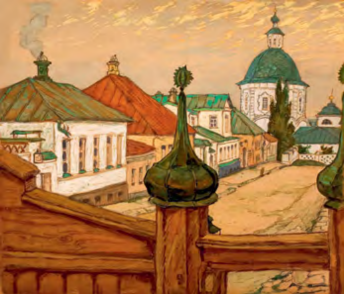
^ Рис. 6. М. В. Добужинский. Провинция (Воронеж). 1912. Воронежский музей им. И. Н. Крамского. Российская провинция начала XX столетия затаилась в ожидании; век неоднократно пройдет по ней фронтами войн и фронтами открытий. Город Засечной черты, веками стороживший буйный восток, станет рубежом, за который – уже с запада – не сможет пройти враг