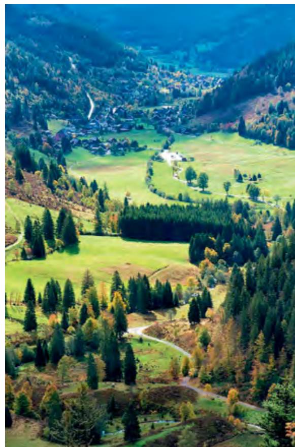
< Рис. 2. Долина Шварцвальда. Тихая и уютная швабская провинция. Если бы не М. Хайдеггер, быть бы ей глубоким захолустьем (пусть и с высоким уровнем жизни обывателей). Но Хайдеггер перевел ее в ранг персональной периферии – тут он искал и находил основания того, с чем столь весомо выступал в европейских центрах

человеком качества окружения необходимо проектировать в региональном масштабе, поскольку происшедшее с Мишн-вэлли определялось региональными соображениями и люди теперь живут именно в этом масштабе», – пишет К. Линч [5, с. 219]. Но тут же он признает принципиальную невозможность заявленной стратегии: «Совсем непросто найти одно простое слово для определения ощутимого качества какого-то места.