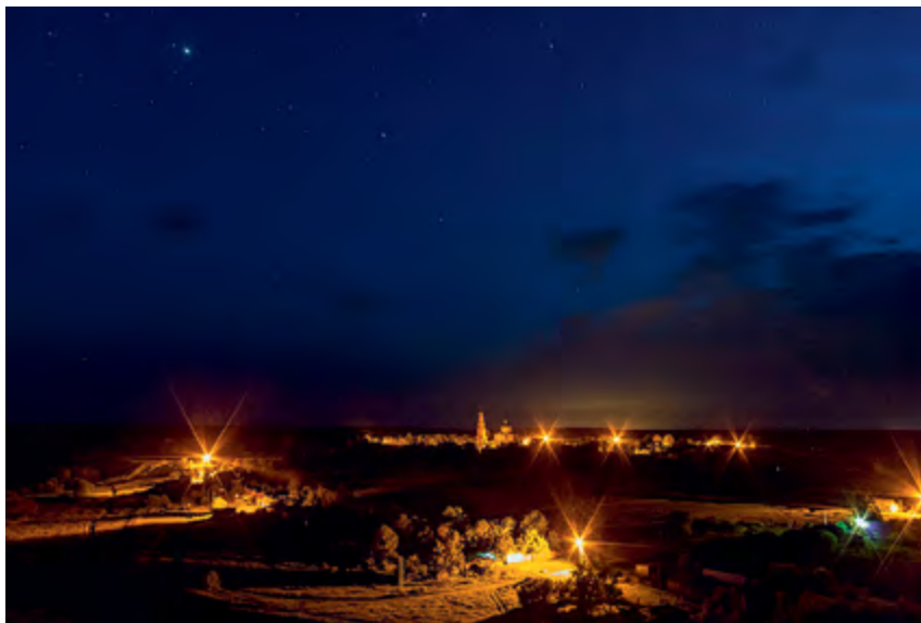
< Рис. 11. Конstellация. Ландшафт Центрального Черноземья, одного из важнейших регионов России.

вешивается центробежной, концентрация – рассеянием и новой сборкой по маргиналиям, централизация – усилением пограничья. Для архитектуры, урбанистики и дизайна пространства – это новые ресурсы образности и смысла.