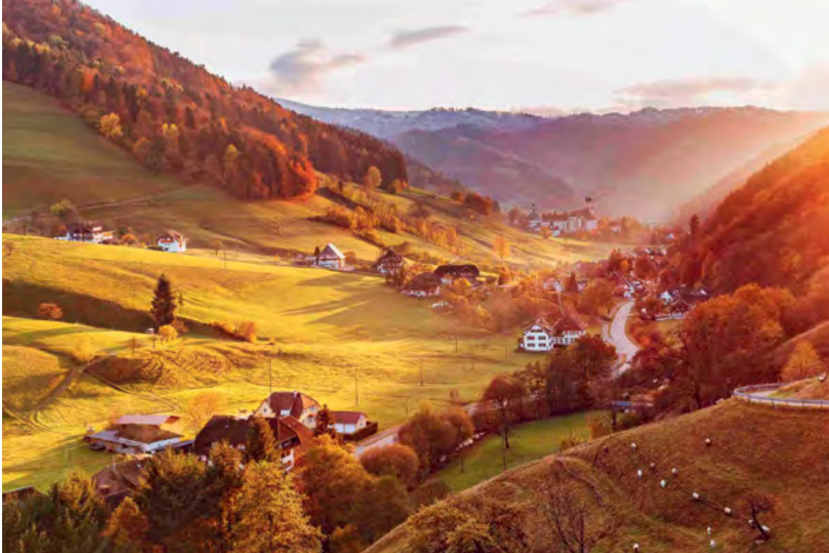
< Рис. 1. «Широкая высокогорная долина в южном Шварцвальде» – территория мысли и самоопределения Мартина Хайдеггера. Собственно, его периферия, но, отнюдь, не его регион: последний охватывал слишком многое, чтобы быть локализованным на картах

хитектурно-градостроительной. Прежде всего нас будут интересовать альтернативные всяческим «центрам» (или дополняющие их) стратегии и концепты.