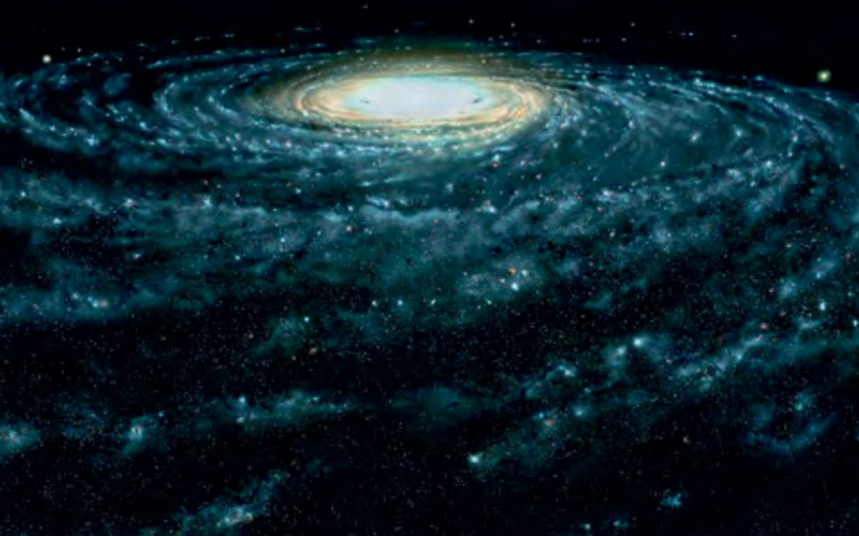
^ Рис. 8. Галактика – вот где становится ясно, что жизнь возможна скорее на периферии, чем в центре!