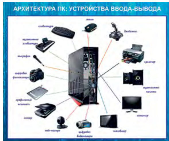
^ Рис. 7. Периферия компьютера определяется своим положением относительно центра, связкой с ним, соотношением обеспечения, инструментальности, поддержки, освоения доступного, изыскания пределов

1. «Жители города дивятся – как можно так долго оставаться одному среди однообразия крестьянской жизни. Однако я тут не в одиночестве – я в уединении. В больших городах легко оставаться одному – легко как едва ли еще где. А жить уединенно там нельзя. Ибо первозданная сила присуща уединению – оно не обособляет, не разъединяет, но все существование твое здесь круто обрушивает в самую широту близости и сущности всех вещей» [7]. Хайдеггер точно описывает энергетическую и креативную вольту периферии, а акцент на уединении – конститутивный для темы периферии.