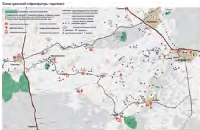
Рис. 7. Схема туристической инфраструктуры территории