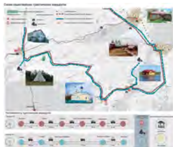
Рис. 8. Схема существующих туристических маршрутов

департамент и его структуры организуют автобусные экскурсии по туристическим объектам Упоровского и Исетского районов области, входящим в достаточно масштабную местность, под названием «Ингальская долина» [13]. Наряду с этим, под эгидой Правительства Тюменской области в 2014 г. состоялся региональный форум «Развитие экотуризма в Тюменской области», где участники презентовали целый ряд местных проектов в сфере экологического туризма [14].