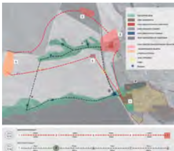
^ Рис. 20. Принцип формирования маршрутов