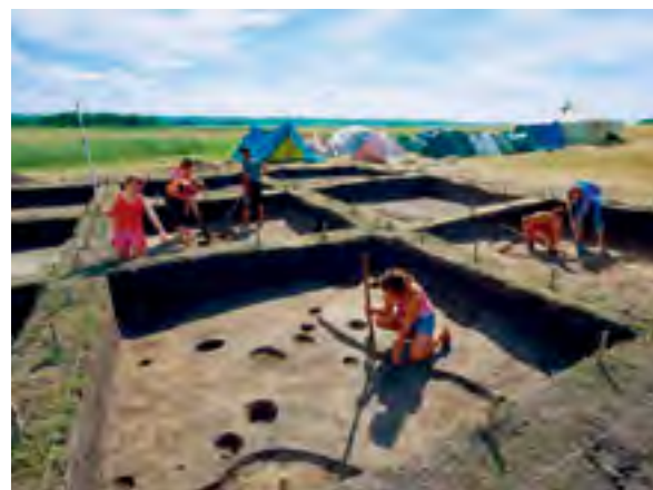
^ Рис. 3. Археологические раскопки в Ингальской долине

установлены границы территории и доказана целостность объекта с точки зрения археологии. Протяженность долины с севера на юг составляет приблизительно 55 км, а с запада на восток колеблется от 20 до 45 км. Располагается Ингальская долина в границах четырех районов: Упоровского, Исетского, Ялutorовского и Заводоуковского (рис. 1). Ярко выраженный рельеф, за исключением Марьиного ущелья, в долине практически отсутствует. В низменности между реками Тобол и Исеть располагается большое количество курганов, заметных издали. Всего здесь уже было открыто более 600 памятников каменного, бронзового и железного веков [6].