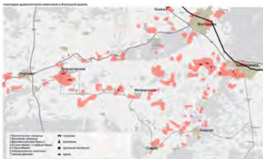
Рис. 9. Схема расположения археологических памятников в Ингальской долине

Ялуторовск и Заводоуковск [6]. Анализ существующей туристической инфраструктуры и функционального наполнения территории свидетельствует о том, что в настоящее время историко-культурный потенциал Ингальской долины еще полностью не раскрыт. На схеме можно заметить, что основное скопление инфраструктурных объектов сосредоточено в городах и сельских населенных пунктах, в то время как большая часть территории долины остается незадействованной.