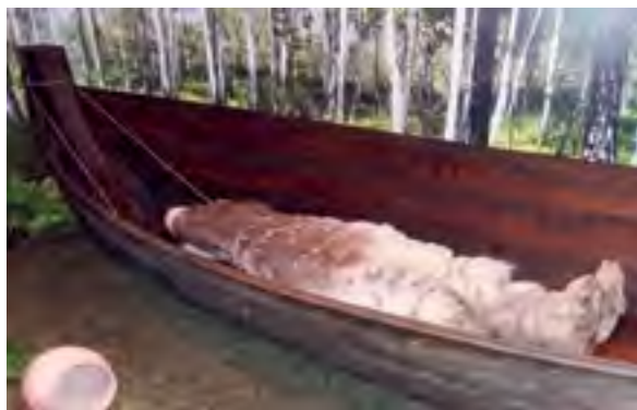
< Рис. 4. Копия погребальной ладьи медного века (3190 г. до н. э. ± 60 лет), обнаруженной в 1996 г. в могильнике «Бузан-III» в Ингальской долине

Археологические объекты являются главной ценностью территории и позволяют представить далекое прошлое человечества. Исследование археологических раскопок на территории Ингальской долины позволяет выявить основные места находок. Выявленные объекты концентрируются в большей степени вдоль рек, в локации современных населенных пунктов (городов, сел, деревень). Среди прочих памятников археологии наибольшее значение и интерес для создания туристического объекта представляет участок вблизи села Красногорское и деревни Лога. Археологические раскоп-