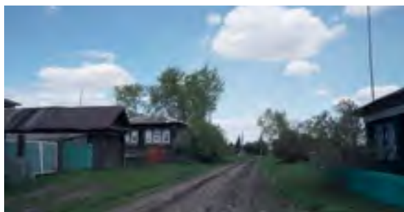
> Рис. 13. Деревня Лога. Вид на ул. Мира

Общая протяженность маршрута поделена по южным районам, что в будущем должно упростить экономическую составляющую проекта. На каждом участке пути выделим характерные объекты, формирующие образ