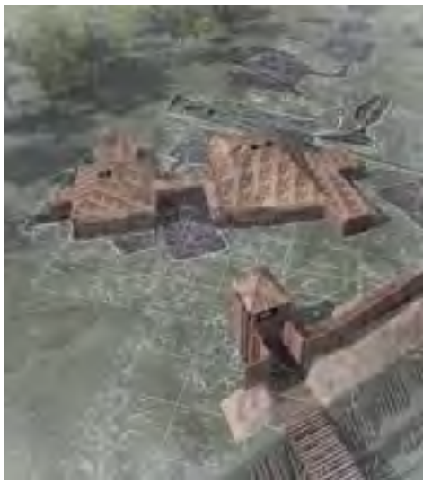
^ Рис. 5. Модель фрагмента натурной реконструкции городища