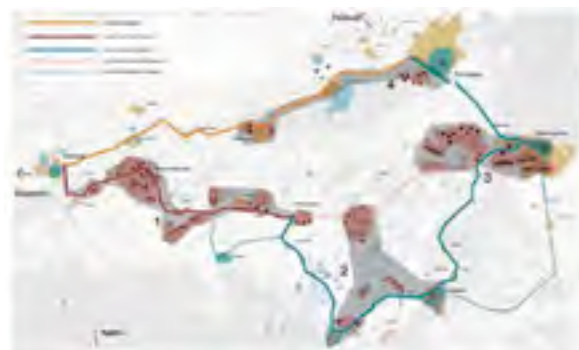
^ Рис. 16. Схема предлагаемых маршрутов в Ингальской долине

связь природы и человека. Особенно хороши виды этих улиц в летнее и весеннее время.