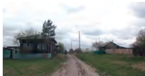
> Рис. 14. Деревня Лога. Вид на ул. Заречная