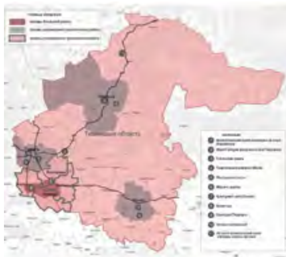
< Рис. 1. Границы Ингальской долины и объекты историко-культурного потенциала юга Тюменской области