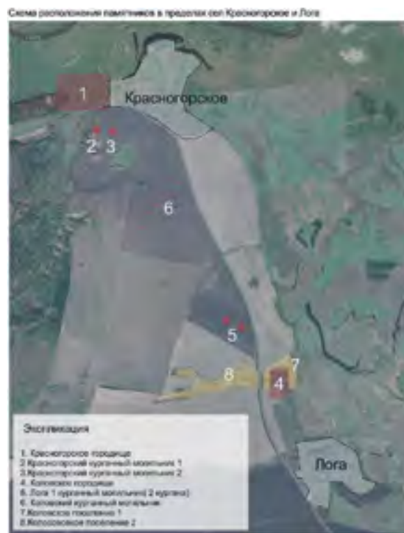
< Рис. 10. Схема расположения памятников в пределах сел Красногорское и Лога

Улицы деревни аутентичны, интересны и по-сельски уютны. Среди всех стоит выделить улицы Мира и Заречную (рис. 13; 14). Перетекая друг в друга, они задают атмосферу всему населенному пункту, представляя собой уникальную среду, в которой хорошо прослеживается