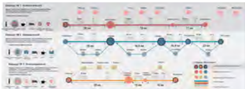
^ Рис. 17. Схема расстояний внутри маршрутов

Помимо археологического маршрута, который является идейной доминантой проекта, предполагается организовать прогулочный маршрут. Представленная схема показывает один из возможных путей развития территории. Образом формирования маршрутов стали бусы, включа-