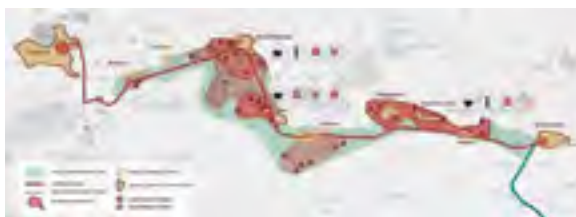
< Рис. 18. Схема археологического маршрута

ющие в себя основные объекты, нанизанные на общий маршрут. Каждый из опорных узлов имеет сложносочиненную структуру, которую можно сравнить осколками, найденными во время раскопок (рис. 19).