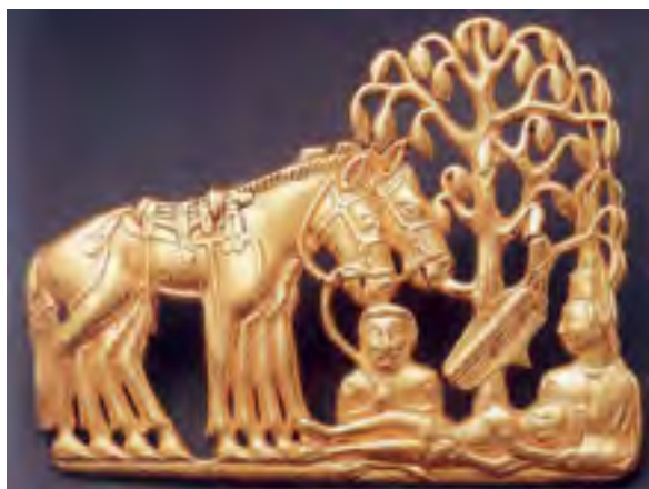
^ Рис. 2. Поясная бляха. Сибирская коллекция Петра I