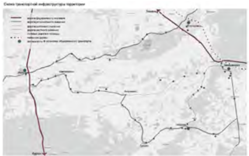
^ Рис. 6. Схема транспортной инфраструктуры территории

ки на этой территории велись с 1984 по 2006 гг. Здесь были найдены предметы, относящиеся к бархатовской, саргатской и бакальской культурам. В процессе раскопок каждый археологический объект был подробно описан [8]. Ряд памятников нанесен на археологическую карту местности [9].