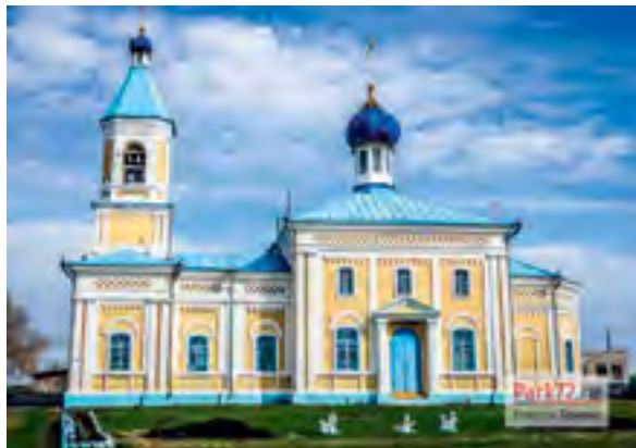
^ Рис. 15. Суерский Храм Серафима Саровского