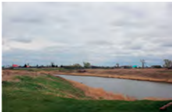
^ Рис. 11. Деревня Лога. Общий вид