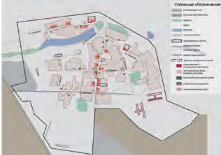
^ Рис. 12. Опорный план д. Лога

ценностью территории и позволяют представить далекое прошлое человечества. На схеме ниже указаны основные очаги археологических раскопок на территории долины (рис. 9).