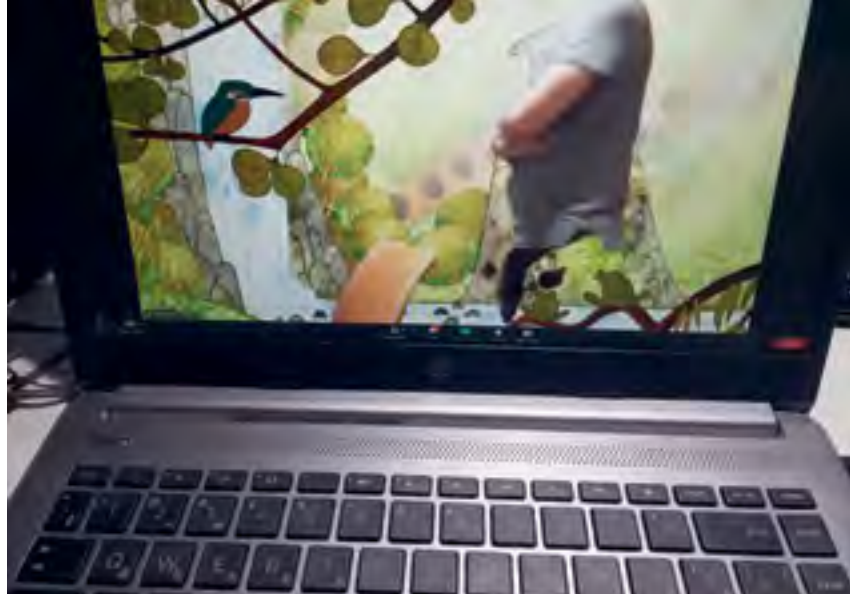
^ Преподаватель во время онлайн-лекции по привычке ходит. Эффект виртуального фона ZOOM.