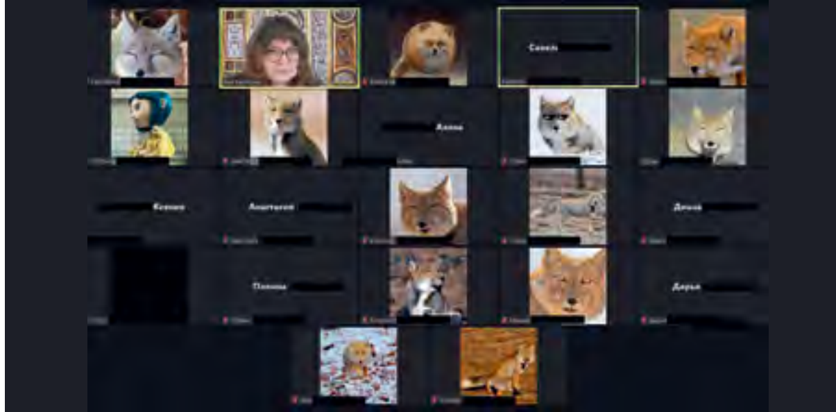
< «Когда у преподавателя фамилия Лисицина, и студенты решили пошутить...» Поле ZOOM во время онлайн-занятия.

ции люди стараются саморазвиваться и уделять время своему духовному и физическому состоянию».