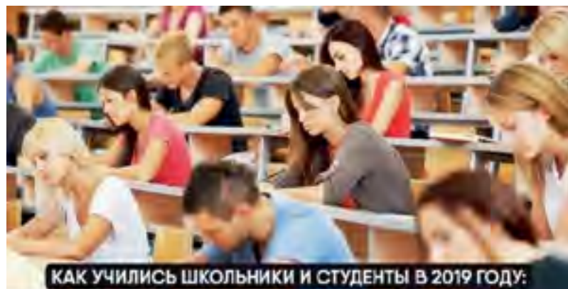
КАК УЧИЛИСЬ ШКОЛЬНИКИ И СТУДЕНТЫ В 2019 ГОДУ: