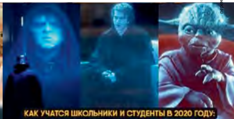
КАК УЧАТСЯ ШКОЛЬНИКИ И СТУДЕНТЫ В 2020 ГОДУ: