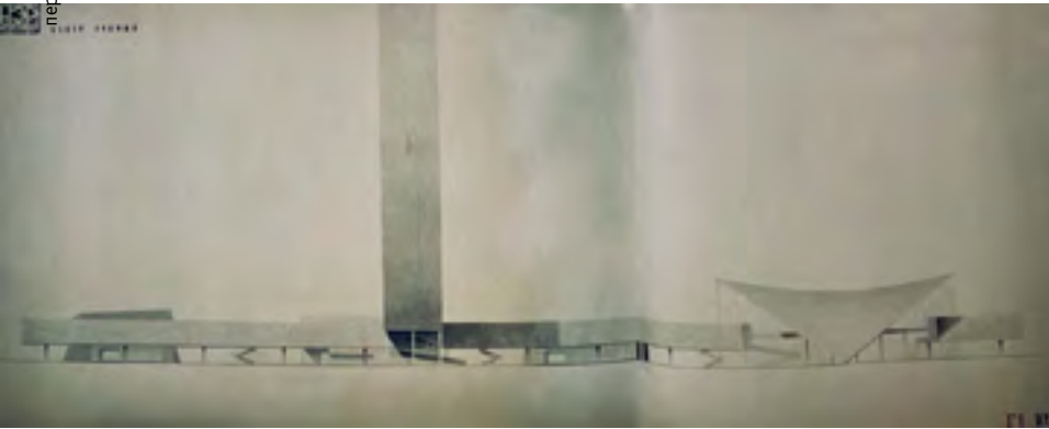
^ Центр знаний. Проект. Дипломант А. Бабуров. Рук. М. О. Барщ, Н. Х. Поляков, И. С. Николаев, Н. В. Пограничная. 1961.