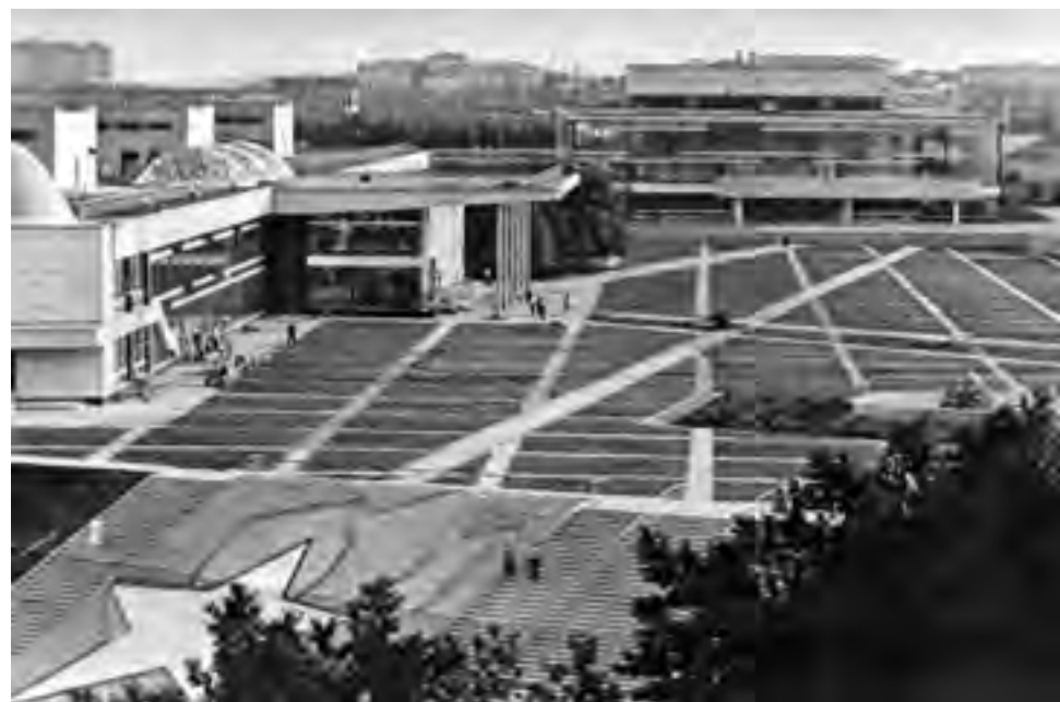
в Дворец Пионеров на Ленинских (Воробьевых) горах. Архитекторы В. С. Егоров, В. С. Кубасов, Ф. А. Новиков, И. А. Покровский, Б. В. Палуй, М. Н. Хажакян. 1958–1962

Нас слушали: А. Меерсон, В. Давиденко, М. Бубнов, Е. Розанов, В. Шестопалов, М. Константинов; пришли