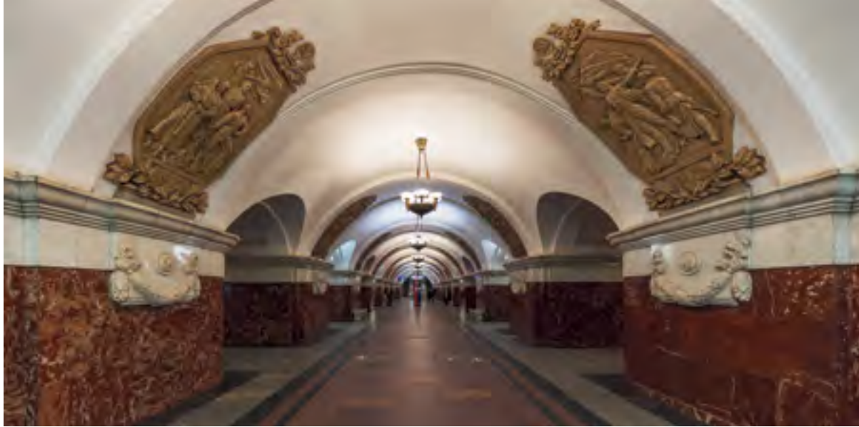
< Станция метро «Краснопresненская». Архитекторы В. С. Егоров, М. П. Константинов, Ф. А. Новиков, И. А. Покровский. 1954.

что было большой редкостью: только А. Бабуров благодаря отцу и я благодаря деду, членам Всесоюзной академии архитектуры, имели возможность регулярно знакомиться с главными архитектурными изданиями мира (а через нас – все друзья по НЭРу). В серийных мероприятиях главное – не ошибиться в выборе первого героя. Но здесь мы были единодушны с Еленой Борисовной – первым должен быть только Ле Корбюзье!