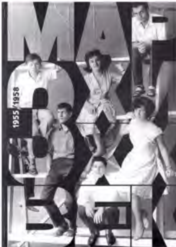
> Группа НЭР. Обложка «МАРХИ XX век». Т. 3. 1955–1958.

Теперь некоторые соображения по экономической эффективности «Постановления об излишествах». Исключение архитектуры и градостроительства из сада искусств привело к заполнению огромных городских пространств однородными рядами монотонных зданий, стерших своеобразие городов СССР. До чего это может довести, рассказано в фильме «Ирония судьбы». Резкое увеличение выхода квадратных метров жилплощади за счет минимизации планировки, которыми отчитывалось государство (и до сих пор отчитывается не квартирами, как во всем мире, а именно квадратными метрами, по валу), резко снизило комфорт проживания. Качество строительства падало, дома, жизненный цикл которых был рассчитан на 25 лет, быстро ветшали, приходили в разряд ветхих и аварийных, и в их запредельном возрасте встал вопрос о реновации этого массива застройки 1950–1980-х гг. Никто никогда не считал экономическую эффективность этого постановления – всегда победно заявляли о тысячах граждан, переехавших из подвалов в отдельные квартиры. Но очереди на жилье сохранялись десятилетиями, жилищный вопрос не решен и сегодня, поскольку на ногах у новой России висят гири недвижи-