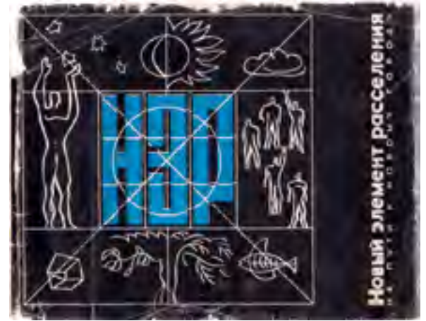
^ Обложка книги «Новый элемент расселения». 1965.

Гутнова, будущего лидера футурологической группы НЭР и автора сценария.