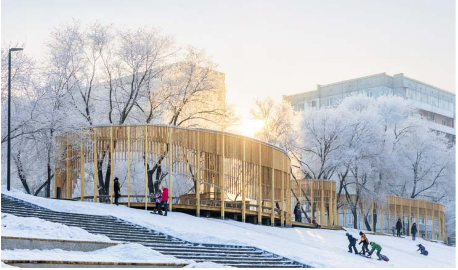
ОПОРНЫЕ ЭЛЕМЕНТЫ ТЕРРАС