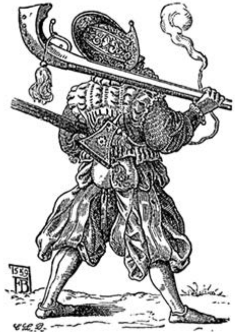
Fig. 4. Landsknecht-Doppelsöldner mit Hafensbüchse (nach F. Brun).

^ Война в эпоху комплексного кризиса также меняет свои формы и содержание. Кризис XVI века превратил войну в дело профессиональных армий, вооруженных огнестрельным оружием. К середине века поле битвы преобразилось. Государства, которые сохранили консервативный средневековый способ ведения войны, основанный на грубых ударных действиях, подобно шотландцам, уступили новым профессиональным армиям, состоящим из тяжелой и легкой кавалерии, пикинеров и аркебузирова и растущего числа пушек. Ландскнехт в «ленточных штанах» плюдерхозен с аркебузой. Франц Брюн. Гравюра из сюиты «Солдаты». 1559