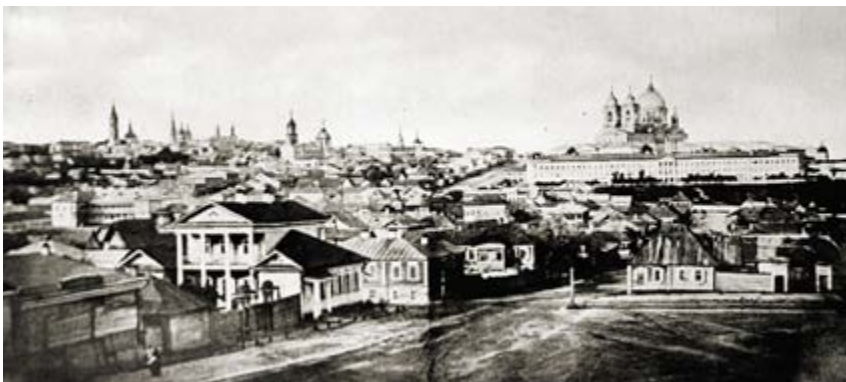
v Рис. Рис. 6. Панорама г. Курска, 1862 г.

Ж. Пиже, Р. Шварц, К. Норберг-Шульц, М. Оже и др. Французский философ Этьен Сурио обращает внимание на то, что пространство становится местом только тогда, когда оно «выделено» каким-либо событием или объектом (рис. 3).