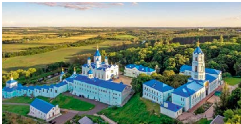
^ Рис. 4. Курская область, с. Свобода. Мужской монастырь, Коренная пустынь, 1597

Норвежский теоретик архитектуры Кристиан Норберг-Шульц считал, что сугубо прагматические подходы к организации предметно-пространственной среды приводят