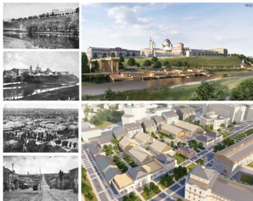
в Рис. 8. б) Проектное предложение «Курск-2032», арх. Е. М. Богомаз

Идентификация места. Исторический центр города располагается на холме, где ранее размещалась доминирующая над окружающей местностью крепость-кремль Курска. Треугольное в плане укрепление с востока и запада защищали обрывистые русла рек Кур и Тускарь, а с северной стороны – глубокий ров (рис. 5). Деревянная крепость неоднократно разрушалась и вновь отстраивалась, а в 1615 году в честь успешной обороны и избавления от польско-литовского войска в ней был основан Знаменский монастырь. По генеральному плану 1782 года на месте засыпанного рва была организована Красная площадь. В честь победы в Отечественной войне 1812 года был заложен и спустя 10 лет построен большой Знаменский собор, который долгие годы вместе с други-