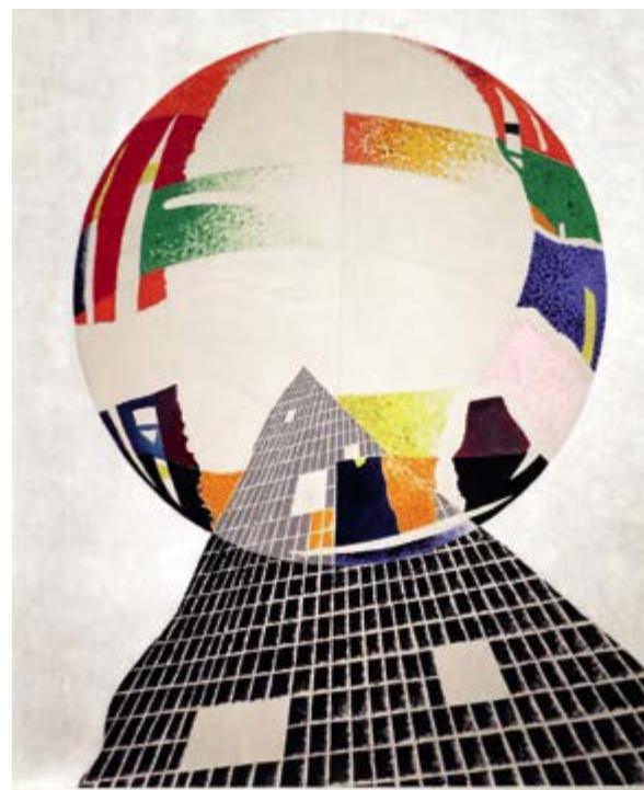
> Рис. 1. Л. Мохоли-Надь. а) Великая машина эмоций, 1920; б) Ядерный I, 1945