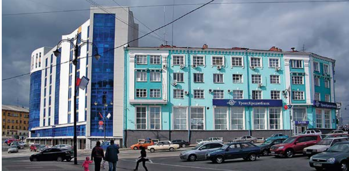
> Рис. 2. Курск. Точечная застройка в городе

Архитектурное пространство. Тенденция функционализма, превратившаяся в универсальную, глобальную идею разрешения проблем и противоречий общества, строилась на принципах рациональности, целесообразности и обоснованности. Массово тиражировались устойчивые стереотипы, в которых «<...> функционально оправданная форма была построена на подчинении всей архитектурной композиции, всего архитектурного выражения строго определенным утилитарным функциям, вне которых нет и архитектурной формы» [5, с. 21]. Эстетика целесообразности приводила к вытеснению архитектурного творчества, потери его содержательной стороны. Разрешение данной проблемы венгерский художник и искусствовед Ласло Мохоли-Надь видел в постижении «ощущения пространства», выдвигая его в качестве