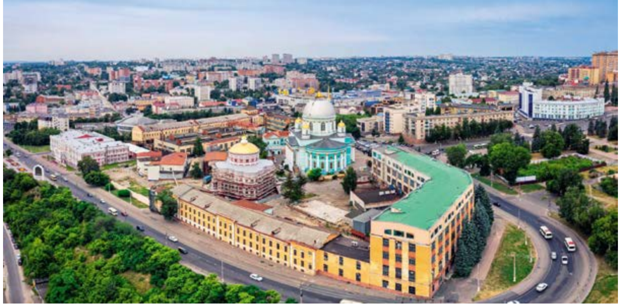
> Рис. 7. Курск. Исторический центр города

к упрощению и безликости создаваемого пространства. Взаимодействие окружающей среды и архитектурного объекта должно быть содержательным, прочитываться или расшифровываться как некий код, раскрывающий архитектурную идею, художественный язык которой «впитал» уникальные качества места. В таком случае место превращается в своеобразную декларацию идей, взглядов и убеждений архитектора – социально-политических, культурно-исторических, экологических и т. п.