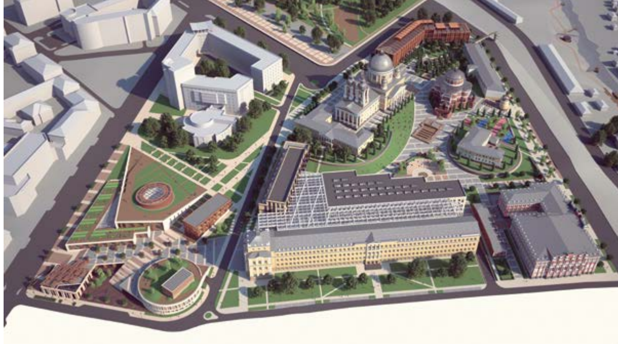
< Рис. 8. а) Проектное предложение «Курск 2032», арх. М. Заутренников, К. Будыкин

непохожести в рамках глобального распространения единых штампов и образцов, приводя к типовой, обезличенной среде. Понятие «не-место», впервые введенное М. Оже в противовес «месту», лишается своего смыслового содержания, перестает отождествляться с историческими событиями, культурными традициями, ощущаться как свое личностное пространство. Вымывается и уничтожается коллективная и индивидуальная память места, отменяя его назначение и превращая его тем самым в не-место. «Если место может определяться как идентифицирующее, связующее (диалоговое) и историческое, то пространство, которое не может себя определить, как идентифицирующее или как связующее, или как историческое, будет определяться как не-место» [12, с. 100].