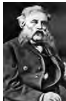
^ Рис. 4. Портрет академика М. А. Щурупова