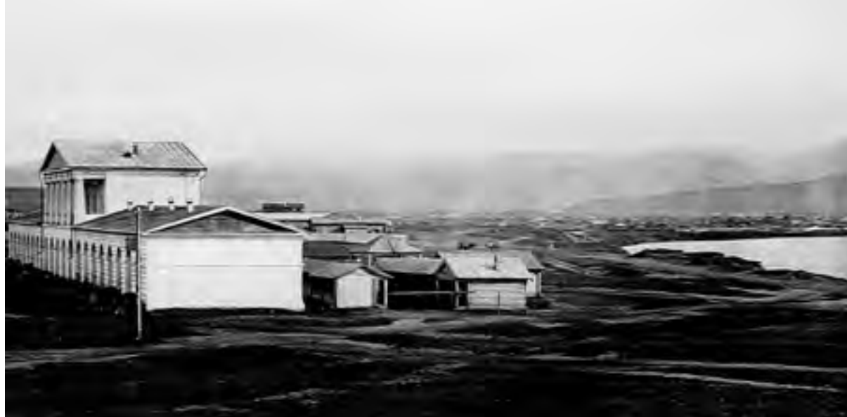
< Рис.15. Нерчинск. Гостиный двор.