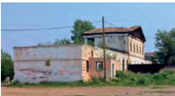
^ Рис. 20. Гостиный двор. Вид со двора

За прошедшие с того времени годы многое изменилось и, к сожалению, не в лучшую сторону. Найденные и исследованные материалы об этом уникальном объекте свидетельствуют, что Гостиный двор представляет собой едва ли не самое «древнее» здание во всем Забайкалье, поэтому не только история его строительства вызывает большой интерес, но и его судьба, а также современное состояние. До сегодняшнего дня Гостиный двор дошел в таком ужасном виде, что теперь проблематичным представляется его восстановление. И если будет все-таки принято решение о его «возрождении», а также найдутся для этого спонсоры и финансовые средства, то на этом месте Гостиный двор придется возводить заново. Другого варианта просто не существует. Иначе говоря, как это чаще всего бывает в подобных случаях – новодел. Известно, что еще на рубеже XIX и XX столетий здание Гостиного двора было основательно изменено многими поздними перестройками: исчезла галерея в правом крыле, все арочные проемы были заполнены кирпичной кладкой, появилось большое количество окон, в особен-