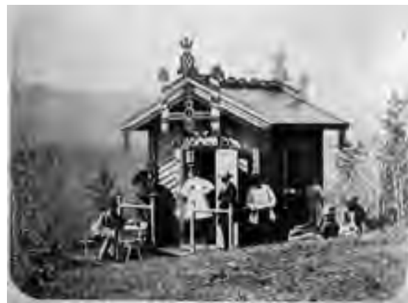
> Рис. 29. Нижний Стан. Беседка на даче Бутиных.

визитной карточкой и Нерчинска, и всего Забайкалья. Далеко не последнюю роль в создании такого имиджа сыграли и супруги Куликовские за несколько лет своего пребывания на забайкальской земле, приветливой для всех и богатой своей историей.