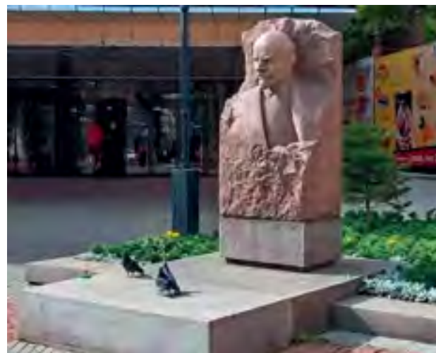
^ Рис. 8. С. Д. Меркуров. Бюст В. И. Ленина в Иркутске

Были среди его проектов и другие, но малозначимые и мелкие проекты типа разработки небольших сельских домиков и тому подобных объектов.