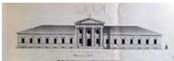
> Рис. 25. Нерчинский Завод. Проект здания архива, музея и библиотеки. Архитектор Л. И. Иванов

История Забайкалья, этого удивительного края, в том числе Нерчинска, меня заинтересовала еще более 40 лет назад. Мне довелось бывать там еще в давние 1980-е годы, я неоднократно возил в исторический и уникальный Нерчинск на летнюю ознакомительную и акварельную практику своих студентов-архитекторов, и об этом городе, его памятниках архитектуры мне довелось еще в 1980 г. опубликовать статью с наиболее интересными цветными иллюстрациями в одном из популярных в тот период столичных изданий – в альманахе «Памятники Отечества» [5, с. 50–57].