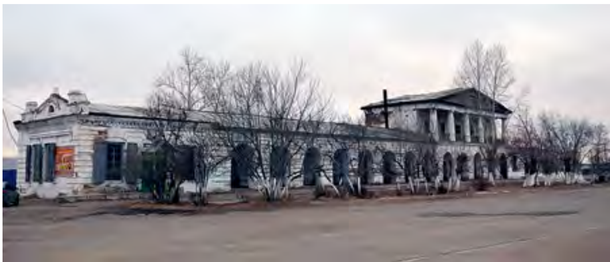
< Рис.19. Гостиный двор. Общий вид здания