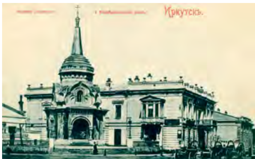
^ Рис. 7. Иркутск. Часовня во имя Христа Спасителя