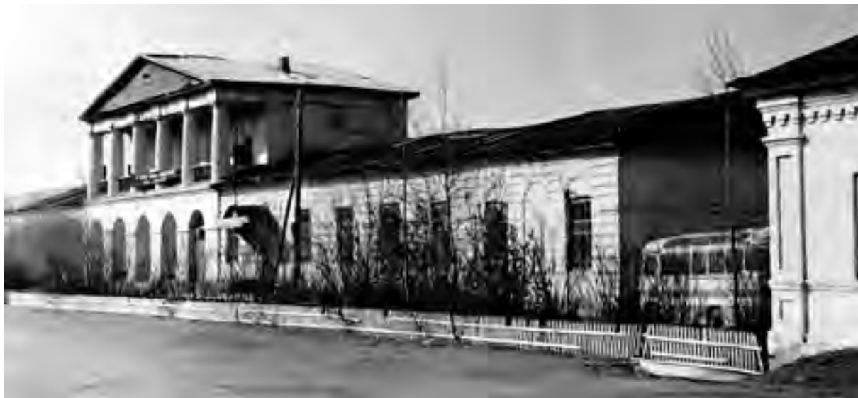
> Рис.17. Гостиный двор. Вид со стороны площади