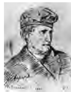
^ Рис. 3. Д. В. Каракозов. Портретный набросок И. Е. Репина