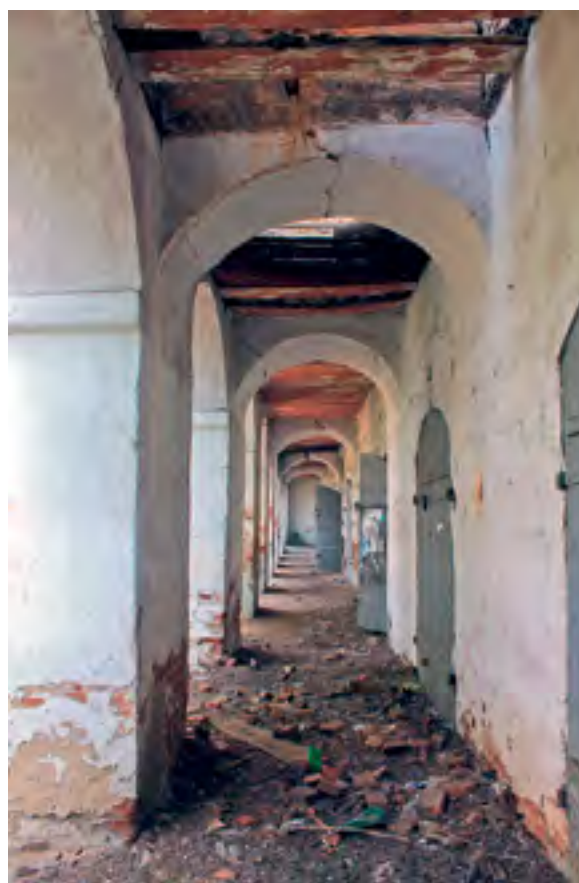
< Рис. 21. Памятная доска на стене Гостиного двора