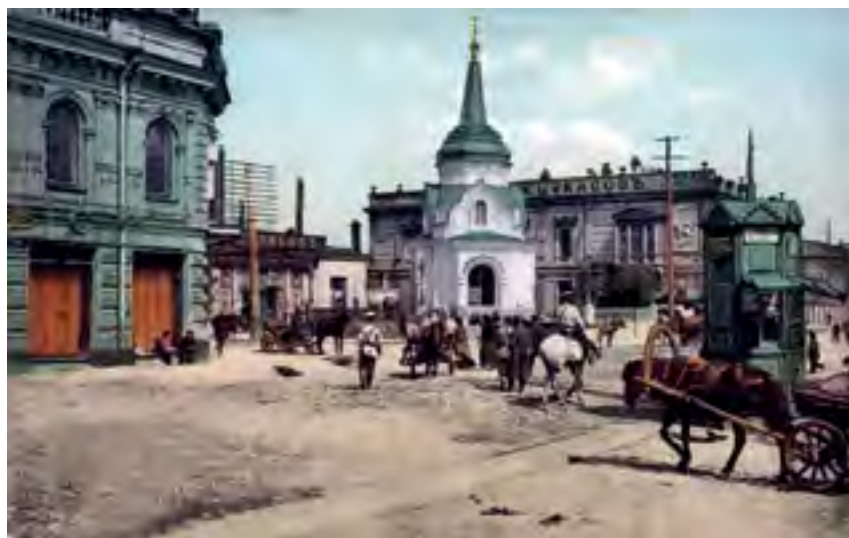
^ Рис. 6. Иркутск. Часовня во имя Христа Спасителя. Открытка

по сохранившимся документам, в Иркутске конкурс выиграл малоизвестный поручик Н. Н. Порохов, однако в процессе рассмотрения в столице его проект подвергся основательной критике и в результате был забракован как несостоятельный. Вместо него 50-летний архитектор, академик из Санкт-Петербурга Михаил Арефьевич Щурупов (рис. 4), считавшийся авторитетным специалистом именно по церковной архитектуре, разработал новый вариант, который и получил императорское одобрение. Для этой памятной часовни в северной столице ювелир А. Я. Соколов выполнил золоченый купол, евангелие, крест, люстры, а также позолоченный иконостас из кипариса и все прочие необходимые церковные атрибуты. Иконы для памятной часовни тоже были написаны в Петербурге, а выполнял их профессор исторической и церковной живописи академик Шамшин Петр Михайлович (рис. 5).