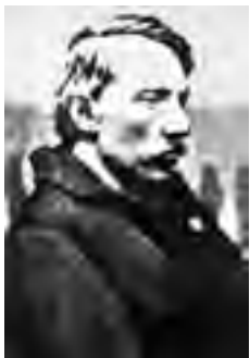
^ Рис. 2. Д. В. Каракозов. Автор неизвестен