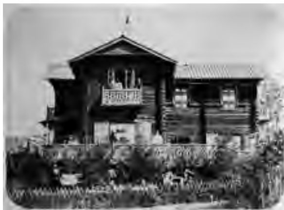
> Рис. 28. Нижний Стан. Дачный дом Бутиных. Автор неизвестен