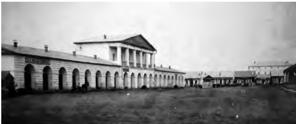
< Рис.11. Нерчинск. Здание Гостиного двора. Архитектор. Л. И. Иванов