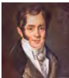
^ Рис.13. Академик Карл Иванович Росси (1775–1849)

традиционная для подобного рода сооружений колоннада. Ее прямоугольные в сечении, рустованные массивные столбы поддерживали аркаду. Известно, что подобный мотив обработки нижнего этажа присутствовал во многих постройках Джакомо Кваренги в Петербурге, а также на зданиях гостиных дворов в Забайкалье, в частности, в Кяхте и Верхнеудинске, построенных по проектам архитектора А. И. Лосева. Симметрию всей композиции главного фасада нерчинского Гостиного двора подчеркивал шестиколонный портик с колоннами тосканского ордера, венчавший его верхнюю часть. Первоначальный вид этого уникального в Забайкалье объекта сохранился также на снимках разного времени, в том числе имеется даже и проектное изображение Гостиного двора, выполненное непосредственно Л. И. Ивановым, находящееся в настоящее время в фондах Нерчинского краеведческого музея. Сохранились и некоторые исторические разновременные фотоснимки, на которых тоже можно видеть