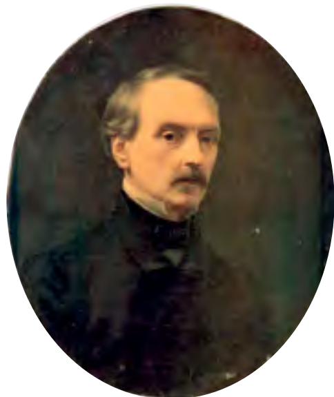
^ Рис. 5. Академик П. М. Шамшин. Автопортрет