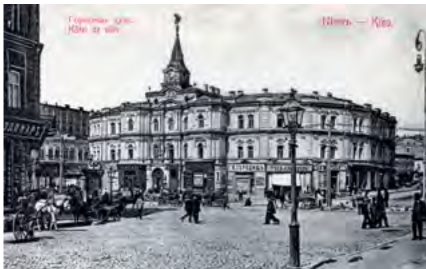
^ Рис. 9. Киев. Здание городской Думы на Крещатике