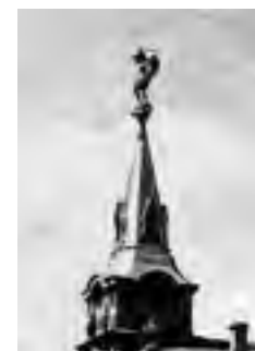
^ Рис.10. Киев. Ангел на шпигеле здания городской Думы.