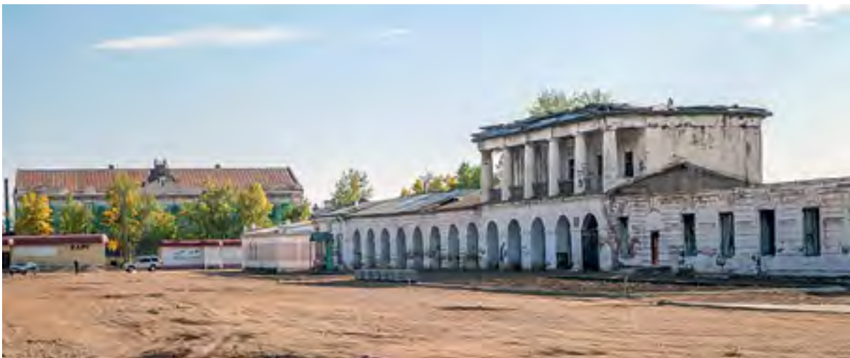
v Рис.18. Гостиный двор с утратами

За прошедшие с того времени годы многое изменилось и, к сожалению, не в лучшую сторону. Найденные и исследованные материалы об этом уникальном объекте свидетельствуют, что Гостиный двор представляет собой едва ли не самое «древнее» здание во всем Забайкалье, поэтому не только история его строительства вызывает большой интерес, но и его судьба, а также современное состояние. До сегодняшнего дня Гостиный двор дошел в таком ужасном виде, что теперь проблематичным представляется его восстановление. И если будет все-таки принято решение о его «возрождении», а также найдутся для этого спонсоры и финансовые средства, то на этом месте Гостиный двор придется возводить заново. Другого варианта просто не существует. Иначе говоря, как это чаще всего бывает в подобных случаях – новодел. Известно, что еще на рубеже XIX и XX столетий здание Гостиного двора было основательно изменено многими поздними перестройками: исчезла галерея в правом крыле, все арочные проемы были заполнены кирпичной кладкой, появилось большое количество окон, в особен-