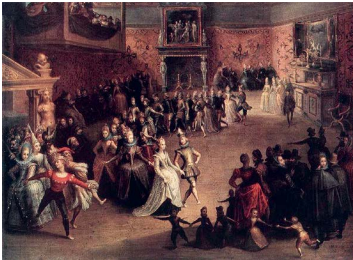
< Мартин Пепин. Бал при дворе. 1604

Во времена Людовика XIV отделка каминов была невероятно пышной. Их украшали раковинами, гирляндами, позолоченной лепниной, скульптурами. Каминные полки и пространство над ними часто отделывали пышной рамой, в которую вставляли бюст. В Версальском дворце, к примеру, каминная полка в одном из залов украшена элегантными завитками, раковинами, а пространство над камином занимает зеркало в виде окна.