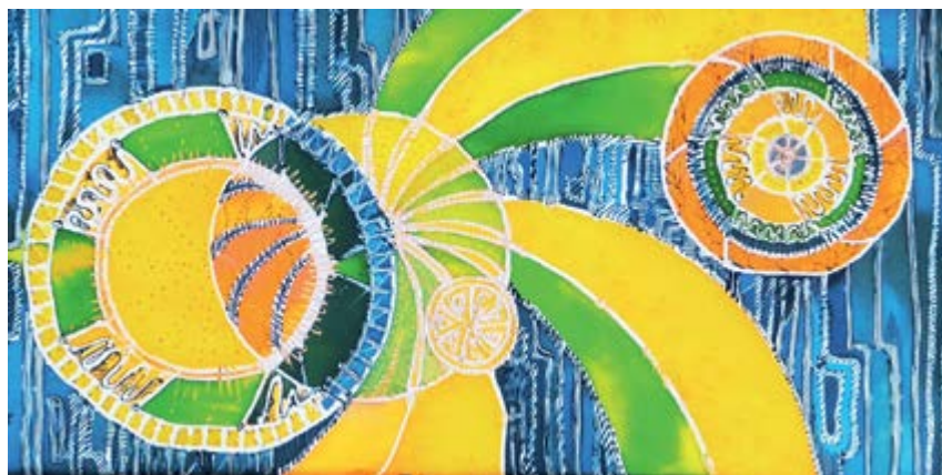
^ Рис 3. Третий этап. Проработка живописных отношений фона и деталей абстрактной композиции. Поиск цветового образа композиции, единства цветового звучания красок. Опора на классические цветовые аккорды: «синий – желтый – ахроматические» и «зеленый – желтый – ахроматические». Поиск нужного уровня напряжения между основными тонами, динамикой и общим характером цвета (плотный, локальный)

Создание художественного произведения требует от мастера полной самоотдачи. Художнику необходим опыт, знания, умения. Недостатком умения писать и рисовать, необходимо умение мыслить. Ремесло на грани философии жизни. Живописное произведение должно