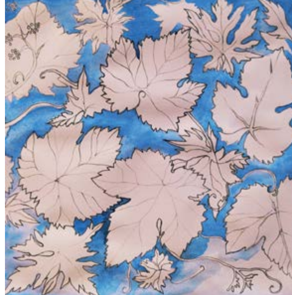
^ Рис 6. Второй этап. Рисунок. Общая концепция цвета на контрасте холодного фона и теплых тонов изображения

v Рис 7. Третий этап. Живопись. Решение общего характера цвета. Цвет прозрачный, акварельный, нюансный