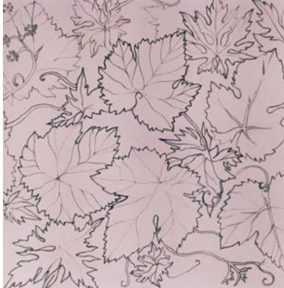
^ Рис 5. Первый этап. Рисунок. Поиски характера линии и общей композиции картины. Линия вибрирующая, передает тактильное ощущение бархатистых листьев. Композиция ненавязчивая, центр выделен нерезко. Также «намеком» обозначена восходящая диагональ из нижнего левого в правый верхний угол