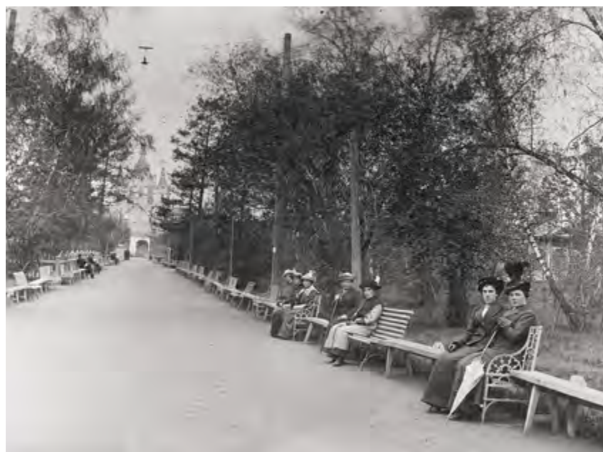
в Рис. 3. Аллея Городского сада Красноярска [5]

В 1908 г. в северо-восточном углу городского сада по инициативе В. А. Полякова построен деревянный павильон кинематографа (рис. 7). Здание прослужило городу до 1960-х гг., когда на его месте выстроили кинотеатр «Луч». С начала XX века городские строения все ближе подступали к городскому саду. В 1909 г. вход в сад становится бесплатным для всех. В 1911 г. была построена большая оранжерея для выращивания цветочной рассады. В выходные и праздничные дни играл духовой