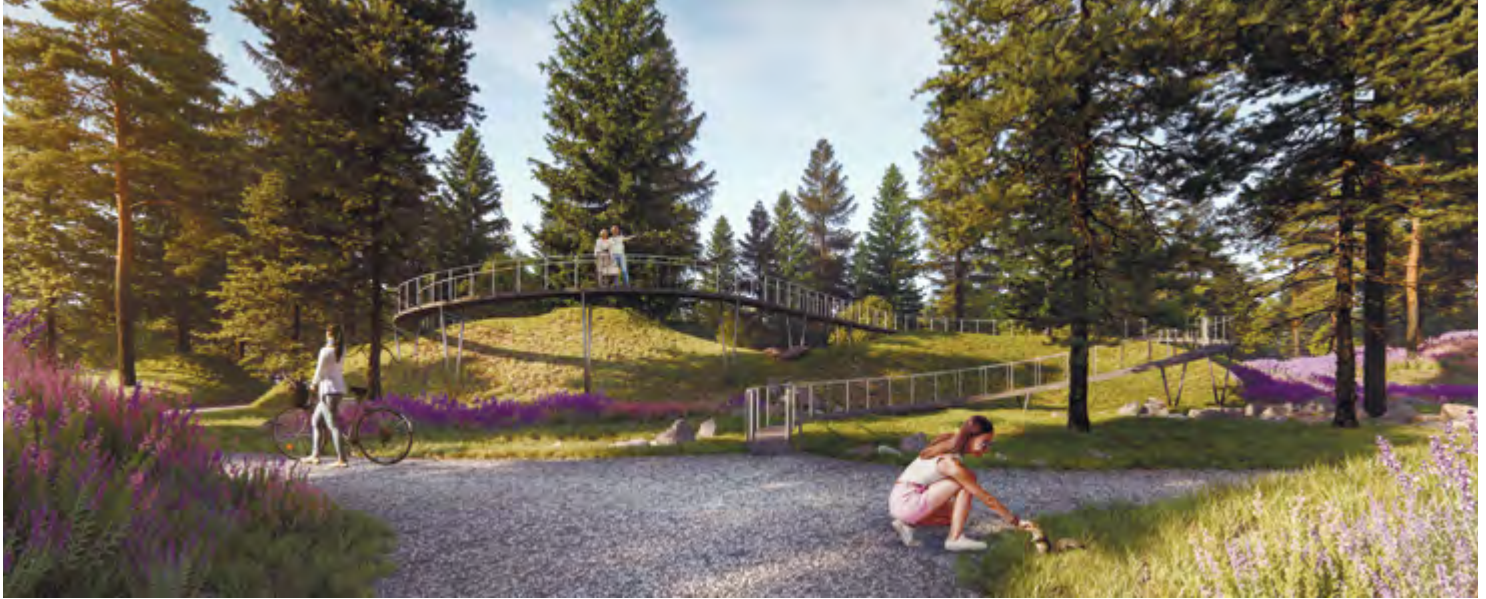
^ Рис. 14. Конкурсный проект Центрального парка Красноярска консорциума под лидерством MLA+ (Санкт-Петербург, Россия). Фрагмент [8]

Хороший парк соединяет пространство со всеми сообществами вокруг. Доступность парка – одно из базовых условий Хорошего парка.