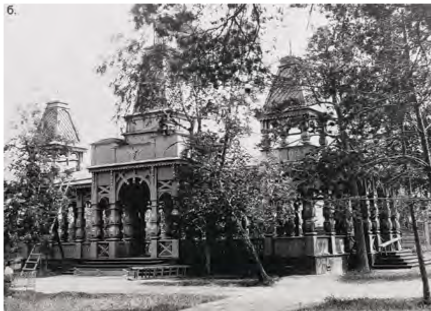
v Рис. 4. Архитектурные сооружения Городского сада Красноярска: а – китайская беседка [4]; б – веранда [5]

По проекту «Большого Красноярска», утвержденному в 1936 г., создавался новый архитектурный ансамбль площади Революции в стиле советского классицизма, главным элементом которого вместо снесенного Богородице-Рождественского собора должен был стать Дом Советов [7]. По этому проекту в центре площади закладывался сквер с большим количеством партерной зелени, который становился продолжением озелененного пространства Парка культуры и отдыха, но реализована