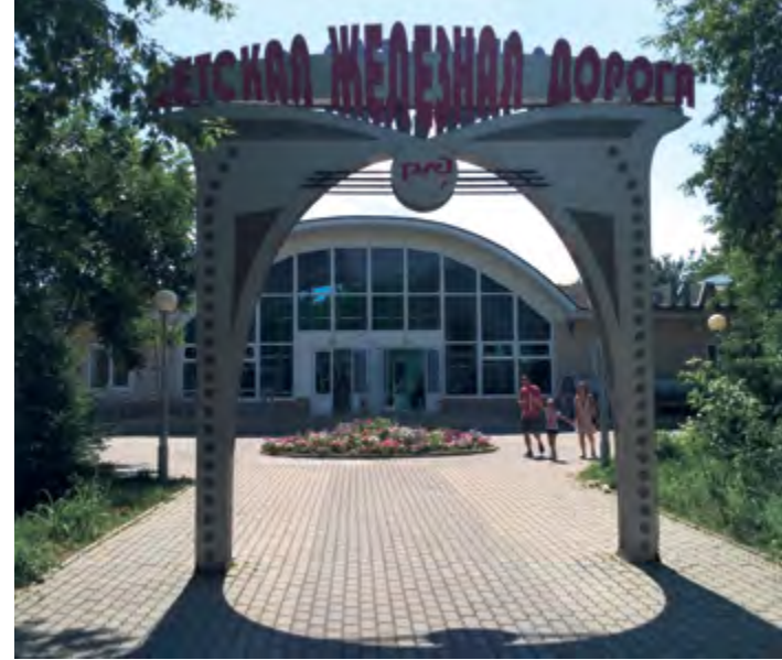
^ Рис. 10. Вход на вокзал детской железной дороги Центрального парка. 2019.

составляющей этого проекта стала интеграция пешеходных пространств квартала и территории Центрального парка, а также строительство дополнительной ветки детской железной дороги. Ее использование предполагалось не только как аттракциона, но и как инфраструктуры для специальных мероприятий – продуктовых ярмарок и базаров, народных гуляний, презентаций.