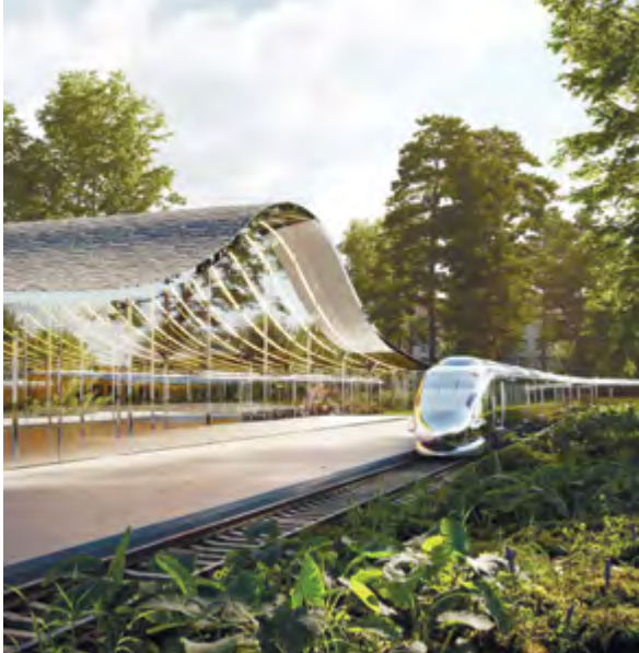
^ Рис. 13. Конкурсный проект Центрального парка Красноярск консорциума под руководством Архитектурного бюро «Базис» (Москва, Россия). Фрагмент [8]