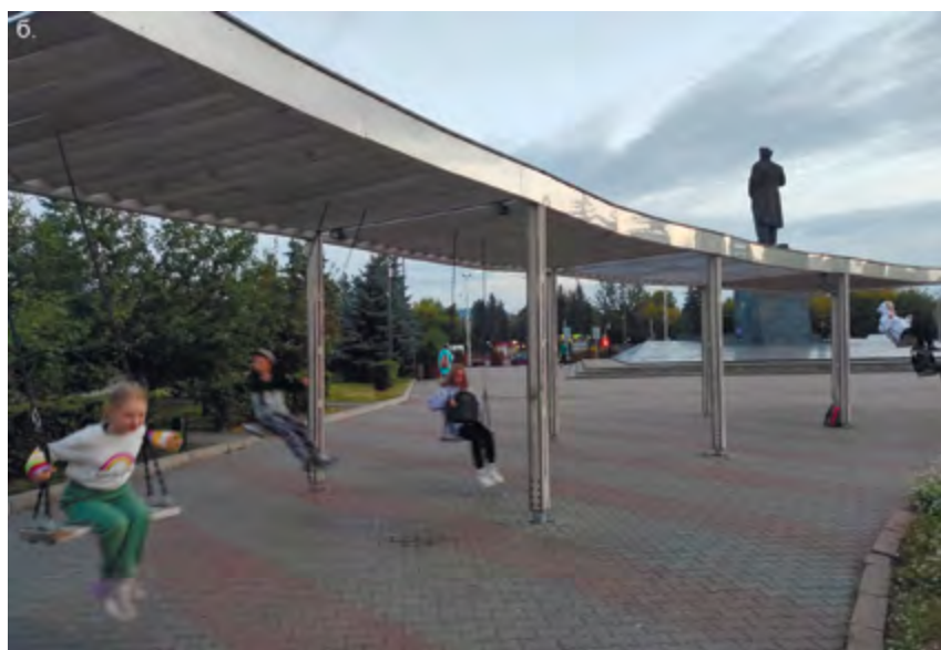
▲ Рис. 8. Площадь Революции Красноярска как продолжение открытого общественного пространства Парка культуры и отдыха им. Горького: а – зеленый партер площади Революции; 1970-е [5]; б – качели площади Революции. 2021.

эта идея была только в 1950–1970 гг. (рис. 8а). Идея распространения открытого общественного пространства для активного отдыха из парка на площадь Революции нашла свое продолжение в 2018 г., когда на административной площади установили качели и гамаки (рис. 8б).