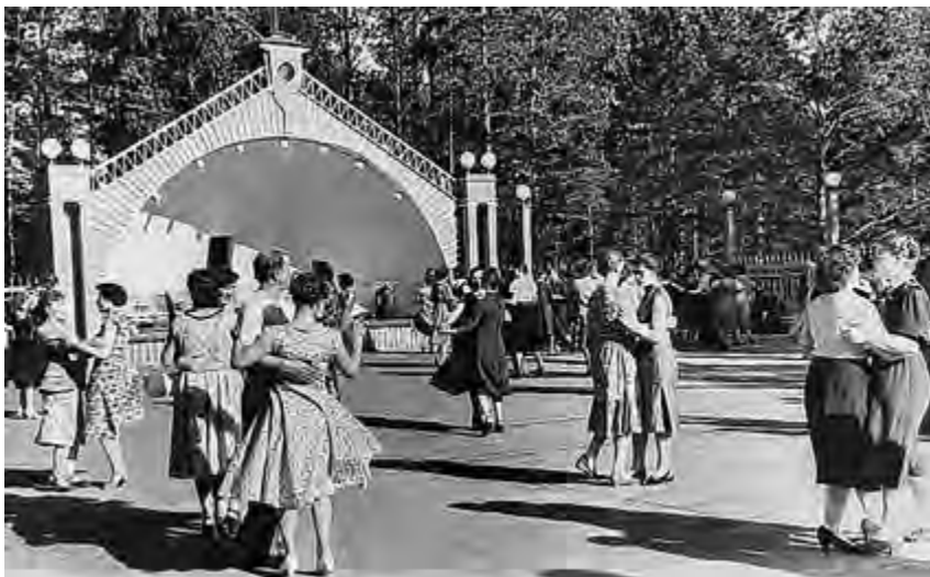
в Рис. 11. Площадка с эстрадой в парке: а – танцы, 1960-е [5]; б – танцы, 2021.

Ключевая идея проекта: «Природа – новый аттракцион». Команда видит новый парк как «уголок девственной тайги», сохраненный когда-то во время его основания. Претерпев различные трансформации в течение почти 200 лет, он вновь возвращается жителям города (рис. 13).