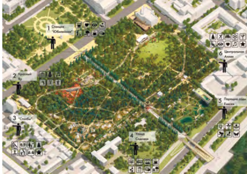
^ Рис. 16. Конкурсный проект Центрального парка Красноярск российско-британского консорциума под руководством МАП (Москва, Россия). Проектное решение [8]

8. Исторический квартал II / Официальный сайт компании «А2». – URL: http://www.proa2.ru/projects/histor-kvartal-2 (дата обращения: 12.08.2021)