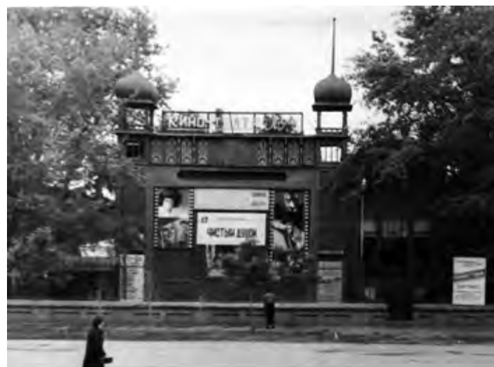
^ Рис. 7. Здание кинематографа В. А. Полякова. 1908 [5]

оркестр, устраивались народные гулянья, встречи по интересам. Каждую весну горожане участвовали в уборке сада и посадке декоративных деревьев.