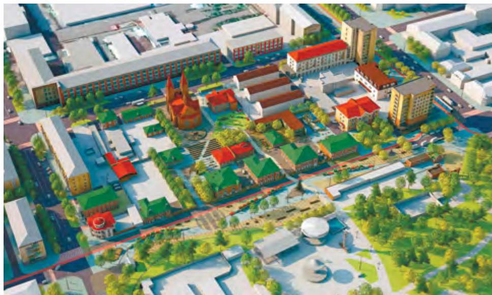
^ Рис. 12. Концепция общественного пространства «Исторический квартал» г. Красноярск. 2017 [7]

Концепция проекта работает на трех уровнях. Первый уровень привносит в парк характер края, его природную составляющую в виде лесов, гор и могучей реки. Второй уровень отражает локальную идентичность при помощи использования местных материалов: сиенит, мергель и алюминий. Третий – выражает актуальный общественный запрос жителей, которые больше хотят видеть этот парк как место тихой рекреации, «когда на место устаревшим аттракционам придет примат его природы. Природы как нового аттракциона» [9].