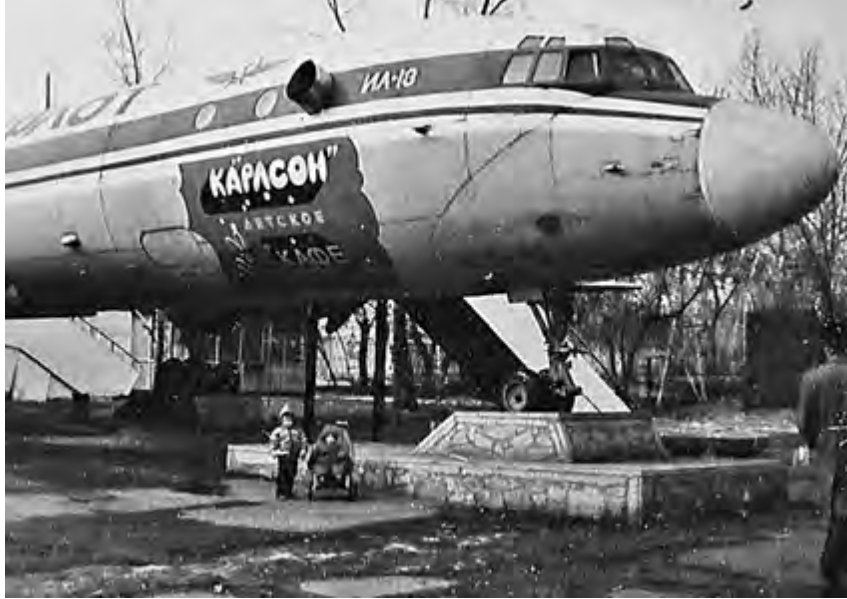
^ Рис. 9. Кафе «Карлсон» в корпусе самолета Ил-18. 1977 [4]