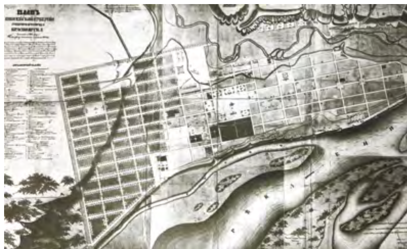
^ Рис. 2. План губернского города Красноярска. а – 1828 г.; б – 1852 г.

на Енисей и расположение на одной оси и в непосредственном соседстве с новой Соборной площадью (ныне площадь Революции).