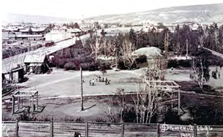
^ Рис. 6. Участок «детского сада» в Городском саду. Фото 1903.