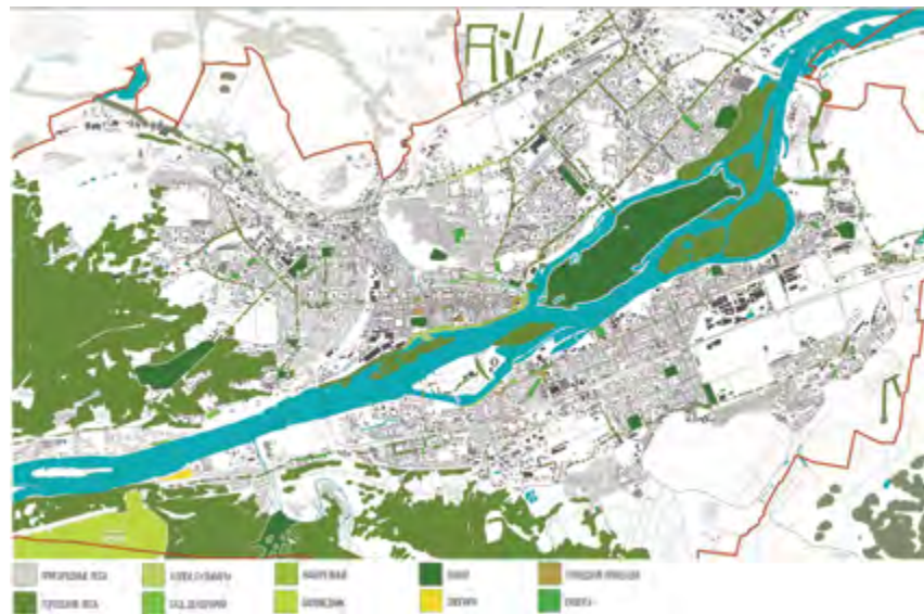
в Рис. 1. Парки в системе зеленых пространств Красноярска [3]

На плане губернского города Красноярска 1828 г. (рис. 2а), выполненном петербургским архитектором В. И. Гесте совместно с губернским архитектором П. Ф. Воцким, публичный сад обрел четкие границы прямоугольного участка размерами 440 × 270 м, был правильно геометрически распланирован [4]. В соответствии с этим планом площадь сада составляла примерно 1/40 (2,5%) по отношению к площади города. Проектный план не был полностью воплощен в жизнь, но 1828 год считается годом рождения публичного городского сада в Красноярске, и в то время он представлял единственное озелененное общественное пространство. Принципиально важным стало композиционно-пространственное расположение сада на плане города, его раскрытие