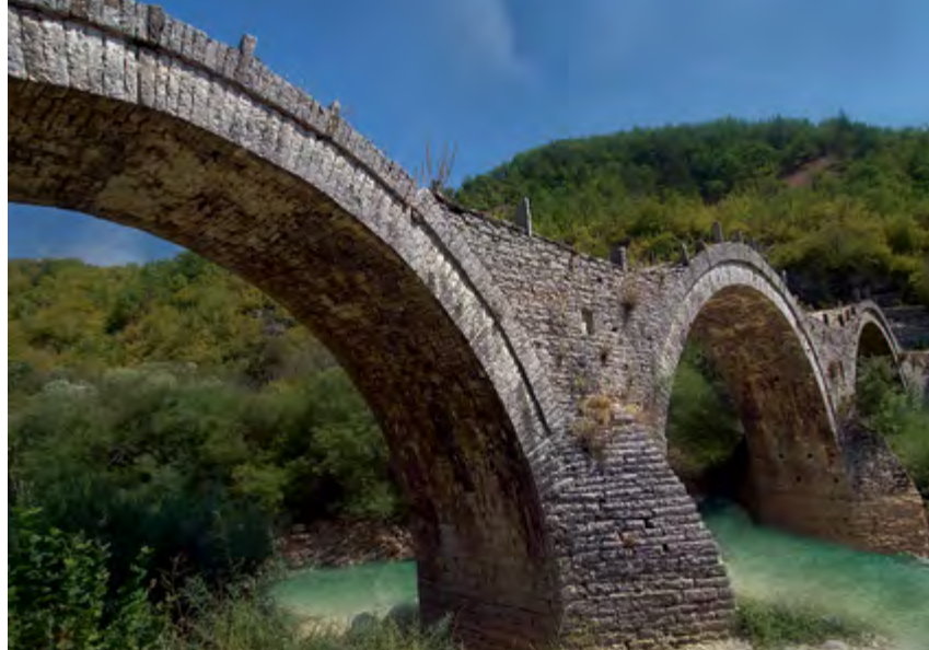
^ Рис. 4. Каменный мост "Калогерико", Загорохорья, Греция, 1814 г.

Мост – очень большой монополист на выразительность; он готов делить свою власть лишь с Башней, а уж если с Аркой – то под собой или в составе Башни. Оттого мост, «усиленный» арками по сторонам (для натяжения вант, держащих его или делающих вид, что держат) много теряет в символической целостности и смысле. Арочные фермы, особенно в исполнении В. Г. Шухова, который, кстати, размещал их и внизу проезжего полотна моста, еще терпимы в силу их очевидной симпатической вовлеченности в работу, но арки вантодержания уже лишь коннотируют работу, пусть бы и реально ими исполняемую, денотируют же собственную гордыню. И такая пустая денотация заглушает генуинные смыслы моста, превращает его в симулякр самого себя. Это обстоятельство тоже можно преодолеть, имея вкус и талант, а также имея дело с гигантским пролетом, окупающим подобные символические жертвы и даже иной раз выводящим общий символ моста на какие-то новые горизонты. Но его слишком часто игнорируют инженеры, ослепленные выморочной пластикой и возможностями своих конструкций и нечуткие к мифопоэтике: таков Puente Bac de Roda (мост Калатравы) в Барселоне, мост им. Кубичека в Бразилиа и, увы, не только они.