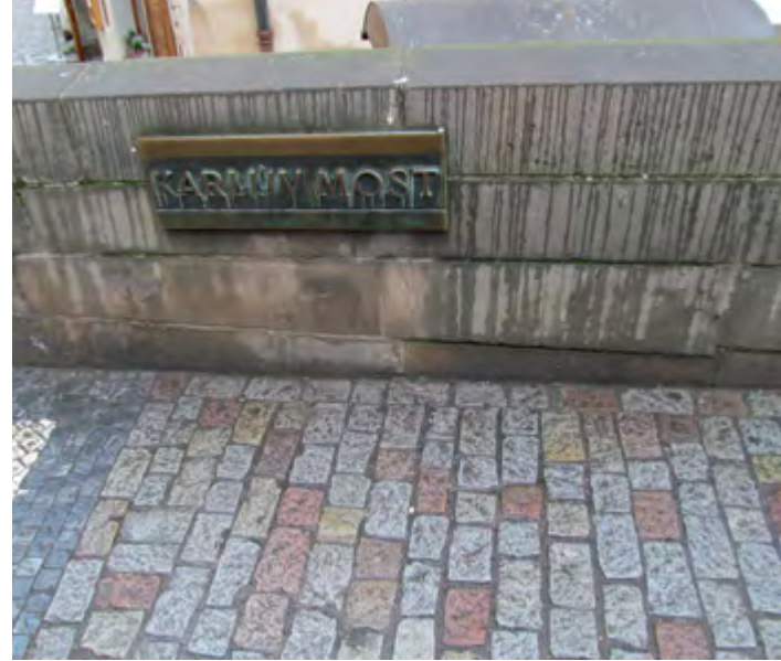
^ Рис. 6. Карлов мост в Праге, мощение

сто несводимо к точке на карте, это не более чем ловушка нашей исчисляющей семиотики). Это не сеть: его дление не бесконечно, и оно само есть локальность бльших масштабов, нежели сам мост и его потребная размерность. В качестве точки (point) мост (pont) пребывает в пространстве легенды дороги (ср. «легенда на дороге») булавочным уколом (i) на планкарте устойчивых перемещений. Однако счастливое совмещение точки и линии (отрезка дороги, который не уступит целому) – не следствие одного только согласования масштабов. Это – топическая особенность мостов (или, если угодно, их понты 4 ), свойство их пребывания в пространстве и возмещения занимаемого ими места. Локация имеет продолжение в стороны, бессмысленна без них; но и сам Мост, презентуя оговоренную (как правило – видимую) часть Дороги, задает ей смысл, стиль и камертон.