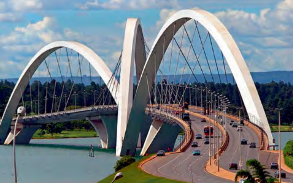
^ Рис. 5. Мост им. Ж. Кубичека, Бразилия, арх. А. Чан, 2002 г.