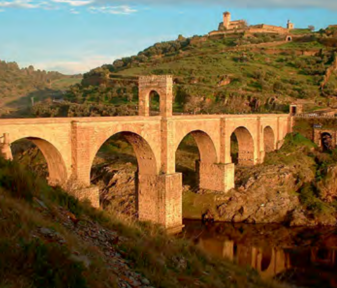
^ Рис. 3. Мост Алькантара на реке Таго, Испания, 104 г.