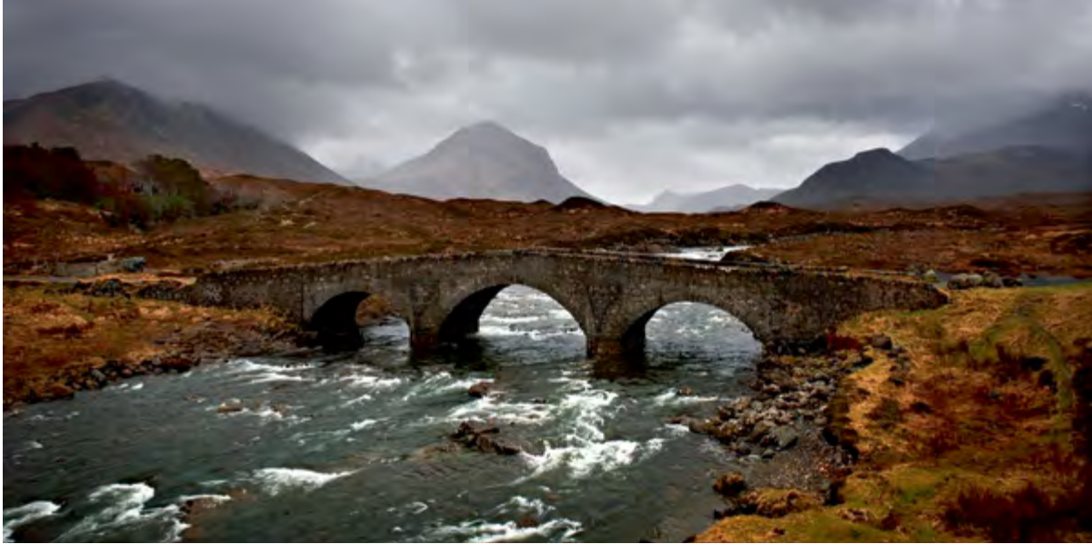
^ Рис. 7. Мост на острове Скай, Шотландия