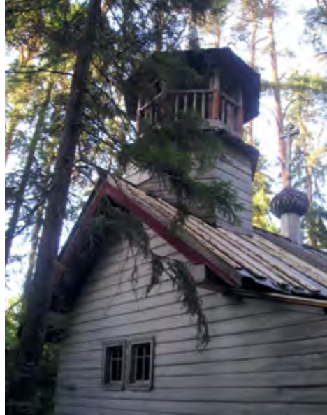
< Рис. 12. Часовня Параскевы Пятницы в священной роще. Дер. Тырышкино, Плесецкий р-н, НП «Кенозерский». XIX в.

Широкие, сродни хозяйственной и оборонной архитектуре, косяки окон, ассиметричное односходное крыльцо по типу «рундук», крутые повалы, крытая лемехом главка на тонкой длинной шейке-барабане, врубленная в коньковую слегу крыши, придадут часовне неповторимое архитектурное своеобразие (рис. 13, 14). Внутри часовни располагался «ложный алтарь» – имитация церковной апсиды. Это явление зачастую было распространено на территориях с сильными старообрядческими традициями. Еще реже встречалось решение «ложного алтаря».