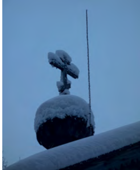
^ Рис. 14. Главка Троицкой часовни. Дер. Вальтево. 1728.

к следующим группам: место проведения богослужения. Для его осуществления из крестьян выбирался наиболее грамотный, уважаемый человек, обладавший хорошим голосом. По канону в часовне из-за отсутствия алтаря не могли совершаться таинства. Тем не менее, это правило нарушалось на Русском Севере. В часовне крестили новорожденных и отпевали умерших. Реже в часовнях совершалась литургия. В таких случаях священник приносил с собой антиминс и проводил на нем службу. В исключительных случаях происходило венчание, об этом свидетельствует указ Святейшего Синода от 18 августа 1769 г. о разрешении венчания в часовне.