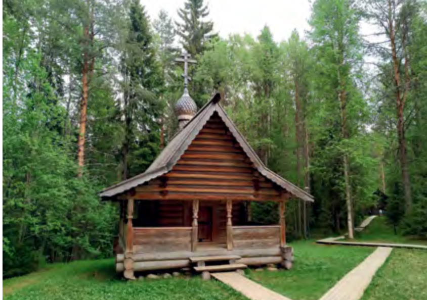
^ Рис. 23. Ильинская часовня. Дер. Мамонов остров, Плесецкий р-н. XVIII в.

заветных праздников – проявление регенерирующей способности традиционной культуры, сохраняющей под христианской формой архаическое содержание» [11, с. 216]. Часовня – явление истинно народной северной архитектуры, в котором отражаются сакральные смыслы деревянного зодчества и феномен народного православия (рис. 22, 23).