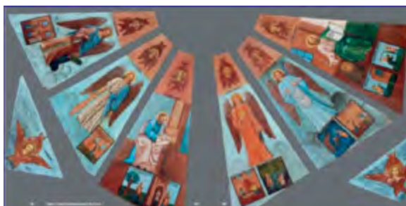
< Рис. 9. Небо в Никольской часовне. Дер. Усть Поча. 1881.

Причины постановки часовен определяются в соответствии с их типологическими признаками. С учетом выполняемых функций малые храмы можно отнести