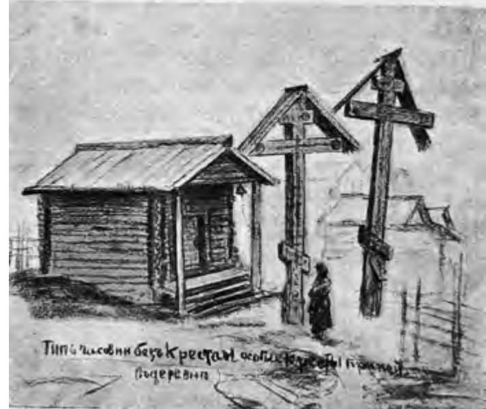
^ Рис. 20. Часовня-амбаронка. Мезень. XIX в. Рис. Н. Шабунина. 1908