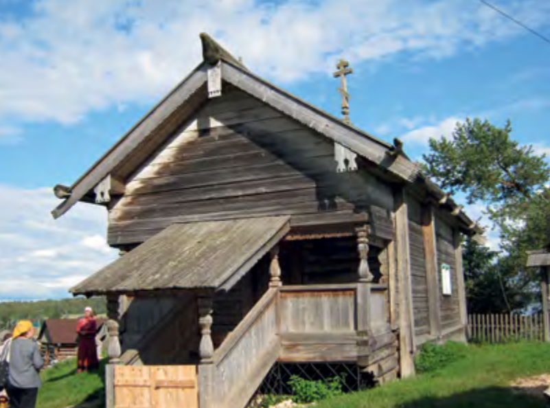
^ Рис. 8. Никольская часовня. Дер. Усть Поча, Плесецкий район, НП «Кенозерский». XVIII–XIX вв.