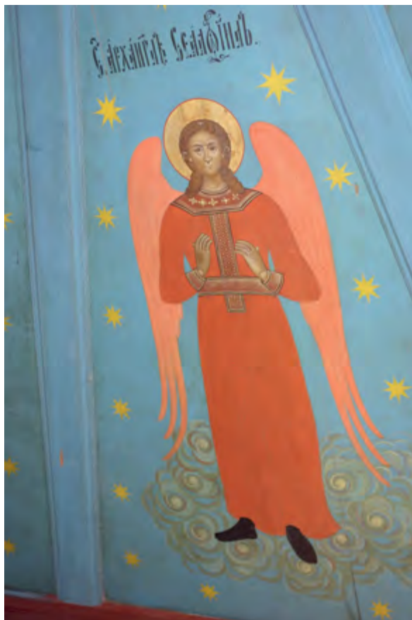
> Рис. 7. Фрагмент неба в часовни Св. апостола Иоанна Богослова. Дер. Зехнова.