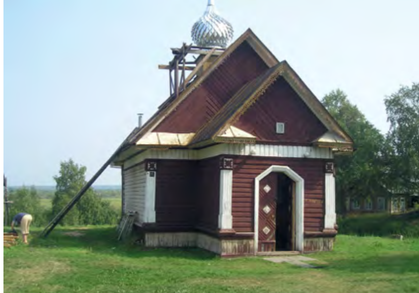
^ Рис. 17. Часовня Св. Петра Черевковского. С. Черевково, Красноборский р-н. 1658.