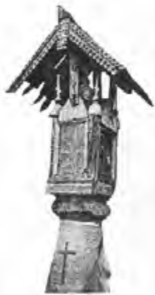
^ Рис. 22. Столбик-часовенка. Холмогорский уезд Арханг. губ. XVIII в.

Поморы так объясняли причины возведения часовен: «Мы отправлялись в море для звериных, морских и рыбных промыслов, чувствуем потребность помолиться и попросить у Господа помощи о благолепном плавании среди льдов, о промысле, как единственном средстве добыть себе насущный хлеб и успешно возвращении к своей семье» [10, с. 175].