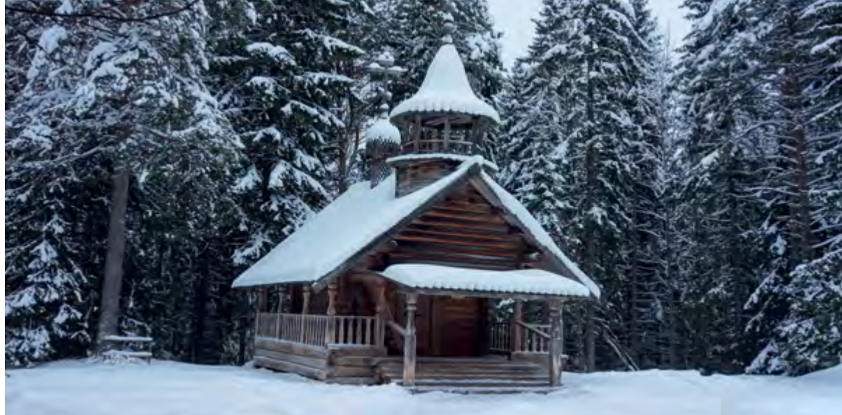
< Рис. 3. Часовня Макария Унженского. Дер. Федоровская, Плесецкий р-н. XVIII в.

крыльцо, чуть шире дверного проема основного молеельного помещения, с устроенной над ним восьмигранной шатровой звонницей с резными лопастками-поллицами. В 1972 г. после перевозки в музей «Малые Корелы» реставрация была выполнена д-ром арх-ры А. В. Ополовниковым и арх. В. А. Суслиным. С запада галерея переходит в широкое крыльцо с 5 ступенями, которые опираются на вертикальные столбики различных размеров, составляющие единое решение с балясинами галереи. Крыльцо имеет пологую односкатную кровлю. Перед входом на паперти устроена лестница на звонницу. Изящная главка с крестом крыта городчатым лемехом. С внешним обликом часовни гармонирует ее внутреннее убранство: двухрядный иконостас и расписное «небо» (рис. 3, 4).