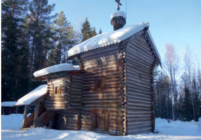
^ Рис. 13. Троицкая часовня. Дер. Вальтево, Пинежский район. 1728.