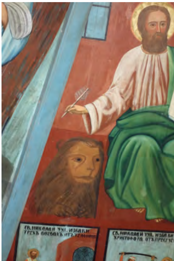
< Рис. 10. Фрагмент неба со львом в Никольской часовне. Дер. Усть Поча. 1881.