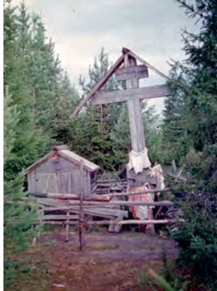
^ Рис. 21. Часовня-келейка около дер. Азополье. Мезень. XIX в. 1971