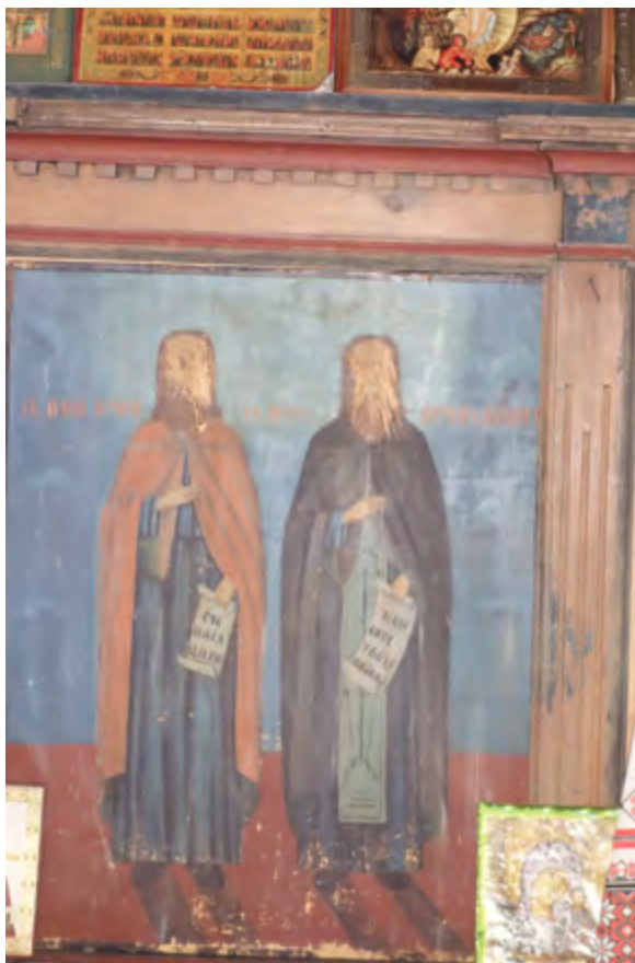
< Рис. 16. Поруганные иконы Никольской часовни. Дер. Вершино, Плесецкий район, НП «Кенозерский».

ная кадьница. На полу – деревянный ящик с углями, у другого окна – стол в виде анаоя. На полках – семь ковриг черного хлеба и одна рыба, видимо для промышленников, заблудившихся, или заставших непогодой» [8]. Часовня не запиралась и была доступна для всех желающих помолиться. Чтобы поддерживать часовни, промысловики жертвовали 24-ю часть белужьего промысла, покупали свечи на ярмарках в Пинеге и раздавали артели промысловиков.