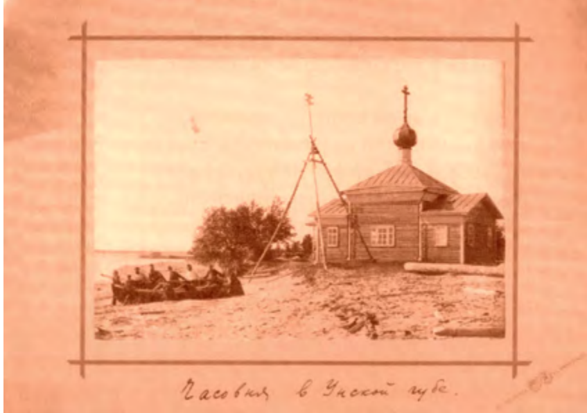
^ Рис. 19. Часовня в Унской губе Белого моря. XIX в.