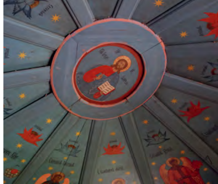
^ Рис. 6. Расписное небо в часовни Св. апостола Иоанна Богослова. Дер. Зехнова.

лись оградой. Внутри подобных священных роц могли располагаться: часовня, крест, особо почитаемое дерево, целебный источник, камень. Принципиальное значение в роце приобретает ее свойство границы, в особенности при расположении в поле или на возвышенности. Сюда приходили лечиться, пить воду, молиться. При этом на деревьях вблизи источников, на иконах и крестах оставляли одежду, ткань, ленты, деньги и другие приношения. Здесь же совершались крестные ходы в празд-