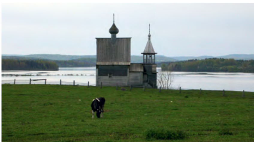
v Рис. 15. Никольской часовня. Дер. Вершинино, Плесецкий район, НП «Кенозерский». XVIII в.

в богословских и светских исследованиях – это вторичная, сопутствующая причина, а не главная. Некоторые регионы Русского Севера имели значительное количество часовен. В Каргополье, куда входило и Кенозерье, в XIX в. было 49 церквей, 169 часовен и молитвенных домов. Однако внутри Каргополья Кенозерье выделяется тем, что часовен здесь больше, чем церквей, в 10, а на самом озере – почти в 20 раз (рис. 15, 16).