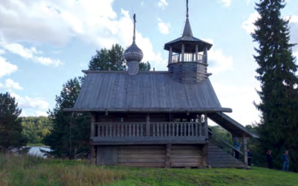
^ Рис. 5. Часовня Св. апостола Иоанна Богослова. Дер. Зехнова, Плесецкий р-н, НП «Кенозерский». XVIII в.