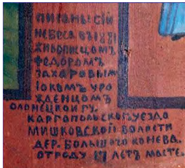
< Рис. 11. Подписное небо в Никольской часовне. Дер. Усть Поча. 1881.