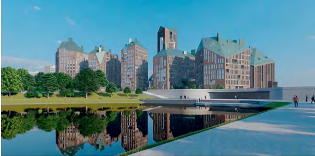
< Рис. 12. Студия 44. Проект центра Калининграда