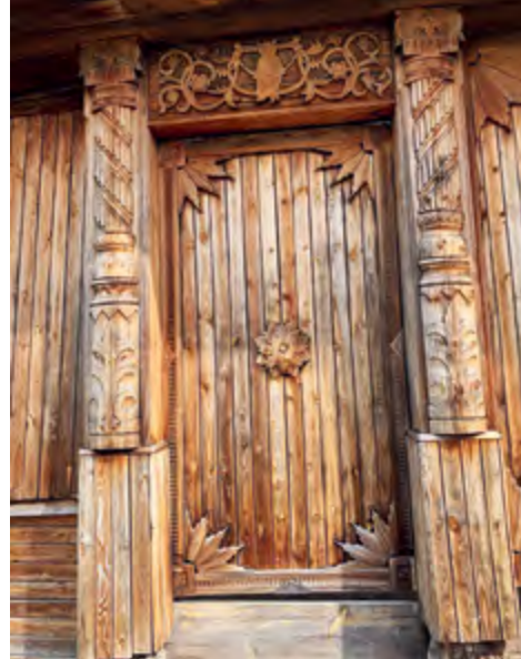
^ Рис. 5. Ворота деревянного дома. Нижняя Сиячиха. XIX в.

ились в глубинах сознания разных народов, сменили имена и даже стали христианскими святыми, то есть уступили первенство и заняли локальные позиции – иногда навсегда, иногда на время.