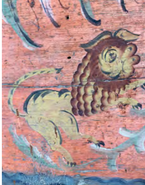
> Рис. 4. Роспись в интерьере уральского крестьянского дома. Нижняя Сиячиха. XIX в.