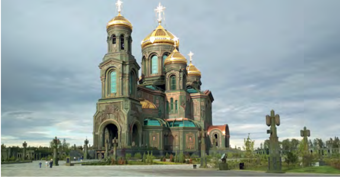
< Рис. 6. Главный храм Вооруженных Сил

в неоклассике? А может древняя псковско-новгородская архитектура даст ключ в поисках национального кода? Или все же более соответствует представлениям об искомом, православном русско-византийский стиль?