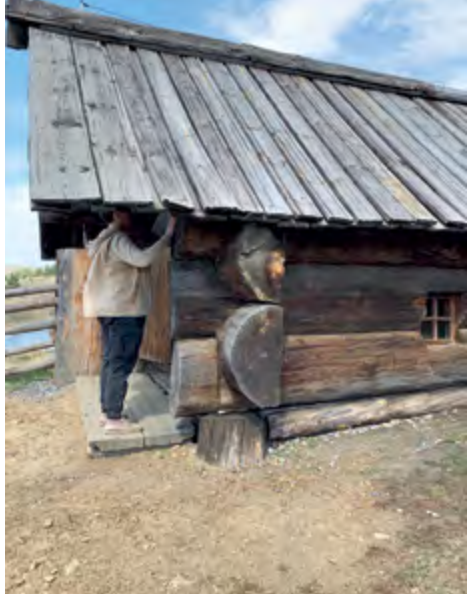
> Рис. 3. Баня из деревни Городище Алапаевского района. Нижняя Сиячиха. XVIII в.