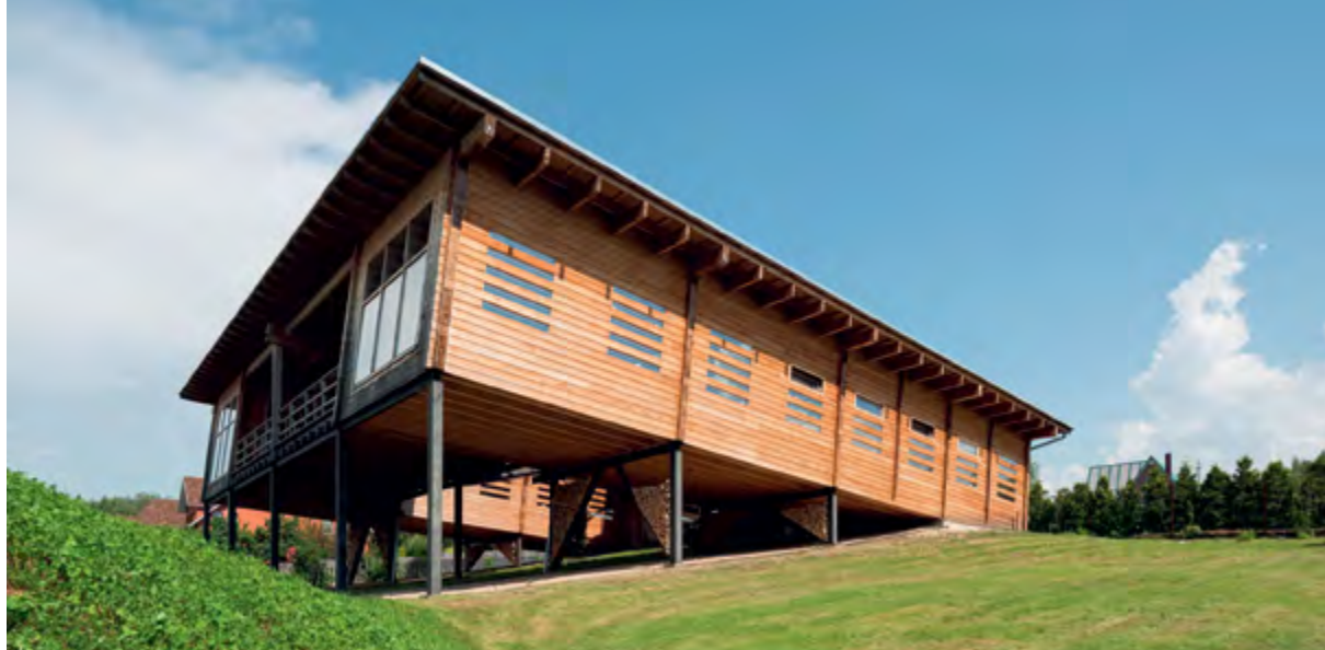
> Рис. 10. Собственный дом Тотана Кузембаева в деревне Лиды