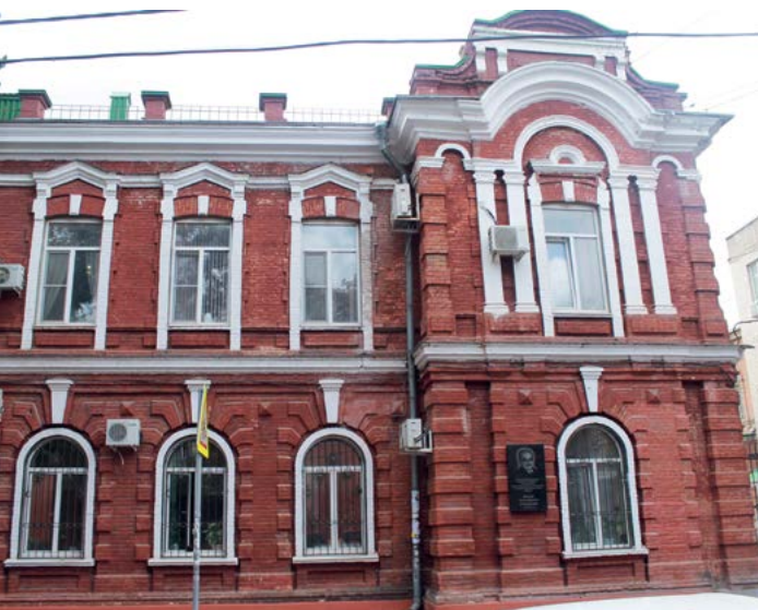
^ Рис. 1. Дом Трудолюбия им. П. Р. Максимова. Архитектор Н. М. Соколов. Фото Юлии Петрусенко, 2018