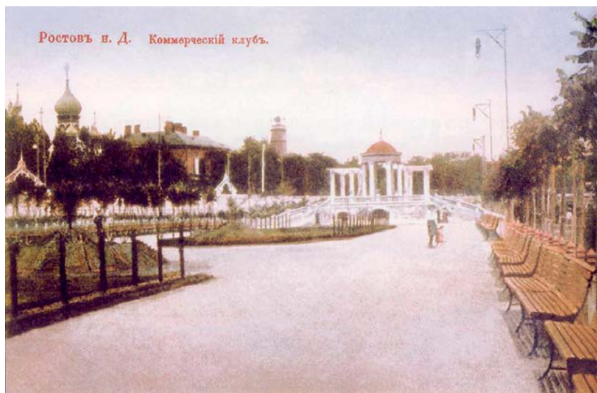
^ Рис. 2. Коммерческий клуб. Открытка. Ростов-на-Дону [15]