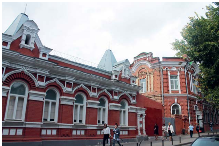
^ Рис. 4. Дом трудолюбия им. П. Р. Максимова. Архитектор Н. М. Соколов. Ростов-на-Дону. Фото Юлии Петрусенко 2018