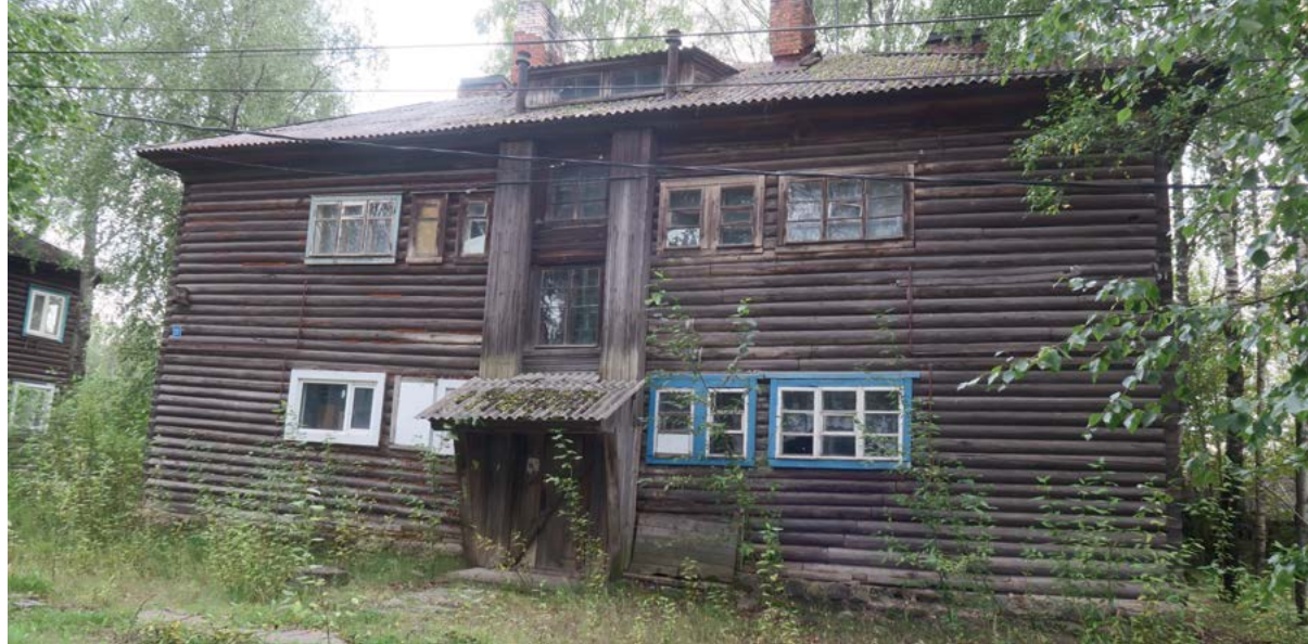
< v Рис. 25–28. Чагода. Постройки. 2020

ми наличниками и скатными кровлями столица Эстонии признала своим архитектурным наследием, которое бережно восстанавливается (рис. 29–31).