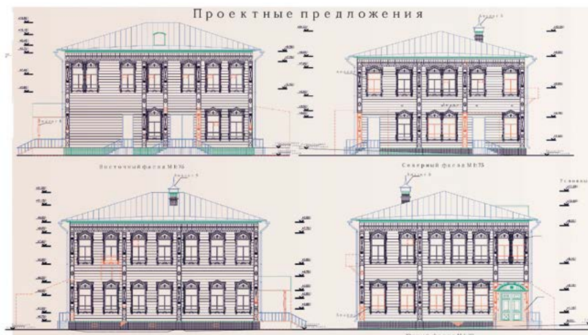
^ Рис. 18–19. Проект приспособления деревянного жилого дома под элитное жилье. К. В. Манило (ТГАСУ). Рук. Л. С. Романова

провинцию, а «жизнь в провинции страдает от комплекса подражания» [10, с. 183]?