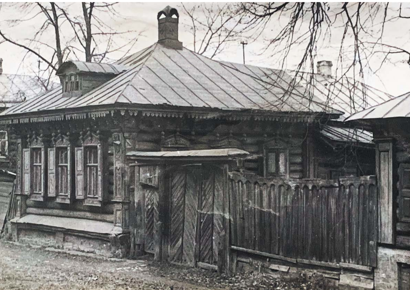
в Рис. 15. Тула. Деревянная застройка. 1976–1977

и эстетическая ценность. Об этом можно судить не только по опросам населения, которое до сих пор, в основном, мечтает переехать в многоквартирные новостройки, но и по дачной застройке последнего времени, в которой преобладают капитальные строения. А если деревянные дома все же строят, состоятельная публика предпочитает отнюдь не русский дом, а финские сборные и немецкие фахверковые дома или швейцарские шале. Понятно почему: и в Скандинавии, и в Швейцарии, и в Германии, и во Франции, и в Италии, да и по всей Европе бытует подлинный культ своего национального дома, который бережно и любовно, до мелочей обихожен и профессионально (!) приспособлен к современным требованиям комфорта. В традиционном доме Европы жить престижно и удобно, что и подталкивает наших соотечественников с развитым комплексом неполноценности, значительно укрепившимся в последние десятилетия, к подражанию. Может, и вправду из великого многонационального государства мы превращаемся в захудалую европейскую