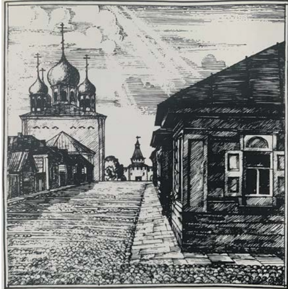
^ Рис. 14. Большая Кремлевская улица – первая улица Тулы. Рис. автора. 1977