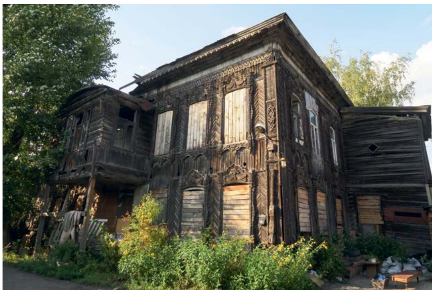
^ Рис. 8–9. Томск. Деревянная застройка. 2019