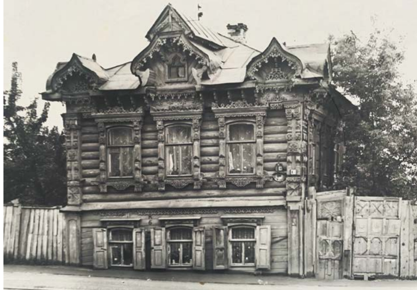
^ Рис. 15. Тула. Деревянная застройка. 1976–1977