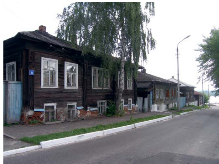
^ Рис. 1. Муром. Улица. 2005

Wooden architecture is regarded as a basis for Russian cultural identity. A short journey into the history of its preservation is made. The design and practical experiences of Irkutsk, Tomsk, Nyandoma and Tallinn are viewed as contemporary examples of preservation of wooden urban houses. The author considers starting demolition of the unique workers' settlement Chagoda built from wood in the constructivist style to be one of the recent losses. The article points out the necessity of cardinal public reevaluation of national values and a traditional Russian wooden house. Keywords: urban wooden house; museification of wooden structures in the USSR; 130 Quarter in Irkutsk; projects of preservation and reconstruction of wooden houses in Tomsk and Nyandoma; reconstruction of Kalamaja neighborhood in Tallinn; Chagoda settlement.