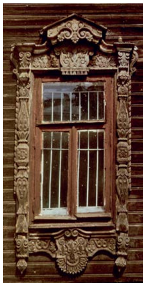
> Рис. 4. Москва. Наличник деревянного жилого дома в районе Божеедомки. 1970-е

И все же в каждом из регионов нашей страны деревянный дом имел свои образные, художественные и строительные особенности, обеспечивая и развивая богатство традиционной народной культуры. В Новое время он стал меняться под влиянием городской культуры, впитывать стилевые черты времени, что выражалось в его