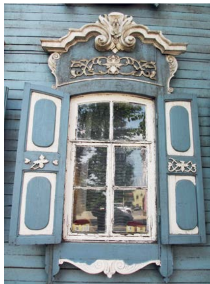
> Рис. 5–6. Иркутск. Наличники деревянных домов. 2013