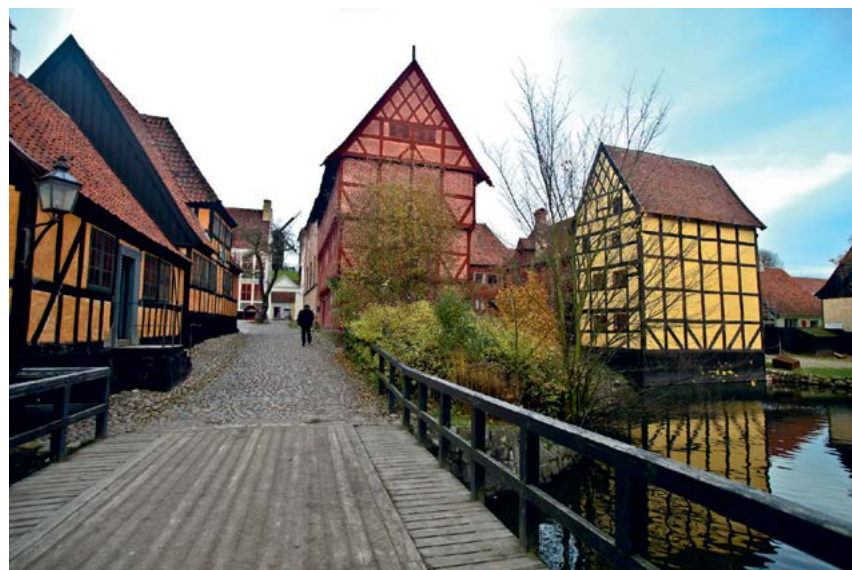
^ Рис. 10. Орхус (Дания). Улица музея «Старый город». 1914

онная городская деревянная застройка быстро уходит и из большинства средних и малых городов России.