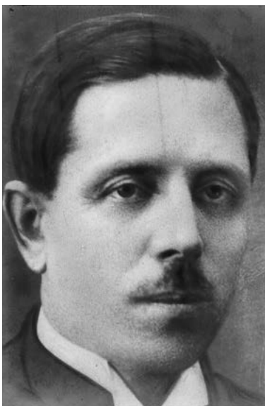
^ Рис. 1. Портрет С. Е. Чернышева (1881–1963). 1929–1930