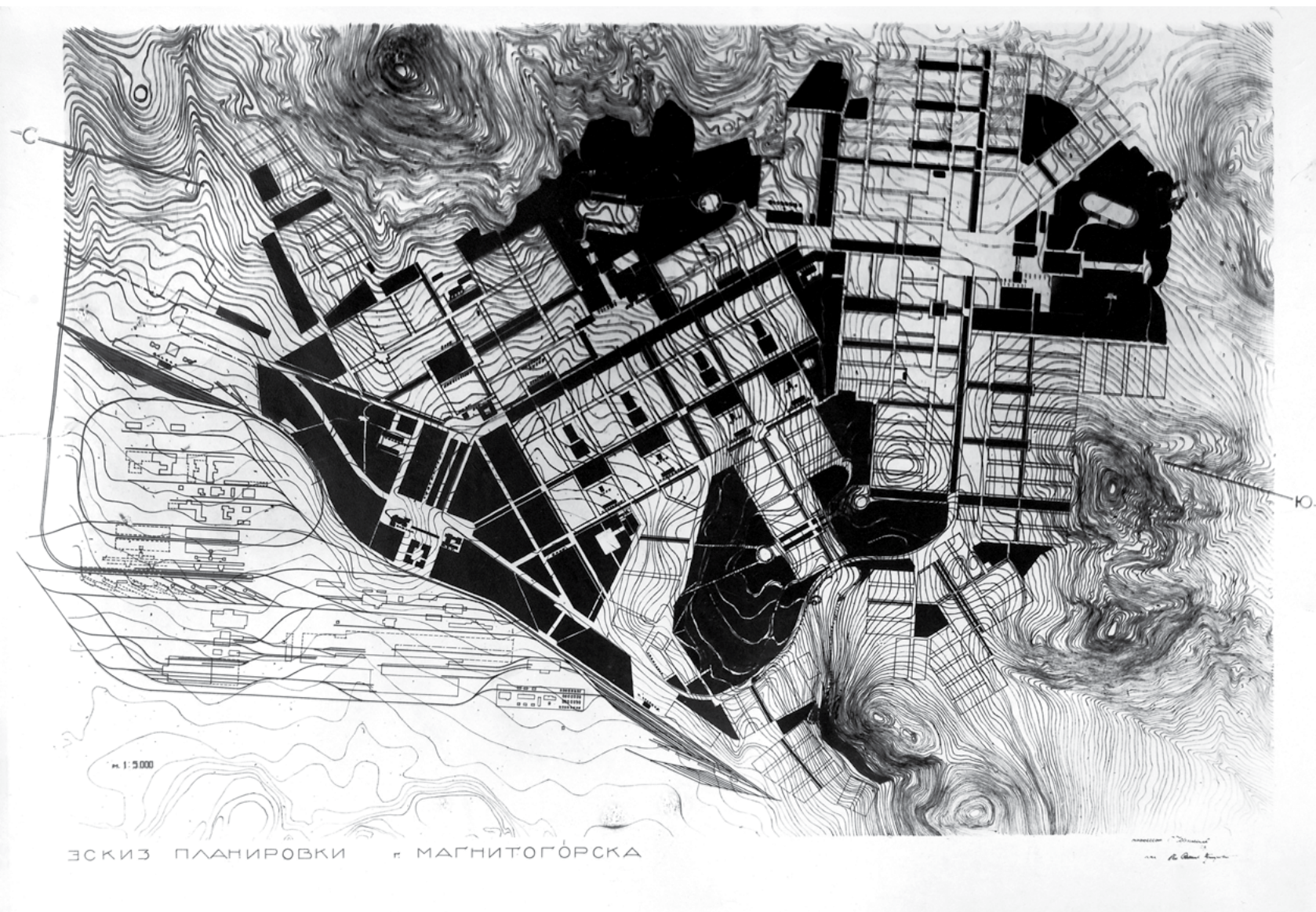
в Рис. 4. Эскиз планировки г. Магнитогорска. Арх. С. Чернышев, В. Семёнов-Прозоровский.

– «крупная» – кварталами, «притянутыми» к основной магистрали, с 4-этажными секционными домами (секция Моссовета) с плотностью 300 чел/га;