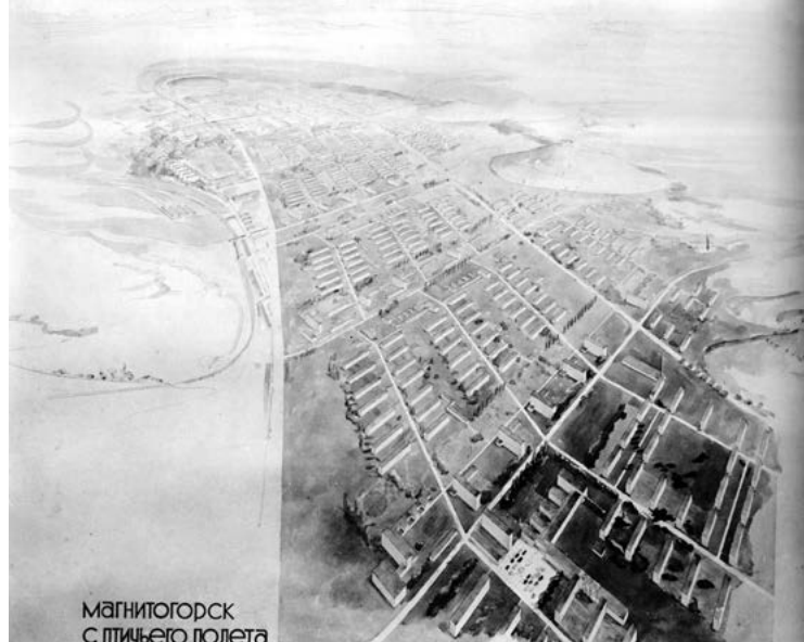
> Рис. 6. Магнитогорск с птичьего полета. 1931 [2, с. 156]