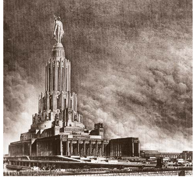
^ Дворец Советов. Проект Бориса Иофана. 1933

идей – от функционализма до типологии, эргономики, научной психотехники и индустриализации. Если бы Сталин увидел в этой по-своему весьма современной тогда идее магистральное направление архитектуры и всячески поддержал бы именно его, мы имели бы сегодня совершенно иную советскую архитектуру. Возможно, и совершенно иной вариант всей мировой культуры.