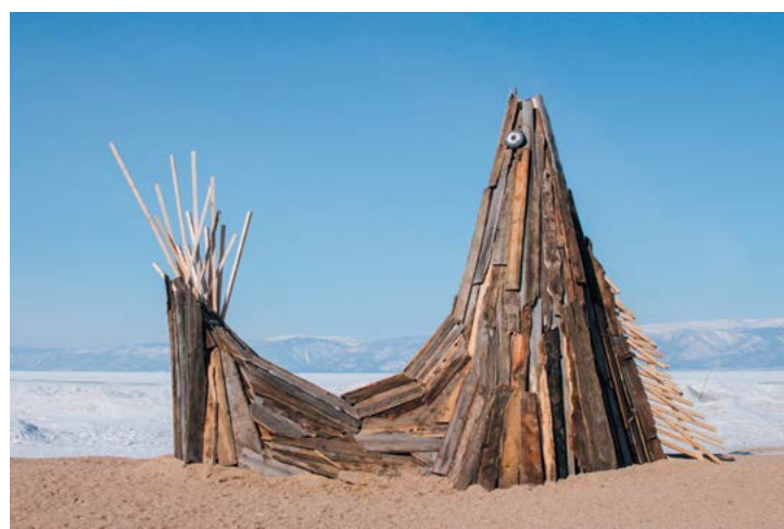
v II место