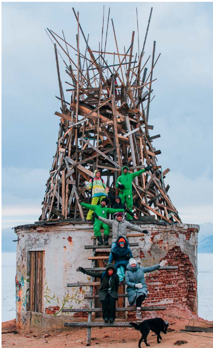
v Команда БухАрт

Отдельным призом награждена команда «Супер Твёрдый» за самую продуманную конструкцию и необычную идею. Члены команды создали «портал», проходя через который человек сможет увидеть все больше новых граней конструкции. Команда отправится по приглашению партнера, завода «Выбор», в Красноярск на экскурсию.