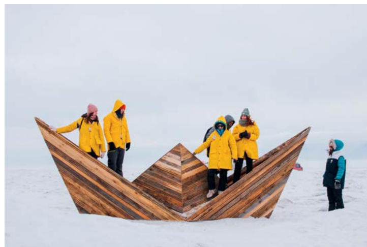
^ I место

III место получила команда четырех студентов 3 курса ИРНИТУ «Футурум». За четыре дня стройки они создали масштабный арт-объект «Круговорот». Объект представляет собой каркас с переплетением нитей, отсылающих нас к образу рыбацких сетей и промышленного лова рыбы, бывшего когда-то сердцем порта. Проходя через инсталляцию, можно прочувствовать кончиками пальцев дух и историю места.