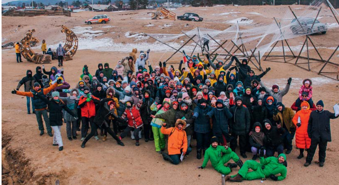
< Участники фестиваля

мостоятельная реализация арт-объектов. Кураторы поддерживали участников на протяжении всего времени. Благодаря этому уровень проектов повысился.