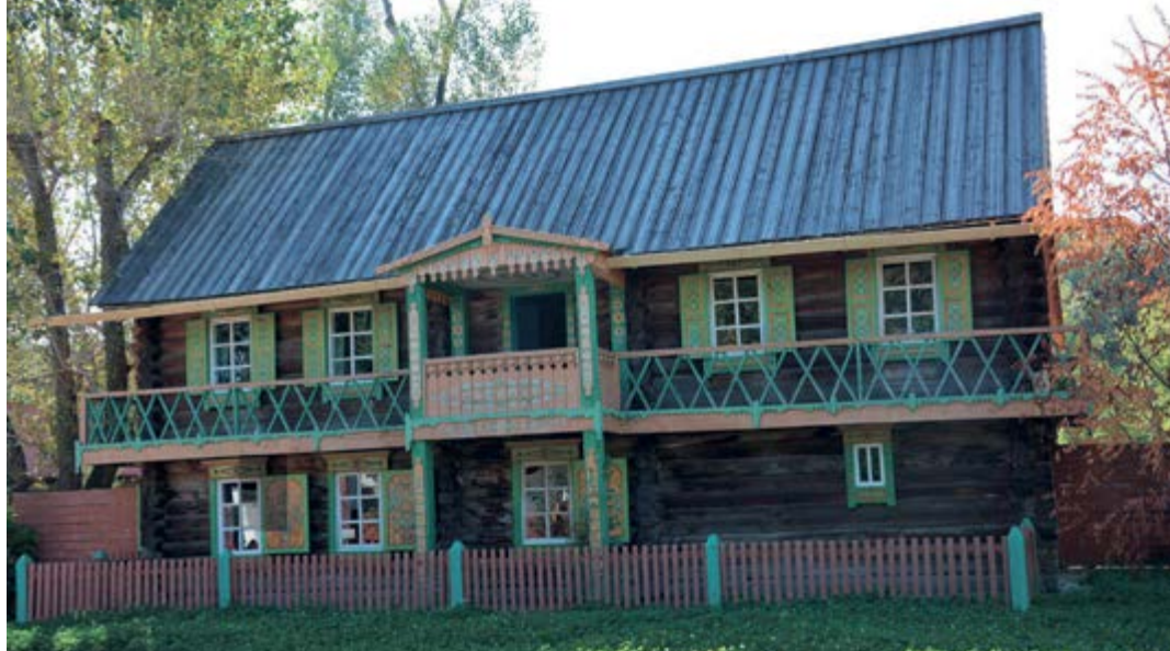
> Рис. 1. Усадьба крестьянина-старообрядца И. В. Коновалова в архитектурно-этнографического музея-заповеднике Усть-Каменогорска (перевезена из села Катон-Карагайского района верховья р. Бухтарма) [9]