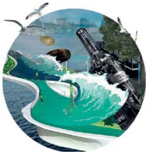
> Рис. 2. Арт-объект «Бутылка с посланием из прошлого»