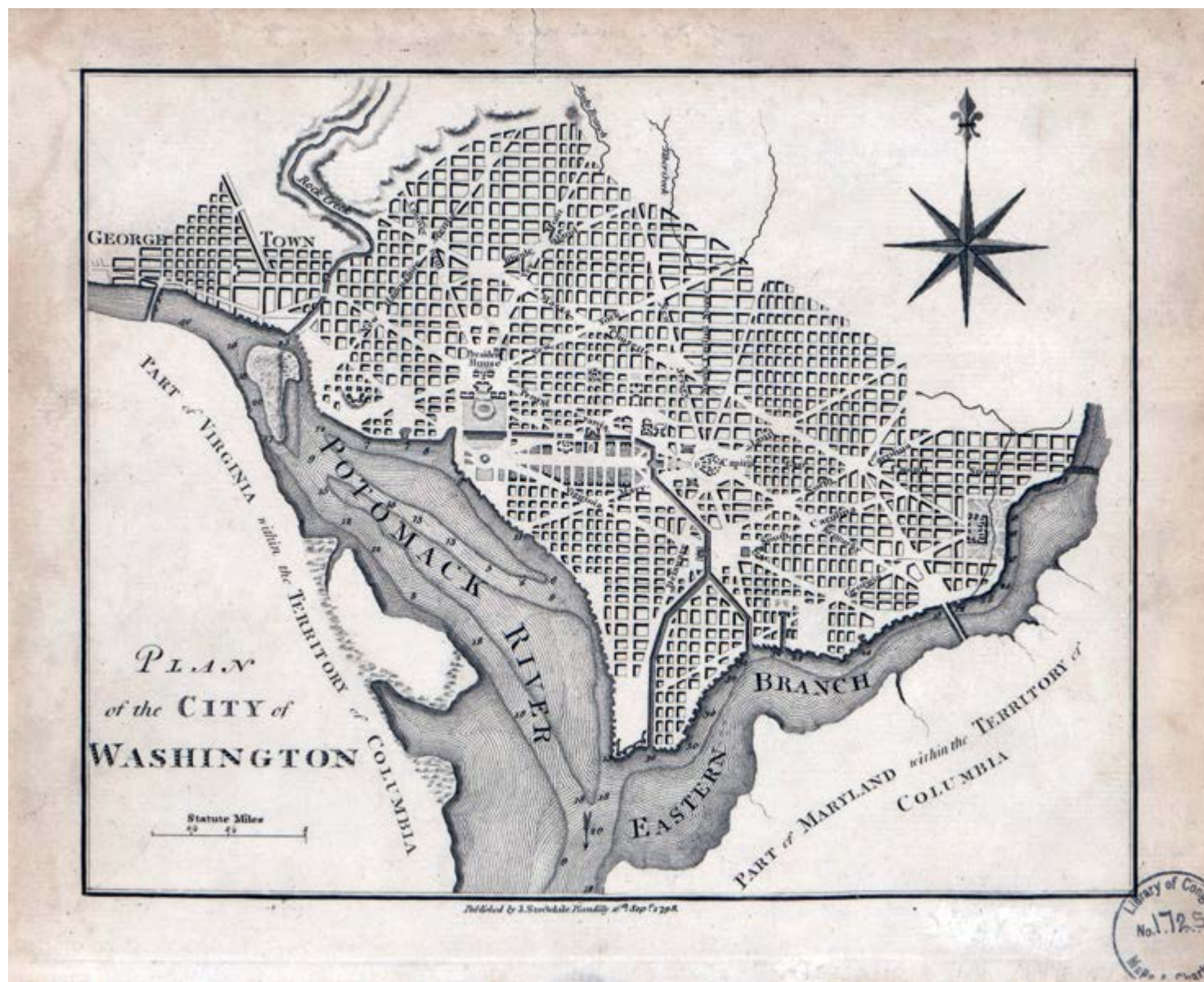
v Рис. 12. План Вашингтона сочетает ортогональную сетку кварталов, оживленную системой диагоналей, вызывающей ассоциации с планировкой Версаля