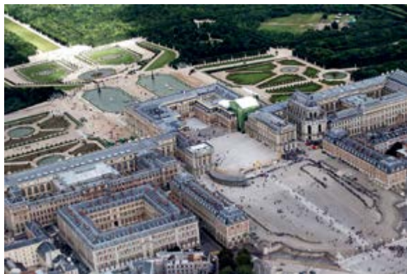
> Рис. 6. Ансамбль Версальского дворца «с высоты птичьего полета». Его пространственное устройство, понятное с первого взгляда, – идеальная модель видимого города. Воплощенный в структуре пространства Свет абсолютной монархии знаменует окончательный уход от «хаоса и темноты» города в условиях позднесредневекового разновластия

Вавилонский сценарий построения видимого города зафиксирован в ветхозаветном мифе о столпотворении.