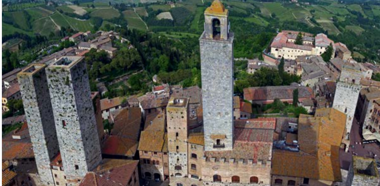
> Рис. 5. Средневековые башни в Сан-Джиминьяно

ни в солнце, ни в луне для освещения своего, ибо слава Божия осветила его, и светильник его – Агнец» (Откр 21: 23).