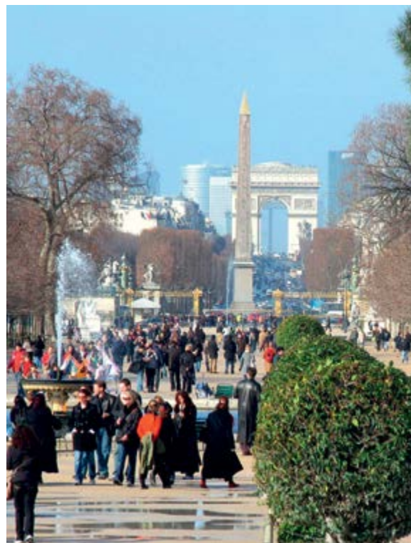
< Рис. 8. Перспектива, именуемая «исторической осью» Парижа. Вид из парка Тюильри. Современная оптика длиннофокусного объектива «сжала» пространство, совместив в плотный коллаж аллею Тюильри, Обелиск на площади Согласия, Триумфальную арку на площади Шарля де Голля и далекие небоскребы района Дефанс

Спустя семь десятилетий в российской столице случился еще один рецидив «вавилонского синдрома». Он выразился в планах строительства на территории Москва-сити грандиозной башни Россия по проекту Нормана Фостера. И вновь непомерность амбиций разбилась о реальность экономики. В 2009 году город отказался от реализации