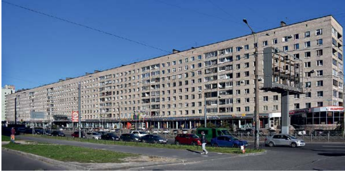
< Рис. 7. Трехвековое развитие системы регулярного плана города завершается вырождением изначальных смыслов и ценностей «горизонтального» дискурса. Запечатленная на фото улица Санкт-Петербурга носит символическое имя – проспект Просвещения («L'avenue des Lumières», как сказали бы три века назад, или «Просвет», как запросто говорят сегодняшние питерцы). В наши дни эта перспектива воспринимается архитектурным издевательством над градостроительными и общественными идеалами века Просвещения

и партнерства, рассчитывая «достучаться до небес» в одиночку. Города-коммуны с их враждой между светской и церковной властями, с их системой гражданского самоуправления не аккумулируют материально-технических и мастерских ресурсов для реализации коллективного проекта мега-башни, призванной «достать до Неба». Да это и не нужно, ведь в символическом смысле эту функцию исполняют храмы.