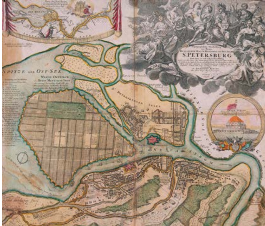
^ Рис. 9. Заданный Доменико Трезини план Санкт-Петербурга 1717 года отразил начальный этап застройки, еще при жизни Петра I. Ортогональная сетка кварталов и улиц Васильевского острова – несколько наивное, но весьма показательное отражение идеи рационалистической дисциплины пространства

неподъемного и, что важнее, бессмысленного мегапроекта. К счастью, ни сталинский СССР, ни тем более постсоветская Россия не в состоянии оказались «закрывать» вавилонский гештальт возведением соответствующего сооружения.