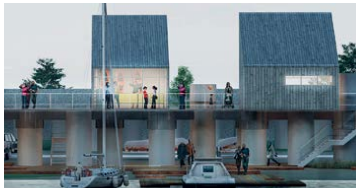
v Airat Zaidullin's design "Sail" (Russia) / Проект Айрата Зайдуллина "Sail" (Россия)

< Внешний вид стадиона «Артемио Франки» вскоре после его возведения, © Ferdinando Barsotti, 1932 / External view of the Stadio Artemio Franchi shortly after its completion, © Ferdinando Barsotti, 1932