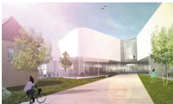
> Рис. 16. Оана Станеску. II место на конкурсе в Любляне, 2010 / Fig. 16. Oana Stanescu, second prize Ljubljana, 2010

от фабрики Casalgrande Padana в 2019 году (STUDIOARCA, n. d.) (рис. 18).