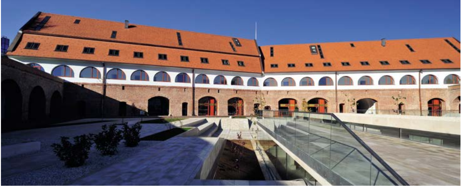
^ Рис. 12. Бастион Марии Терезии, 2012. / Fig. 12. Theresia Bastion, 2012.

3. Дополнительная информация: www.boltres.ro / For more information, see www.boltres.ro