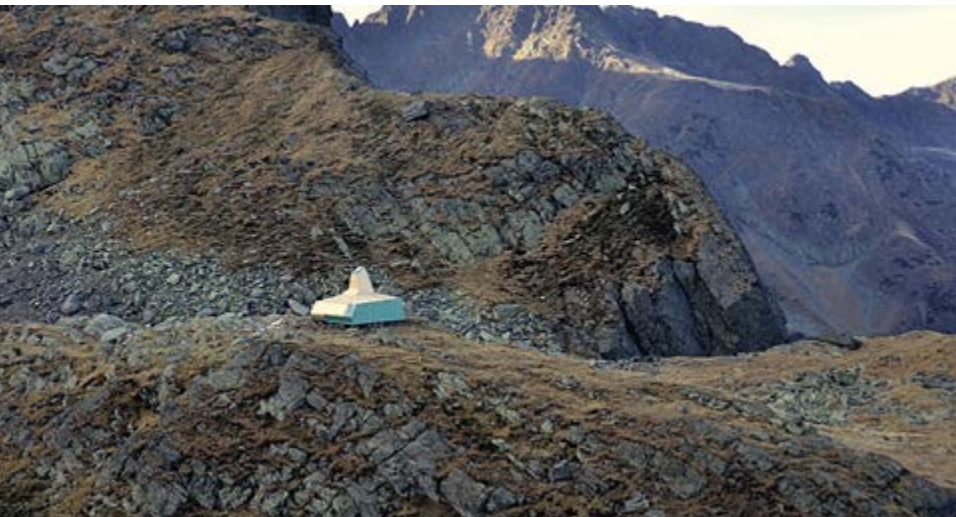
v Рис. 13. Приют, 2014. / Fig. 13. Refuge, 2014.

Майя Балдеа, Клаудиу Тома и Атилла Венкзел – участники группы Parasitestudio – большие поклонники авангарда, приверженцы новой геометрии, верящие в силу виртуального мироздания. Группа реализовала