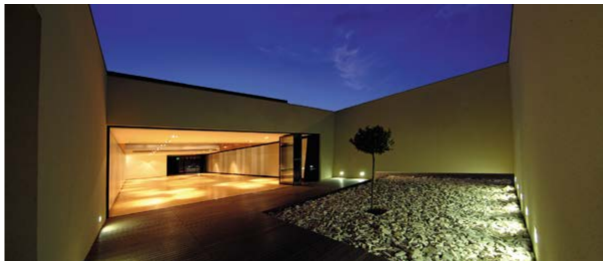
< Рис. 11. «Гармония», 2010. Фото: Ovidiu Micșa / Fig. 11. Harmonia, 2010. Photo credit: Ovidiu Micșa

Together with Z. Varday and other young colleagues, M. Miclăuș