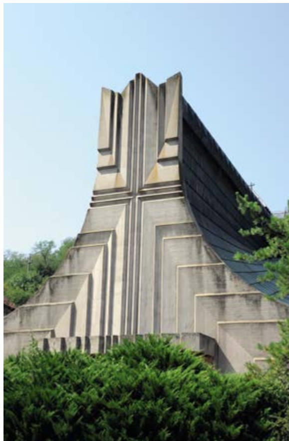
< Рис. 1. Католическая церковь в Орсове, 1976 Авторы: Ханс Факельман, Виктор Джюнцу, Петер Жекза. / Fig. 1. Hans Fackelmann, Victor Gioncu, Peter Jecza, Catholic Church in ORSOVA, 1976.

Влад Гайворонски Симина Кук / text Vlad Gaivoronschi Simina Cuc