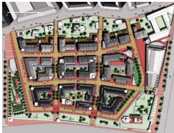
< Инвестиционный градостроительный конкурс на концепцию застройки Зарядья. Проект академика И. Лежавы. 2004

В 2006 г. начался демонтаж здания «России». В октябре этого же года известным архитектором Н. Фостером был представлен проект, вызвавший шквал критики; в декабре он представил новую версию с выявлением исторической сети переулков в сочетании с новой неисходной магистралью – от центральной площади к храму Василия Блаженного. Площадь застройки была значительно сокращена. После этого проекта прошло много лет, полных раздумий о судьбе места на фоне серьезных изменений в политическом поле Москвы, пока на глазах у публики в 2012 г. президент В. Путин и мэр С. Собянин приняли решение о создании на этом месте парка. Общество приняло это решение с восторгом. Но какой парк? Сразу после решения был всенародный конкурс предложений – почти 120 проектов со спектром от «ничего не трогать» до очередного мемориала. У него не было победителей, однако конкурс был важен как индикатор общественных настроений. С учетом его проводился международный конкурс на ландшафтно-архитектурную концепцию парка в Зарядье, завершившийся в 2013 г. победой международного консорциума под девизом «Природный урбанизм». В 2017 г. парк открылся для посетителей. Было создано общественное пространство, интегрированное с историческим прошлым, в котором представлена природа России. Это и образовательное, и культурное пространство, включающее два образовательных центра, медицентр, филармонию на 1600 мест. Уникальный «Парящий мост» с панорамами исторической Москвы – самое популярное место парка.