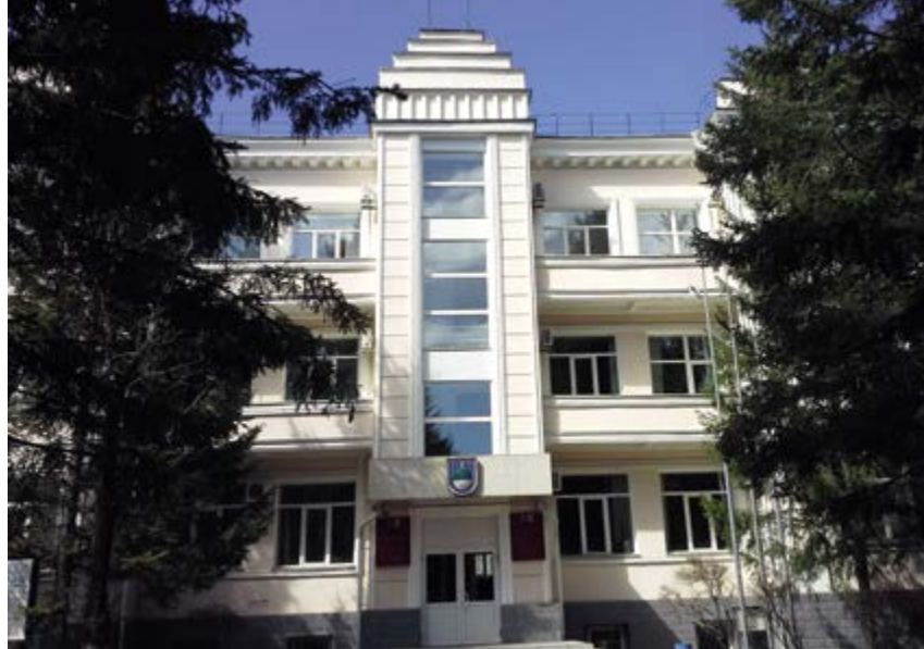
^ Рис. 6. Здание мэрии (Дом Советов), Биробиджан. Архитектор Н. Е. Трахтенберг. 1934. Являлось частью ансамбля, составлявшего по первоначальному проекту шестигранную площадь

Еще во времена первых обследований территории архитекторы школы Баухаус пытались выявить отражение национального колорита на местности и учесть его в дальнейшей работе. Так, Х. Майер писал: «Отражение в архитектуре соцгорода Биробиджана национальных элементов и их сочетания современными формами социалистического города меня сильно интересуют. Над этим вопросом работают, в частности, в одной из секций Комакадемии, в которой я участвую. Гипрогор при планировке, например, среднеазиатских городов учитывает элементы восточного стиля. Но ничего конкретного на заданный вопрос мы еще ответить не можем: вопрос выявлений и сочетаний еврейских национальных элементов в архитектуре совершенно не изучен» [9]. В итоге мы можем сделать вывод о том, что первоначальный внешний вид народной архитектуры города, со времен станции Тихонькая, находится в состоянии хаоса стилей, материалов и индивидуальных эстетик горожан.