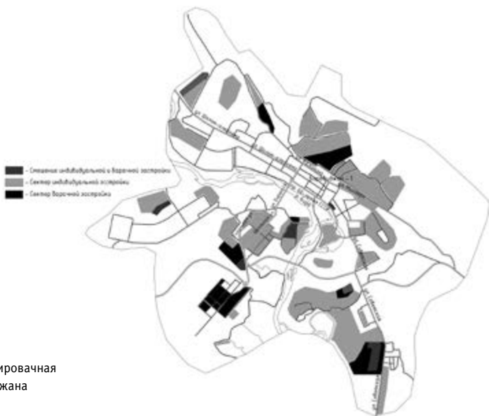
> Рис. 9. Планировочная схема Биробиджана

В культурном ландшафте Биробиджана встречаются надписи на идише, современные городские скульптуры, отсылающие к мифологии местечка (рис. 10), символы