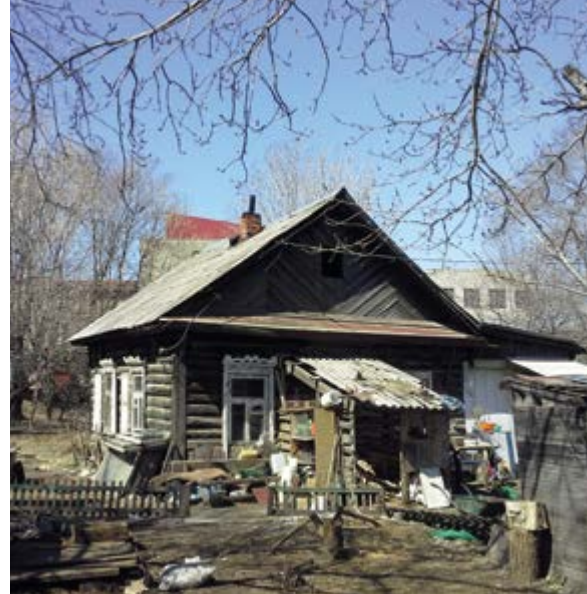
^ Рис. 4. Стадия «слобода». Переход от протоархитектуры к народной архитектуре. Биробиджан. Фото сделано в апреле 2019 года

Объемно-пространственная композиция и размеры жилья, заданные модулем бревна, остаются неизменными. Основные различия связаны с декором фасадов, полностью отсутствующим на стадии «деревня» (рис. 3), появляющимся в кустарном исполнении на стадии «слобода» (рис. 4) и приобретающим неожиданные коннотации ар-деко на стадии «город» (рис. 5).