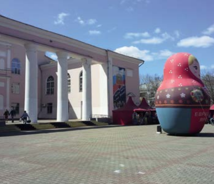
^ Рис. 8. Городской дворец культуры, Биробиджан, ул. Шолом-Алейхема, 11. Архитектор К. С. Барташевич. 1963