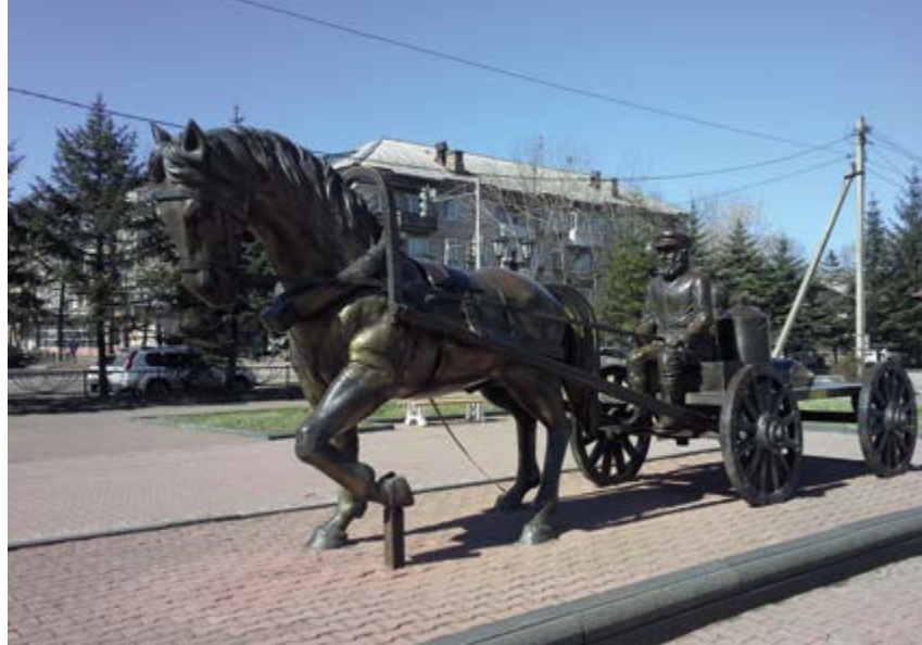
^ Рис. 10. Скульптурная композиция «Переселенцы». Биробиджан, привокзальная площадь

меноры; главные доминанты духовного пространства города – два здания синагоги. Но в подлинной народной архитектуре отсутствуют паттерны еврейской идентичности. Возможно, именно отсутствие четко артикулированной национальной культурной традиции косвенно послужило провалу проекта ЕАО как попытки создания искусственной еврейской земли обетованной.