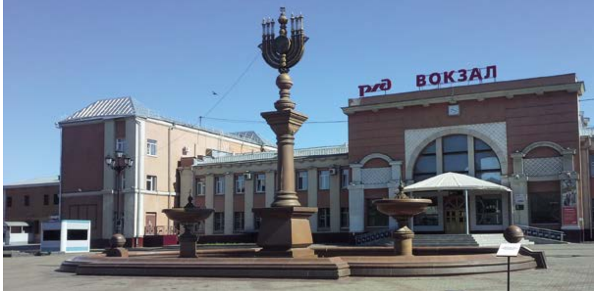
> Рис. 7. Железнодорожный вокзал Биробиджана

коттеджей на окраинах города: за железнодорожными путями, на правом берегу Биры, в восточном направлении по ул. Советской и за микрорайоном по ул. Широкой (рис. 9). Подобная архитектура начала массово появляться в городском пространстве в последнее десятилетие.