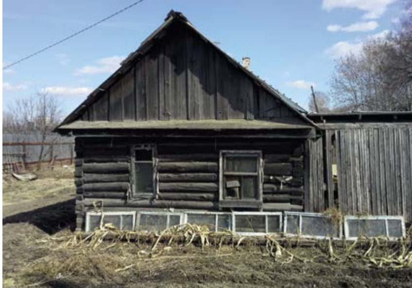
^ Рис. 3. Сохранившиеся без изменения избы на станции Тихонькая (ныне Биробиджан). Стадия «деревня». Фото сделано в апреле 2019 года