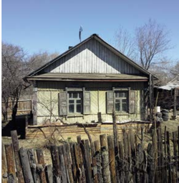
^ Рис. 5. «Городской» тип индивидуального дома, Биробиджан. Фото сделано в апреле 2019 года