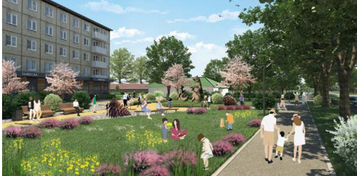
< Рис. 5. Карманный парк. Визуализация