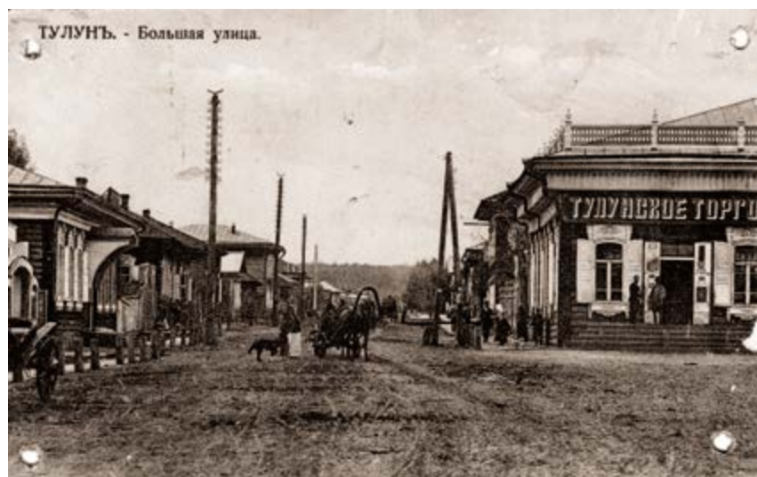
< Рис. 1. Вид на Большую улицу. Фото начала XX века. Краеведческий музей им. П. Ф. Гущина

Рассматриваются исторические, природно-ландшафтные, экономические условия развития Тулуна. Предлагаются стратегии обновления центральной части города, включающие реструктуризацию экономики, использование городского менталитета, сложившихся форм городской активности, соучастие горожан в проектировании и управлении территориями. Ключевые слова: Тулун; Ия; стратегии трансформации города; дизайн; экономика; продвижение; организация. /