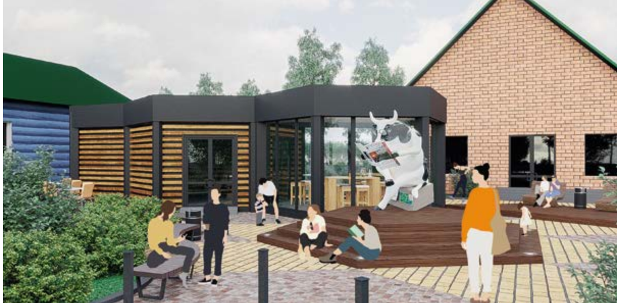
> Рис. 4. Кофейный дворик. Визуализация

ренцирование экономики города в новых условиях сжатия как пространственного, так и ресурсного. Но после катастрофического наводнения 2019 г. городу прибавилось проблем, связанных с восстановлением всей социальной, жилищной, инженерной инфраструктуры.