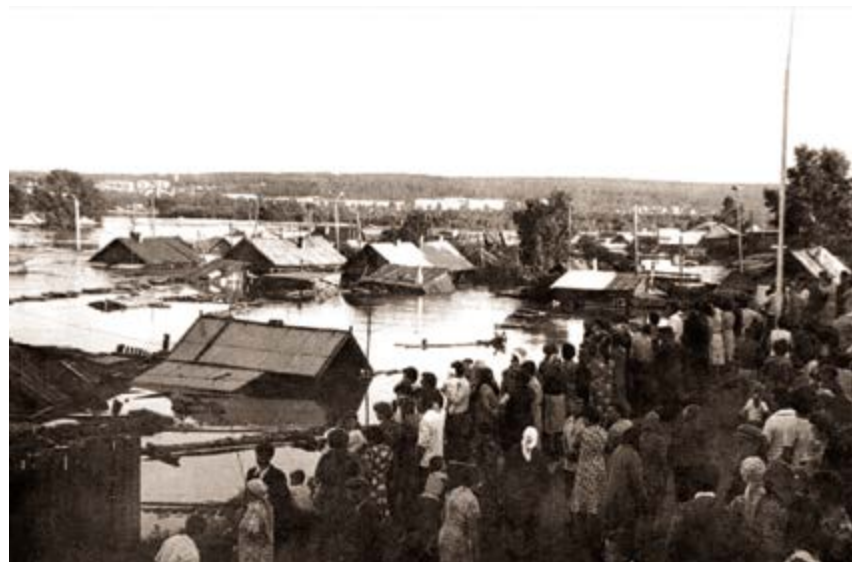
в Рис. 2. Наводнение. 1980-е годы.

В начале декабря 1897 г. тулунчане встречали первый поезд по Транссибу. Село Тулун становится железнодорожным пунктом и превращается в оживленный центр торговли. В село приезжали крестьяне не только из бли-