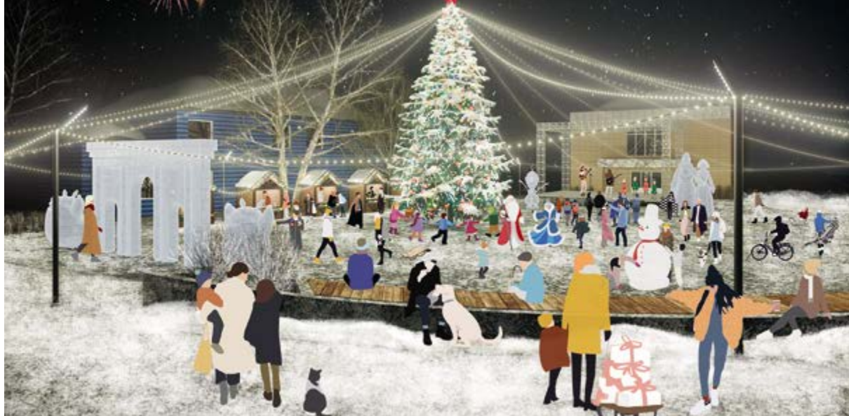
> Рис. 6. Городская площадь

существующего болота организация гидропарка, посадка растений ярусами для защиты от шума и пыли, высадка многолетних культур разнотравья для минимизации расходов на эксплуатацию, включение смотровых точек в систему общественных пространств.