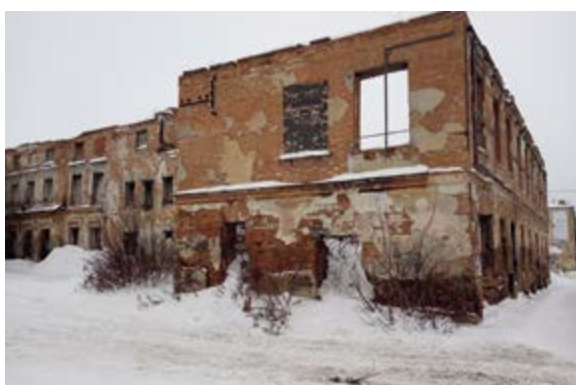
< Рис. 12. Историко-культурные объекты Ирбита. 2019; 2020.