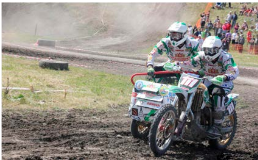
^ Рис. 16. Соревнования по мотокроссу. 2016. – URL: https://sun9-36.userapi.com/c636731/v636731295/1d0ba/4ey2Wgw9-xw.jpg