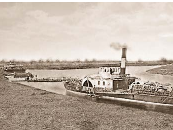
^ Рис. 8. Пароход на Ирбитской пристани. Конец XIX в. – URL: http://irbit.info/history/arh_photo/45/