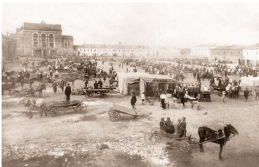
v Рис. 6. Торговая площадь и торговые ряды. Конец XIX в. Открытки [13]