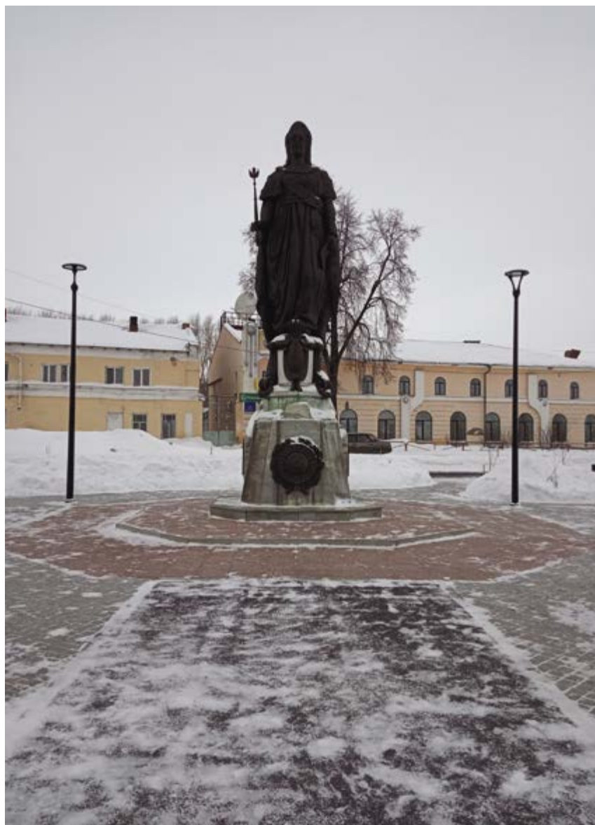
v Рис. 3. Памятник Екатерине II. Восстановлен в 2013.

Новым явлением, принесшим Ирбиту всесоюзную известность, стал мотоцикл «Урал», спроектированный московскими конструкторами на базе немецкого мотоцикла «BMW R-71». В годы Великой Отечественной войны (1941–1945) мотоциклы (модель М-72) в Ирбите собирали эвакуированные из столицы рабочие-мото заводцы. Всего за военный период Ирбитским мотоциклетным заводом было выпущено 9799 машин [2]. В послевоенный период Ирбитский мотозавод стал одним из флагманов машиностроения и крупнейшим производителем тяжелых мотоциклов с коляской. В сентябре 1967 г. решением Ирбитского городского Совета депутатов трудящихся утвержден новый вариант городского герба, где размещался силуэт мотоцикла с мотогонщиком (рис. 10). В начале 1990-х мотозавод, как и многие предприятия, вступил в полосу банкротств. Производственные мощности и кадровый потенциал резко сокращались.