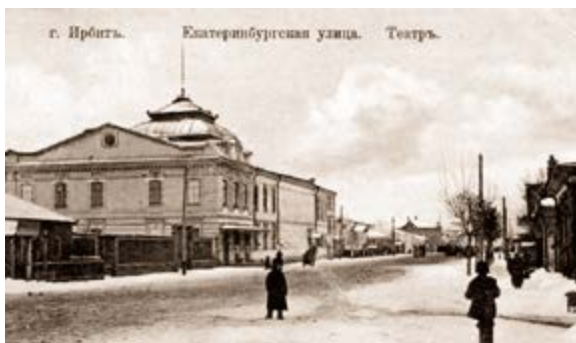
v Рис. 11. Здание драматического театра в Ирбите. Открытка.

Театральный репертуар не всегда привлекает горожан и гостей города. Так, 2 ноября 2020 г. на спектакль «Шутки классика» (по произведениям А. П. Чехова) пришло не более 15 зрителей. В праздничные и выходные дни театр недоступен для посещения гостями города.