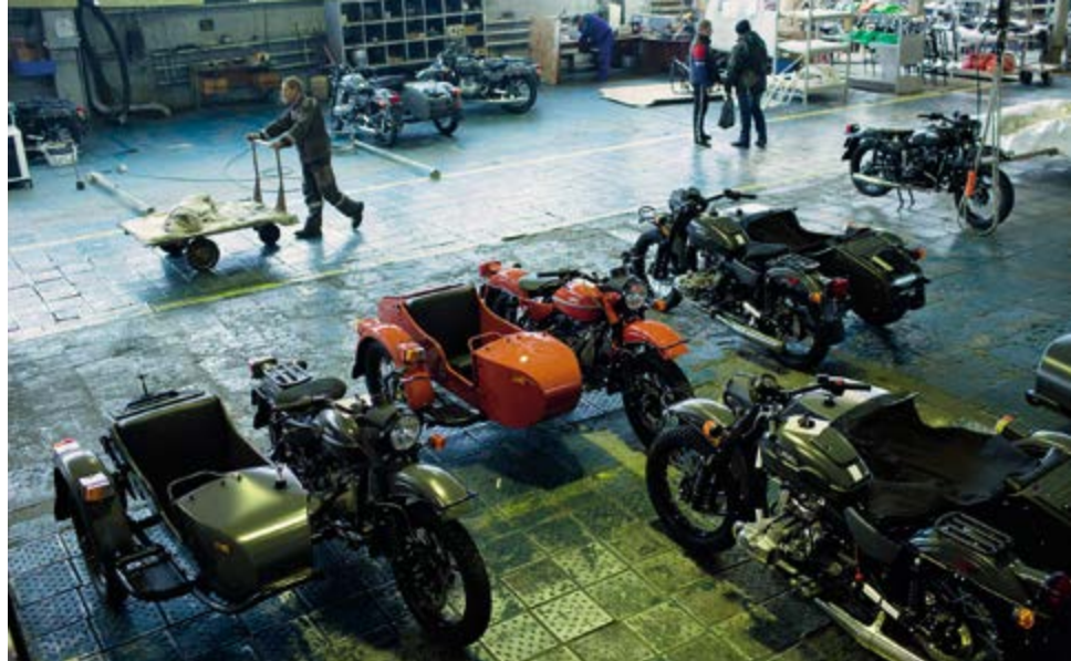
^ Рис. 13. Экспозиция Ирбитского музея мотоциклов.

подчеркивают, что на фоне Ирбитской ярмарки другим местным ярмаркам сегодня сложно выдерживать конкуренцию [1, с. 65]. Однако ни уникальным торгово-экономическим явлением, ни туристским брендом ярмарочные дни в Ирбите все же не стали. Назовем причины, которые не позволяют воссоздать в культурном ландшафте города ярмарочный геобренд.