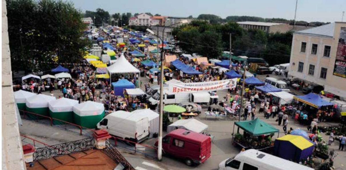
> Рис. 14. Ирбитская ярмарка–2019.