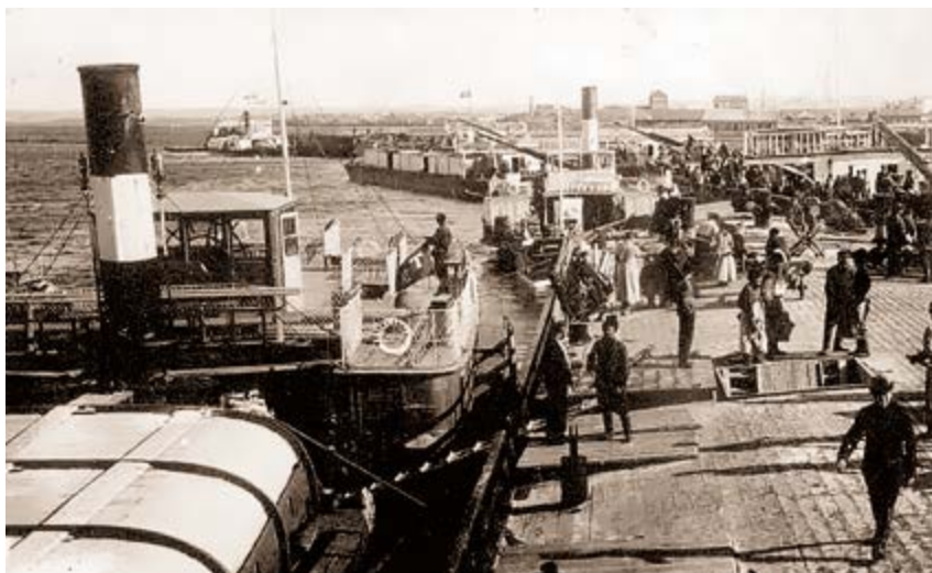
^ Рис. 9. Городская пристань Ирбита. Конец XIX в.

работает профессиональное образовательное учреждение – ГАПОУ «Ирбитский мотоциклетный техникум», отметивший 75-летний юбилей 6 апреля 2019 г. Ежегодно в Ирбите проходят этапы Всероссийских чемпионатов по мотокроссу. Так, 15–18 июня 2018 г. здесь состоялся Чемпионат России по мотокроссу на мотоциклах с колясками и Кубок МФР по мотокроссу на мотоциклах с колясками в классе «Национальный». Однако в соревнованиях ирбитские мотоциклы представлены скудно – всего по три машины; большинство мотогонщиков выступают на импортных моделях. В 2019 г. ОАО «Ураломото» (преемник Мотозавода) для сборки моделей мотоциклов привлекалось менее 150 специалистов, а 99% (1 тыс. ед.) продукции экспортировались в США, Канаду, Китай, Австралию. Мотозавод не формирует преемственность кадров, отсутствуют программы передачи высококвалифицированного опыта от бывших труженников завода молодым специалистам.