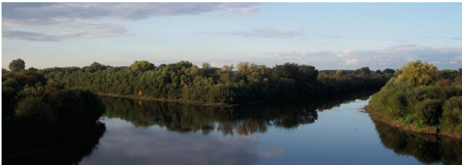
^ Рис. 7. Реки Ирбита – Ница и Ирбит. – URL: https://i.ytimg.com/vi/5LLxTc08Tik/maxresdefault.jpg