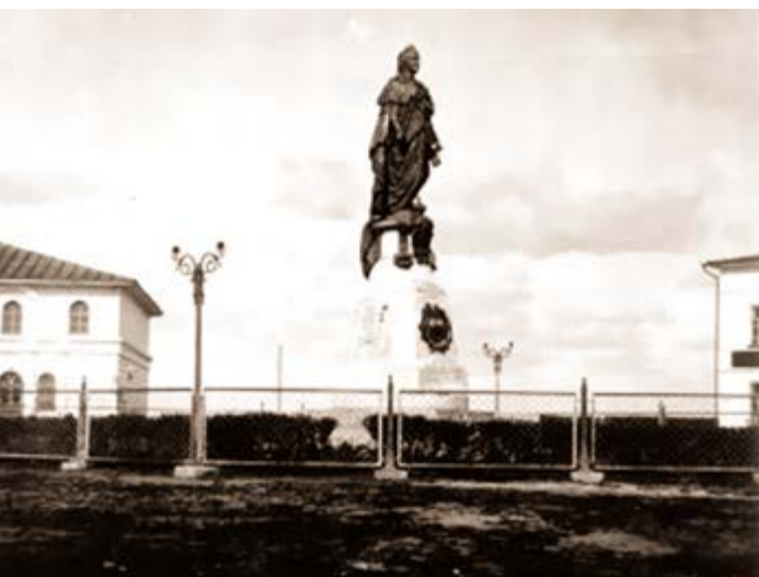
^ Рис. 2. Памятник Екатерине II. 1906.