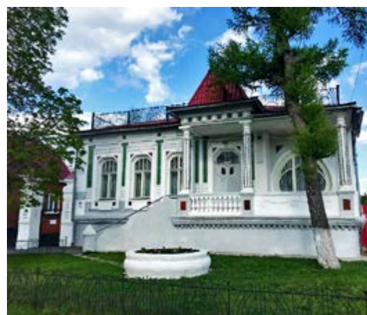
^ Рис. 9. Особняк Полякова, ныне картинная галерея им. П. И. Шолохова. Нач. XX века.