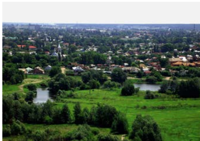
^ Рис. 1. Вид на город Борисоглебск.

Keywords: small town; historic town; Borisoglebsk; integrity of the environment; identity of the habitat; tools of urban development.