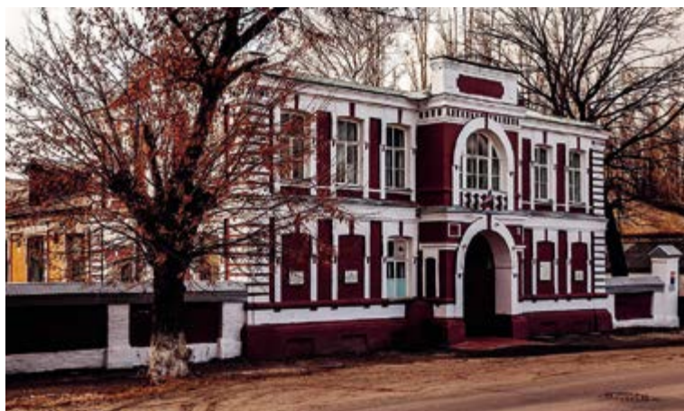
^ Рис. 7. Техническое железнодорожное училище, ныне СПТУ № 9. Открыто в 1878.