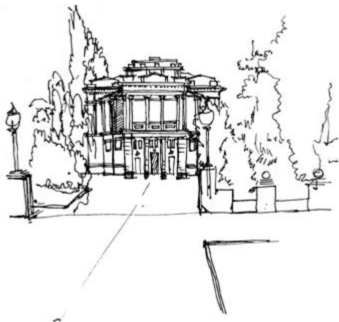
> Рис. 5. Драмтеатр им. Н. Г. Чернышевского, бывший Народный дом. Рис. Д. Астахова

туры и служит ориентиром, так как расположен на высокой части рельефа. В селе Малая Грибановка храм также является основной архитектурной доминантой, вокруг которой располагается рядовая застройка поселения.