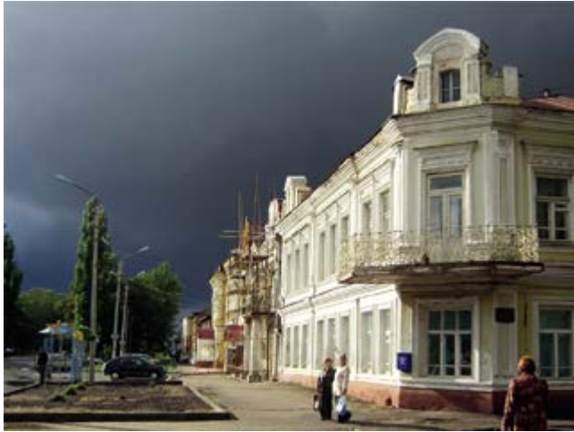
^ Рис. 2. В здании XIX в. сейчас разместился филиал Воронежского госуниверситета.