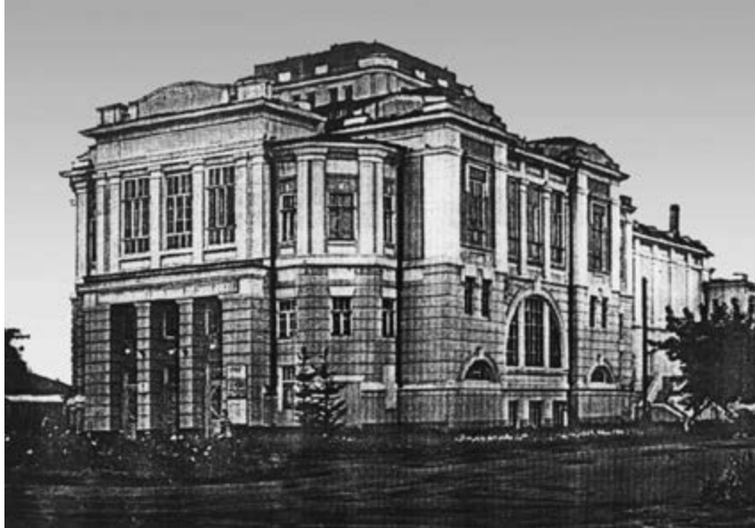
^ Рис. 4. Народный дом. Построен в 1915 на средства купца Ефима Дмитриевича Мягкова. Фото начала XX века