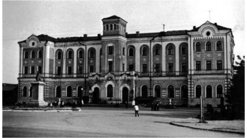
^ Рис. 3. Железнодорожный вокзал. Введен в эксплуатацию в 1871. Фото 1920-х

ни завершенностью. Тем более опасно отождествлять целостность со всеобщностью или тотальностью.