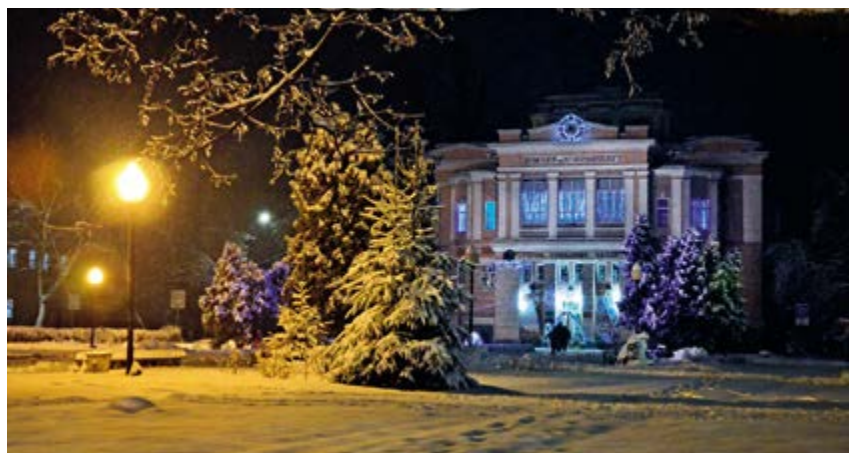
^ Рис. 11. Драматический театр им. Н. Г. Чернышевского.

на глазах постигает обычная уже судьба формализации и окостенения.