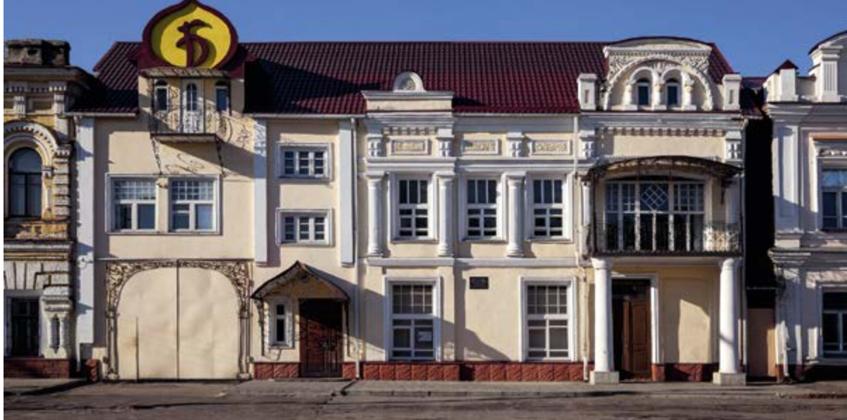
< Рис. 6. Здание бывшего электро-театра «Модерн», ныне филиал ВГТУ. 1915.

1. Воспетая в годы послевоенной реконструкции планировка (City Planning) успела показать свою мощь и пространственный размах; она вполне достигает тех целей, которые перед ней поставлены. Планировка создавалась как целевая и рационалистическая стратегия управления территориями, не доходящая до сентиментальностей среды и чьей-то там исторической памяти, местных традиций или «духа места». Планировка по определению – занятие плоское, а планирование – служебная и вторичная процедура в рамках уже принятых решений, уже сформированных где-то безотносительно к конкретному городу программ или проектов.