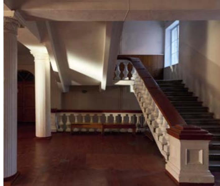
^ Санаторий имени XX съезда КПСС (в настоящее время «Таврида»). Архитекторы И. Жолтовский, Ю. Юдин. 1956.

видные архитекторы: В. Н. Семенов, А. О. Таманян (Таманов), А. П. Иванецкий, В. А. Веснин. Начали строить – но в 1917 г. помешали обстоятельства непреодолимой силы.