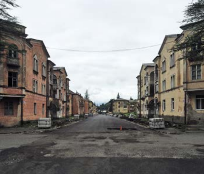
^ Абхазия. Ткуарча (Ткварчели). Проспект Владислава Ардзинба. Конец 1940-х.