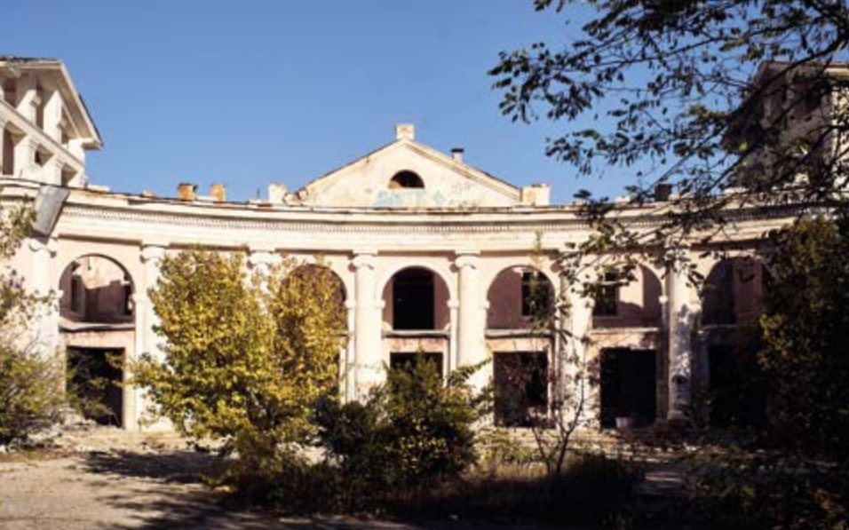
^ Евпатория. Санаторий «Октябрь». Архитектор В. Турчанинов. 1940, 1955