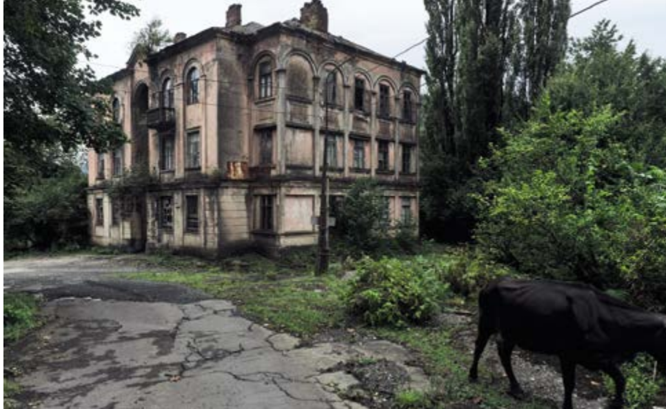
^ Абхазия. Ткуарча (Ткварчели). Проспект Владислава Ардзинба. Конец 1940-х.