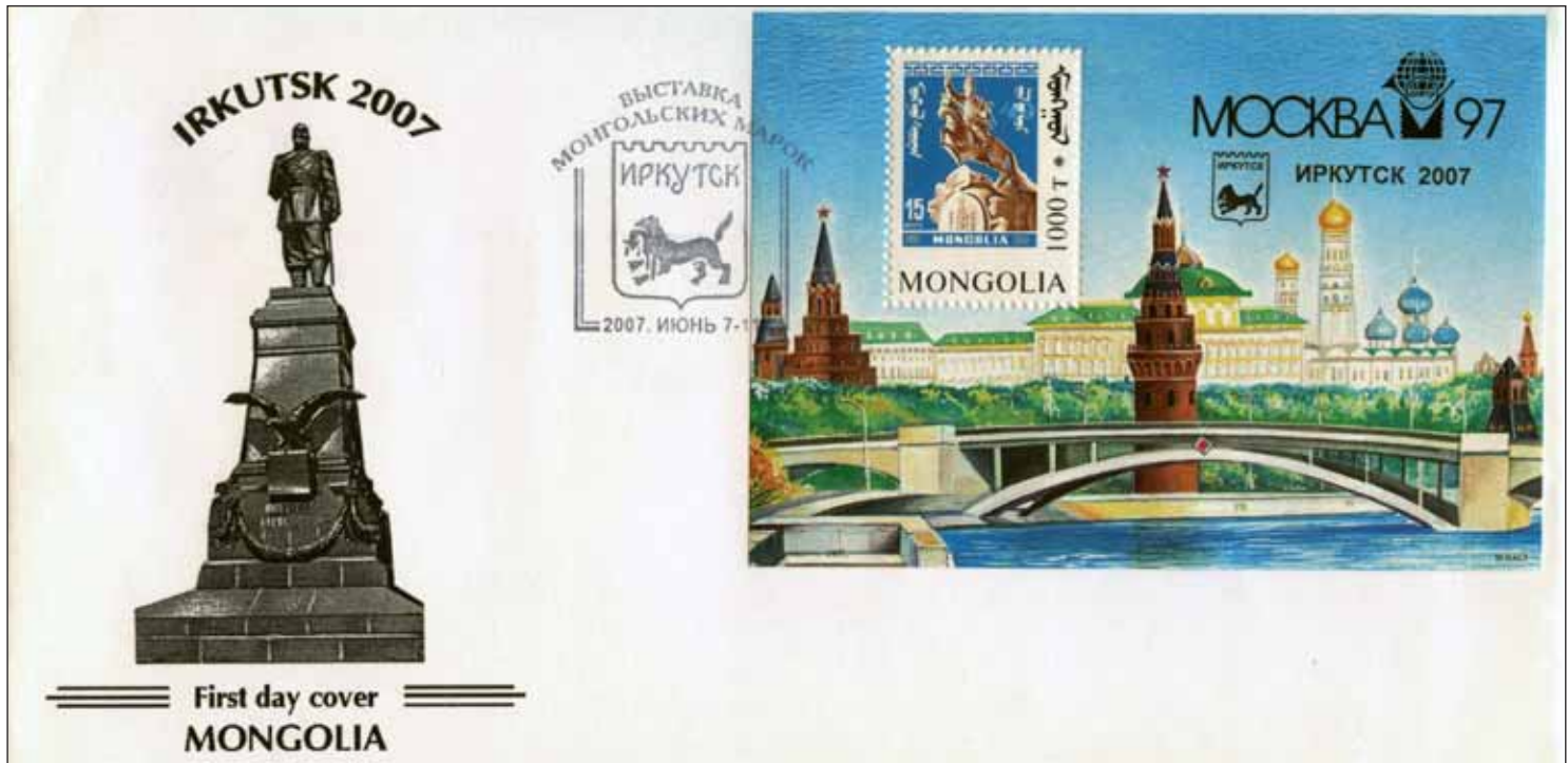
First day cover MONGOLIA

Монголии. В 1986 году у нас проходила международная филателистическая выставка «СССР – Монголия», в честь которой были выпущены немаркированный конверт и штемпель специального гашения. Спустя 20 лет монголы отметили выставку-продажу своих марок в Иркутске цельной вещью – надпечаткой на почтовом блоке, конвертом первого дня и специальным штемпелем гашения.