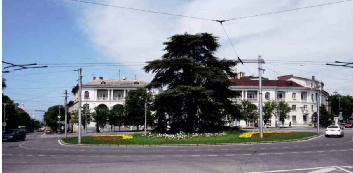
> Площадь Ушакова. 2018

вел к обеднению и размыванию творческих индивидуальностей, между тем «ортодоксальный» конструктивизм явно нес слишком радикальную унификацию, недаром крупные мастера выработали иные форматворческие концепции, сейчас записываемые в ар-деко 7 . Перелом конца 1950-х годов в сторону модернизма выглядит в первом приближении как повторение истории: политические установки заставили вчерашних классиков перестроиться, между тем не так много проектов и построек можно назвать «неумелыми» и «ученическими» в рамках интернационального модернизма. Их классическая выучка и практика, очевидно, были достаточным профессиональным багажом для создания и в упрощенных формах выдающихся архитектурных объектов. Расхожая же постановка вопроса требует уточнения (переосмысления наследия «темных веков», подобного переоткрытию историками школы «Анналов» европейского Средневековья, считавшегося благодаря позднеренессансным теоретикам лишь веками дикости и варварства).