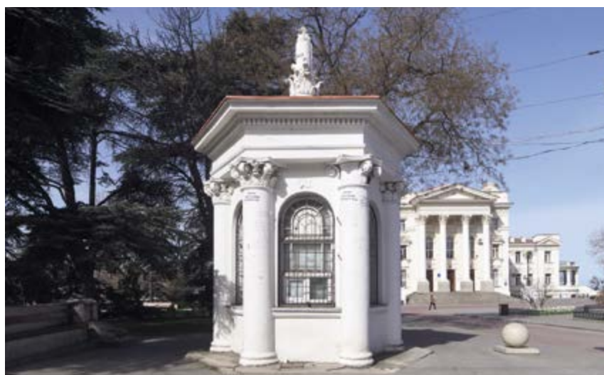
^ Малые архитектурные формы Приморского бульвара и восстановленное здание Дома пионеров. 2017

благоустройства на Большой Морской с наиболее ценной асамблевой застройкой. В ходе этих строительных работ были безжалостно сломаны подпорные стенки, балюстрады и пр. ради замены на гранитные элементы «московского» благоустройства, чуждые архитектуре этого белокаменного города 10 . Эти и многочисленные другие примеры показывают необходимость серьезной корректировки учетной документации и важность трактовки целых кварталов как архитектурных ансамблей с грамотной разработкой территорий памятников как комплексных, а не фрагментарных охранных зон. Именно это позволит повысить статус послевоенных архитектурных объектов до федерального и будет залогом более действенных мер охраны наследия.