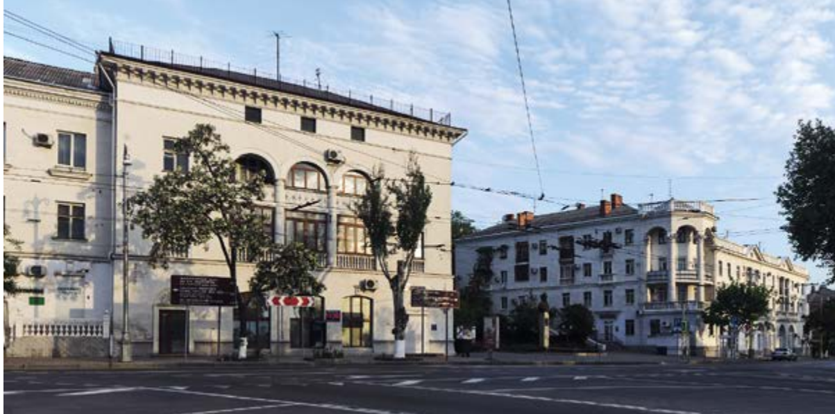
< Площадь Суворова. 2018

ных пешеходных связей, во всех случаях ориентируясь на ансамблевую застройку южного типа. Однако такая севастопольская традиция могла быть прервана. Первые эскизы серьезной перепланировки города были предложены за полгода до освобождения, осенью 1943-го. В новой застройке предполагались гигантские монументы, широкие эспланады, прямые перспективы и общий, почти столичный масштаб, чуждые реальной городской застройке и особенностям приморского ландшафта. Таким виделся Севастополь и М. Я. Гинзбургу и Г. Б. Бархину, участникам конкурса от Академии архитектуры и Наркомата обороны соответственно. Фактически город застраивался не столько на основании утвержденного в 1945 году генерального плана Г. Б. Бархина, сколько по его скорректированному и принятому в 1949 году варианту 4 . Реалистичность этого нового плана исключила гигантоманию [7], а высококачественная жилая застройка центрального городского кольца создала достойный фон для уникальных общественных зданий.