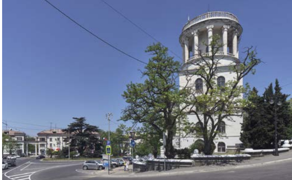
^ Площадь Лазарева и здание ЦКБ «Черноморец».