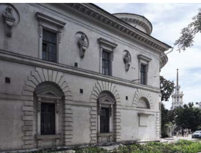
^ Библиотека имени Л. Н. Толстого и Матросский клуб. Фото Н. Ю. Васильева. 2019