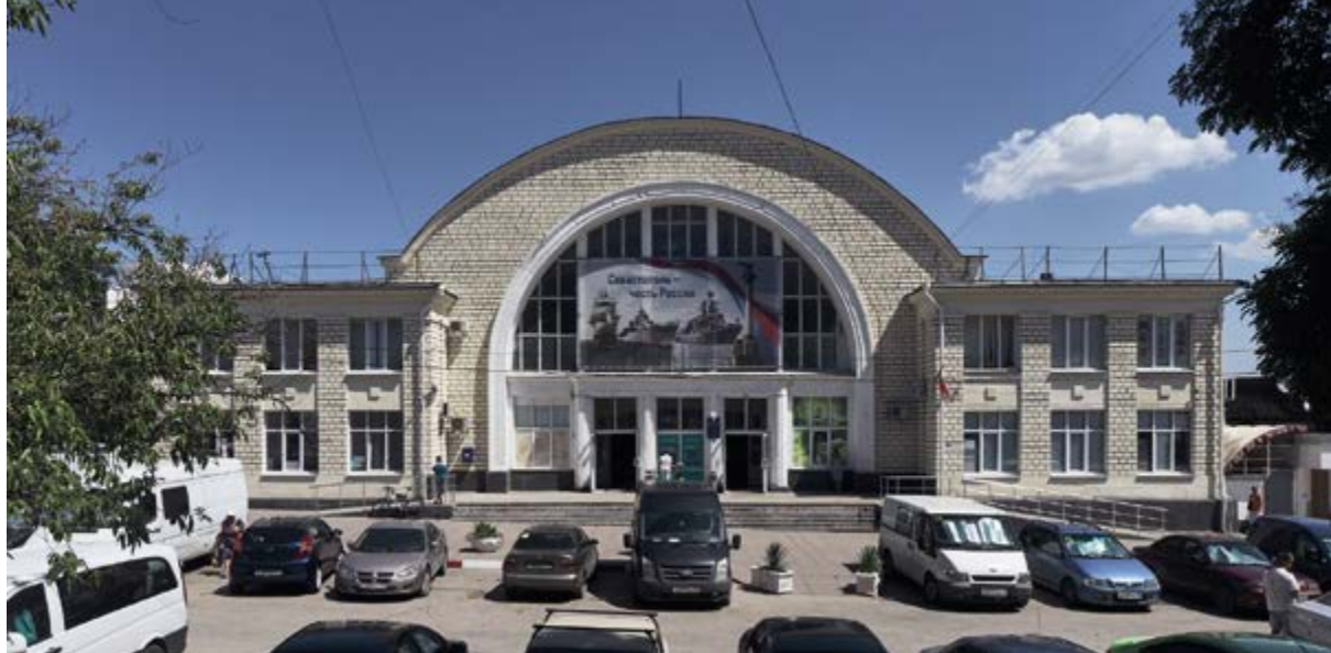
> Главный фасад крытой части Центрального рынка. 2019