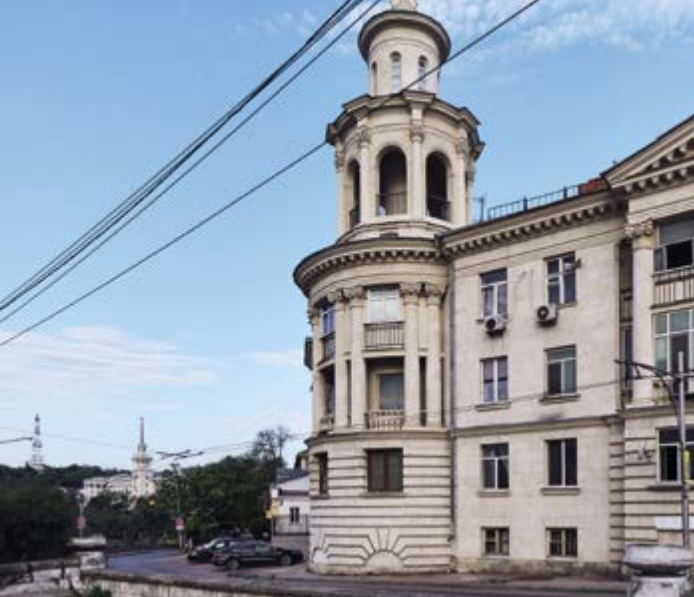
^ Жилой дом Хлебозавода и Матросский клуб. 2018