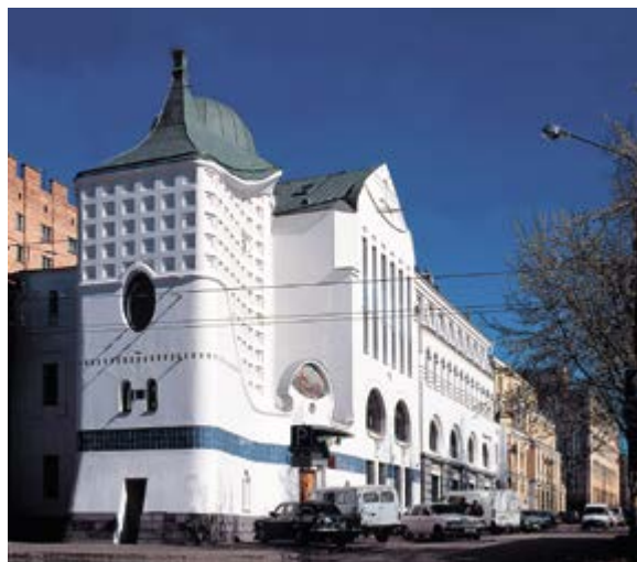
< Рис. 4. Коммерческий банк (ныне здание налоговой инспекции) на ул. Б. Печерской. Арх. Е. Н. Пестов, А. Е. Харитонов, И. Н. Гольцев, С. Г. Попов; худ. Г. И. Курицин. 1996

Хотя времени для осознания архитектуры постсоветского периода в общем процессе развития отечественной архитектуры еще недостаточно для взгляда «извне», новейшая архитектура российских регионов нуждается в осмыслении и научном анализе. Мнение современников не менее важно, чем оценка будущими поколениями. Анализ региональных архитектурных школ интересен именно в связи с возможностью рассмотреть процесс как бы «изнутри», его участниками.