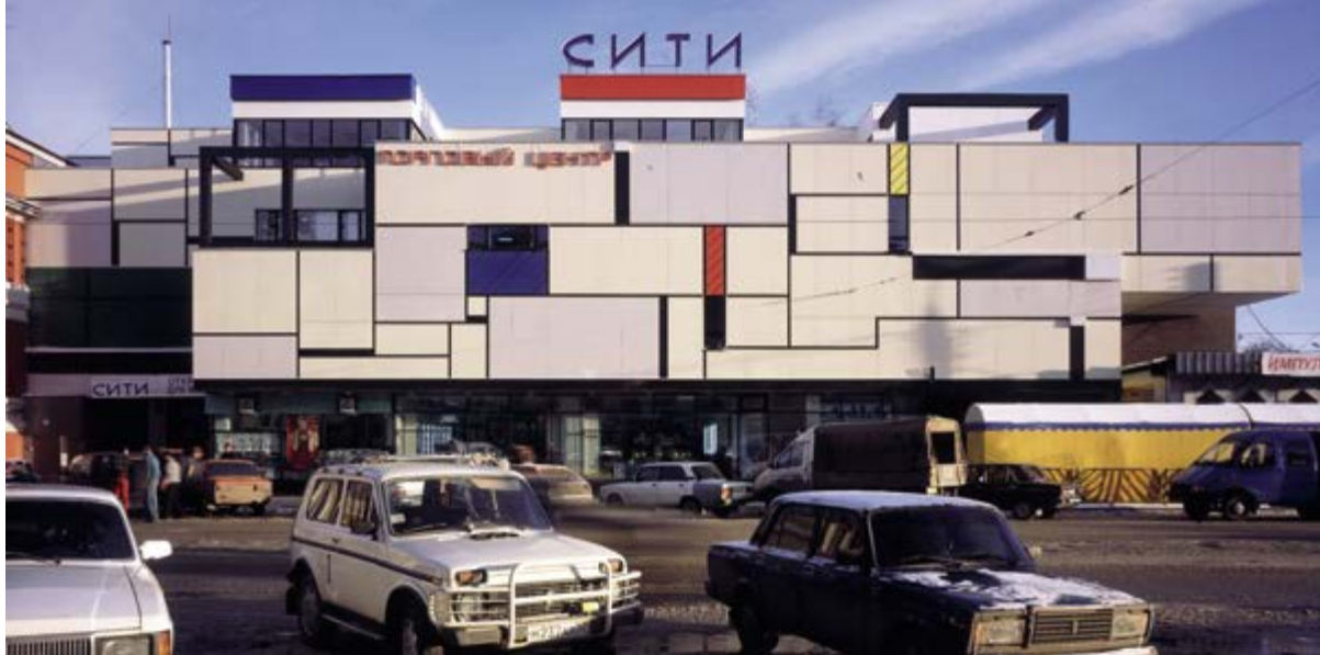
< Рис. 13. Торговый центр «Сити» на ул. Фильченкова. Арх. Е. Н. Пестов, А. И. Зеляев и др. 2003

шлым, с историей (т. е. методы нижегородского контекстуализма) не забыты. Примером служит офисное здание у сквера «Черный пруд» (арх. Б. Г. Тарасов, 2008) (рис. 10.) Новый конструктивизм в рамках неомодернизма получил больше степеней свободы в вопросах формообразования, в нем отсутствует прежний программный аскетизм и функционализм: больше внимания уделяется пластике фасадов за счет придания им слоистости, наложения структурных сеток с мелкой перфорацией оконными проемами. Таким образом архитектура современных зданий адаптируется к историческому контексту, например, офисное здание на ул. Варварской (арх. В. Ф. Быков; 2006) (рис. 11). Формообразование в нижегородской архитектуре вновь строится на комбинаторике простых геометрических фигур (офисное здание на ул. Белинского (арх. А. А. Худин, 2005) (рис. 12). В перечне средств художественной выразительности неоконструктивизма оказываются и цвет, и детали, то есть восполняется тот пробел, который существовал в начале XX века.