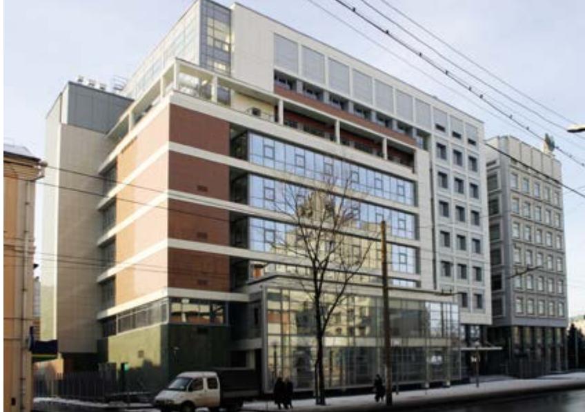
^ Рис. 11. Офисное здание на ул. Варварской. Арх. В. Ф. Быков. 2006