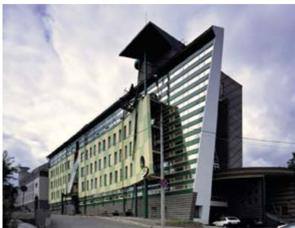
^ Рис. 9. Здание второй очереди банка «Гарантия» на Почаинском овраге. Арх. А. Е. Харитонов, Е. Н. Пестов, Н. Н. Пестова. 1999