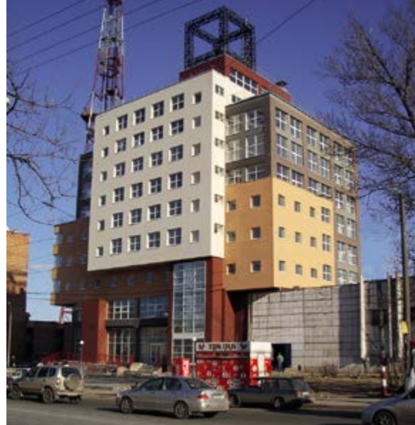
^ Рис. 12. Офисное здание на ул. Белинского. Арх. А. А. Худин. 2005