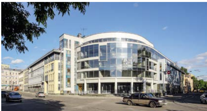
^ Рис. 10. Офисное здание у сквера «Черный пруд». Арх. Б. Г. Тарасов. 2008

Достижением и особенностью нижегородской архитектурной школы, безусловно, был и остается метод среднего подхода, который характерен для контекстуализма. Чтобы понять своеобразие нижегородской архитектуры, нельзя рассматривать отдельные новые здания в отрыве от их окружения, в отрыве от контекста, от его масштаба, от средовой преобладающей стилистики и колористики. Именно контекстуализм позволил на рубеже XX и XXI вв. сохранить масштаб исторического центра Нижнего Новгорода и во многом спасти его от диссонирующей застройки. Нижегородская школа сделала своим манифестом идею диалогического взаимодействия с историческим окружением, но это взаимодействие каждый раз происходило по-разному: от копирования и цитирования до свободной стилизации. Контекстуализм предусматривает в каждом конкретном случае разное взаимодействие здания и его окружения, и поэтому можно говорить, в зависимости от принципов и приемов адаптации к городской среде, о разновидностях стилистического, композиционного, ассоциативного, морфологического, декоративного, колористического контекстуализма [9, с. 46]. Архитекторы при проектировании применяют исторические морфотипы застройки, характерные для конкретного места, что позволяет новым объектам органично вписываться в городскую среду.