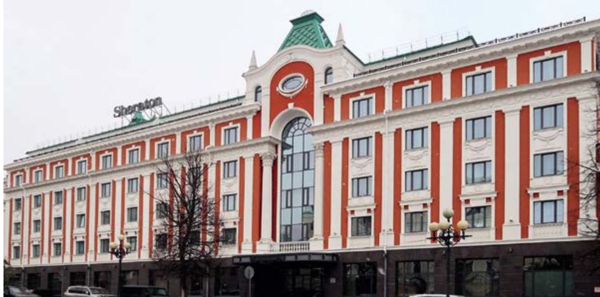
< Рис. 7. Гостиница «Шератон» на Театральной площади. Арх. Е. Н. Пестов, Е. О. Рыбин. 2017