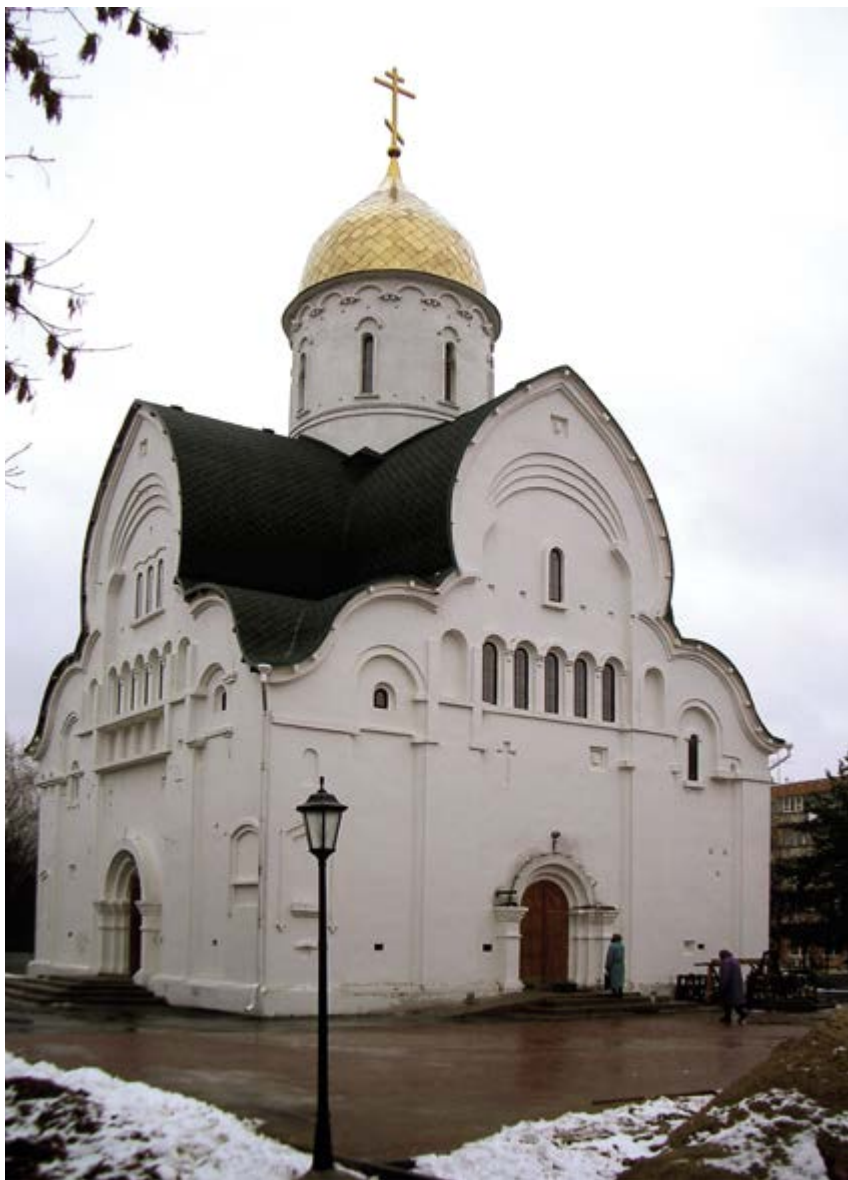
v Рис. 5. Церковь в честь Владимирской Оранской иконы Божией Матери. Арх. А. А. Худин. 2007

практическим опытом со студентами. «Реализм, профессионализм и прагматизм были теми началами, которые объединяли преподавателей, заложивших основы нижегородской архитектурной школы» [5, с. 113]. Таким образом, одной из особенностей архитектурного образования в вузе стала ориентация, прежде всего, на реальную практическую деятельность. Все предусмотренные в годы учебы виды практики студенты проходили и проходят в проектных институтах и на стройках города. Реалистическая направленность обучения осуществлялась, когда главный архитектор города выдавал список тем курсовых и дипломных проектов, актуальных для города, с возможностью их апробации на конкретных участках. Первый выпуск архитекторов состоялся в 1971 году. Лучшие дипломники пополняли ряды практикующих архитекторов в местных проектных институтах, продолжая обучаться профессии у мастеров архитектуры.