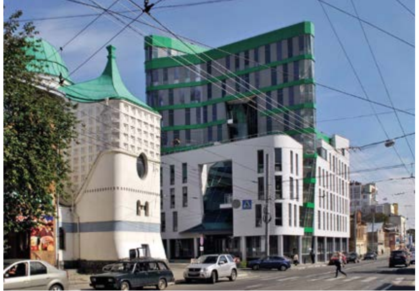
^ Рис. 15. Административное здание с подземной автостоянкой на ул. Б. Печерской. Арх. Е. Н. Пестов, А. Н. Каменюк. 2017

низма в Нижегородской архитектуре конца XX – начала XXI вв. // Архитектура и строительство России. – 2018. – № 1 (225). – С. 70–77 13. Хайт, В. Л. Генезис культурной самобытности в профессиональном зодчестве // История архитектуры. Объект, предмет и метод исследования : сборник науч. трудов ВНИИТАГ. – Москва : ЦНИИП градостроительства, 1988. – С.109–115