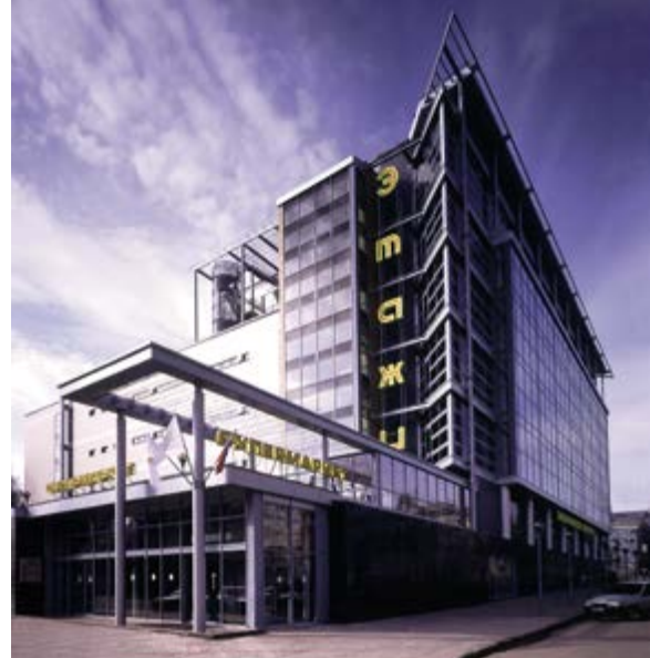
^ Рис. 14. Торговый центр «Этажи» на ул. Белинского. Арх. В. Ф. Быков, А. М. Сазонов, Д. М. Слепов, В. В. Никишин. 2002

его становления, практикующие архитекторы постоянно работают на кафедре архитектурного проектирования преподавателями и совместителями. Большинство из них, кроме того, обладают учеными степенями и званиями. Это также позволяет стабильно добиваться высоких результатов на ежегодных международных смотрах-конкурсах выпускных квалификационных работ по архитектуре и на международных фестивалях «Зодчество». В 1990 годы «<...> члены кафедры стали частью таких архитектурных и общественных структур, как областной и городской градостроительный совет, координационный совет при УАГ города, правление Союза архитекторов, экспертный Совет при Управлении по охране и использованию историко-культурного наследия областной администрации, они стали участвовать во всех важнейших архитектурных событиях города. В результате, сформировалось единое творческое профессиональное интеллектуальное поле – полноценная «<...> нижегородская архитектурная школа. Кафедра и университет приобрели славу одной из ведущих архитектурных школ России» [5, с. 113]. Сейчас ННГАСУ продолжает оставаться основой кадрового потенциала города, его взаимодействие с различными структурами постоянно расширяется (рис. 16).