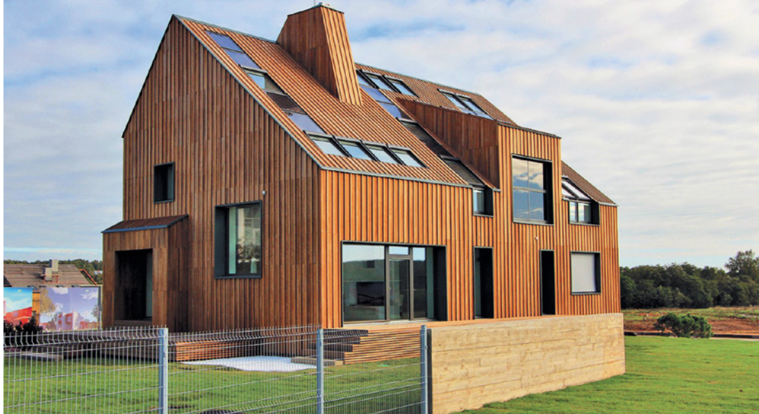
< Первый реализованный в России проект «активного дома». Экспериментальная лаборатория POLYGON, 2011

Структура ФЗ № 261 такова, что без большого количества сопроводительных уточнений и постановлений он эффективно действовать не может. Так, положениями закона предусмотрена разработка программ по энергосбережению и повышению энергоэффективности муниципальными и региональными властями. Но на практике для установки всех основных требований по данным программам существует еще и акт Правительства Российской Федерации, при этом к данному акту в Законе имеются еще и дополнительные требования, что является абсолютно нерациональным и значительно затрудняет применение ФЗ. В результате муниципальные программы, играющие чуть ли не основную роль в продвижении и популяризации идей энергоэффективности, разрабатываются с учетом трех нормативных актов: Приказа Минэкономразвития России от 17 февраля 2010 года №261 «Об утверждении примерного перечня мероприятий в области энергосбережения и повышения энергоэффективности» и Постановления Правительства Российской Федерации от 31 декабря 2009 года №1225 «О требованиях к региональным и муниципальным программам в области энергосбережения и повышения энергетической эффективности», который в свою очередь также имеет ряд ссылок и предписаний [9].