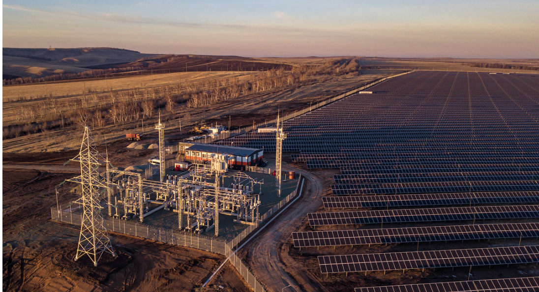
> Сорочинская солнечная электростанция «Уран» мощностью 60 МВт. Запущена в 2018

является и сохранение на постсоветском пространстве жесткой системы электроснабжения, которая не предусматривает реализацию излишков энергии, производимых автономными энергоэффективными домами у их владельцев. На общем рынке отсутствуют необходимые устройства – двунаправленные счетчики электроэнергии, а также необходимые документы, регулирующие процедуру реализации излишков и их учет.