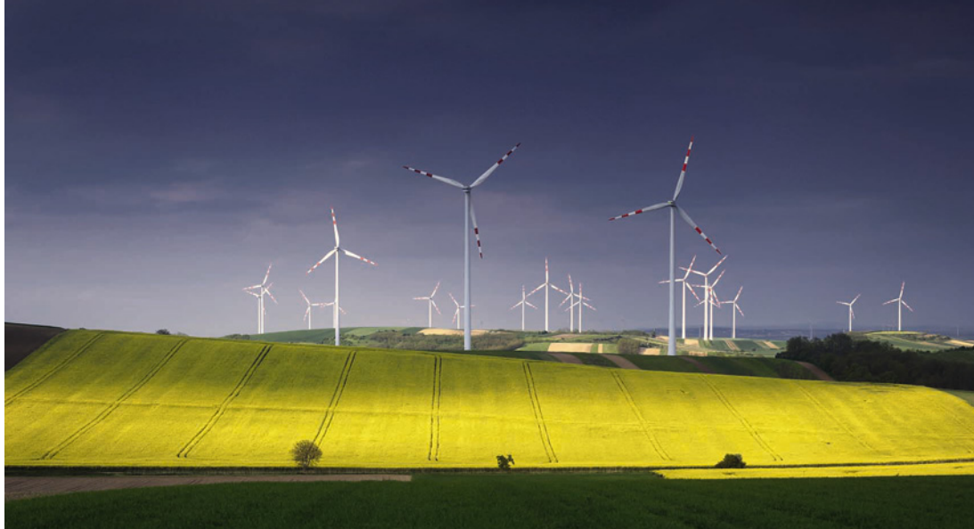
< Ветряные установки в Нижней Австрии. Фото Евгений Матюшенков, 2016