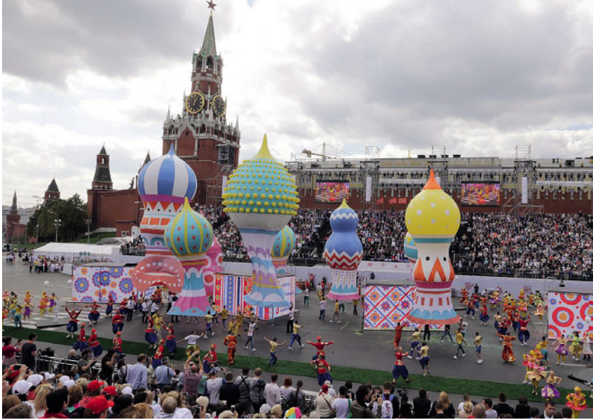
< Москве 869 лет. День города на Красной площади

или авторитету архитектуры при этом не стоит; сегодня освобождение от идолов профессионального самомнения выступает едва ли не единственным путем обретения новых, а также и восстановления забытых древних возможностей. И разве не этому учит традиция городского праздника, со смехом расстающегося со всякой предвзятостью и ограниченностью?