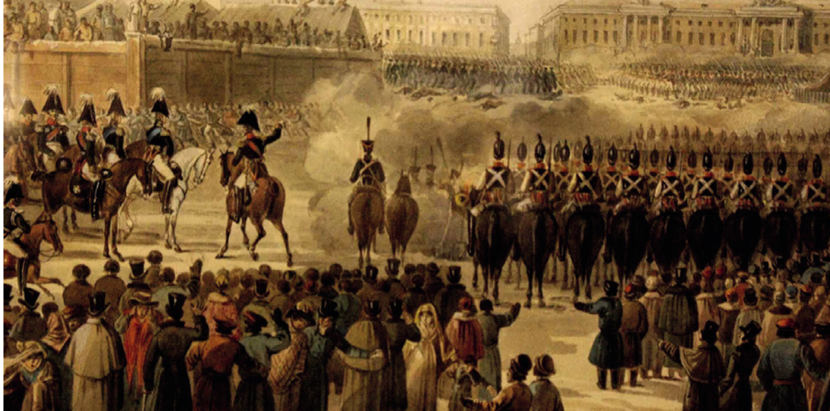
< Декабристы сумели объединить в одном перформансе плац-парад, майдан и зрелище для бедных. Санкт-Петербург, 14 (26) декабря 1825

не протрезвела, она готова увлечься всяким соблазном, сместиться в Иное, причем всем своим корпусом, без остатка, и перипетии XX века в полной мере о том свидетельствуют [14].