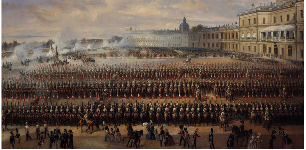
> Парад в Санкт-Петербурге во времена Павла I

усилий по ее объективации со стороны исследователя-проектировщика. Но с объективацией в истории архитектурного проектирования случился постыдный казус: она оказалась отождествлена с заранее готовыми типологиями зданий и сооружений: профессия тяготела к стабильности, ей были ни к чему открытые всем ветрам и потокам поиски процессов, событий или сущностей. Не до праздников: функционализм суть мир унылых будней.