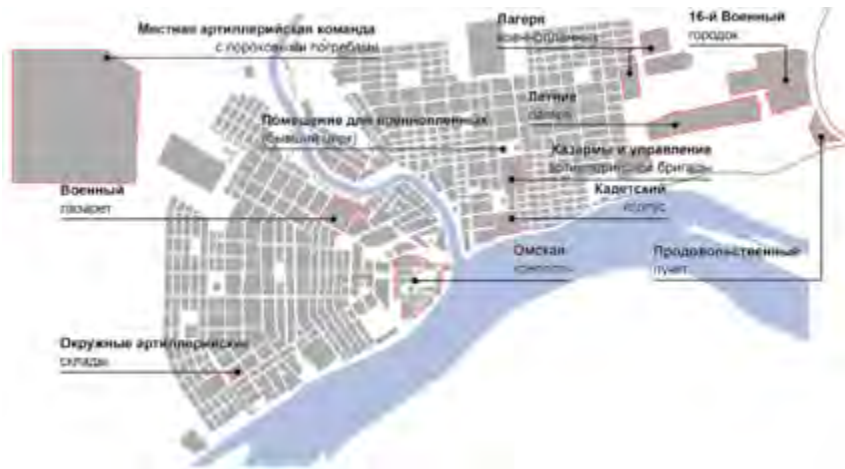
^ Рис. 4. Е. В. Чугунов. Схема расположения военных образований на территории города Омска на 1917 г.