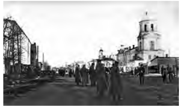
v Рис. 5. Новобранцы армии А. В. Колчака на фоне застройки второй половины XIX века в Омской крепости. Справа Военный Воскресенский собор, слева здание военно-топографического отдела.

В дальнейшем из-за постоянного роста количества воинских подразделений были возведены новые казармы и сооружения. На территории Омской крепости выделяются 5 типов сооружений, в которых реализуется военно-стратегическая функция города: жилые, складские, религиозные, хозяйственные (вспомогательные), общественно-административные; специализированных сооружений для питания воинского контингента в ходе анализа выявлено не было (рис. 6).