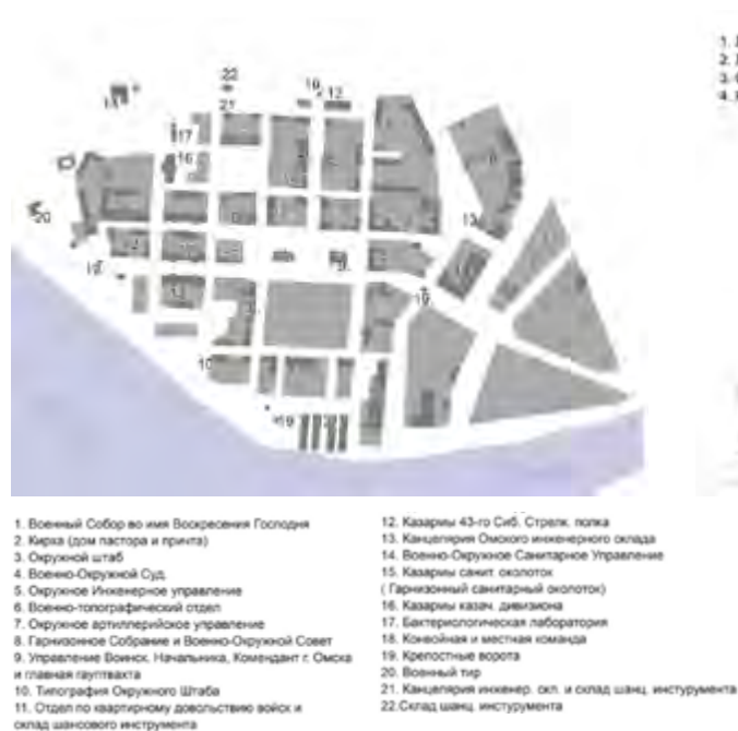
в Рис. 6. Е. В. Чугунов. Схема расположения сооружений на территории крепости города Омска на 1917 г.