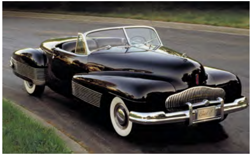
^ Харли Эрл. Автомобиль «Buick Y-Job», США. 1938

есть ритмо-пространственная метафора ар-деко, идеальная модель его территориальной экспансии.