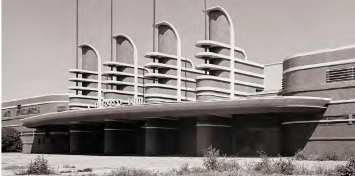
< Зал «Pan Pacific» в Лос-Анджелесе, США. 1935