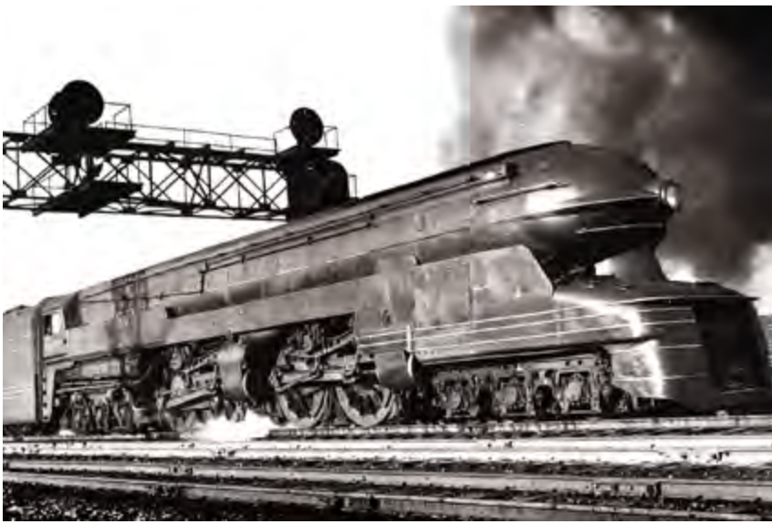
^ Раймонд Лоуи. Локомотив PRR S1, США. 1939