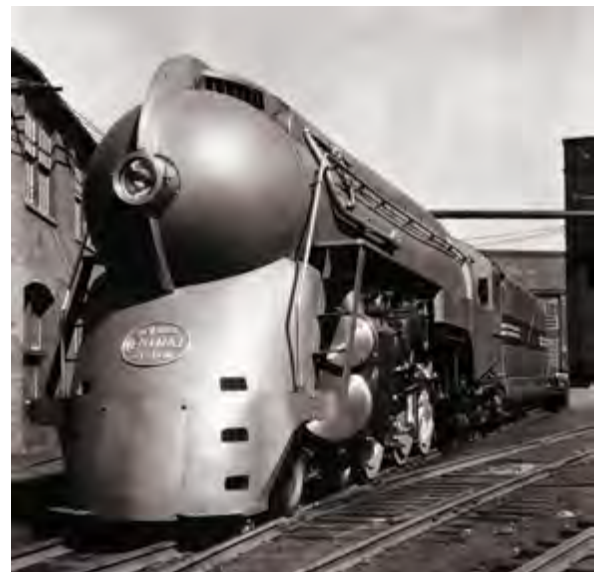
^ Генри Дрейфус. Локомотив Hudson Mercury, США. 1938

модных духов. Великие женщины кино эпохи ар-деко – Грета Гарбо, Марлен Дитрих или Любовь Орлова – совершили, безусловно, подвиг эмансипации. Но и он так и остался в зоне грез, будучи своевременно распознан как опасность, купирован и обставлен фаллическими стражами: блестящими мужчинами и автомобилями, позолоченными атлантами перед входами в многочисленные «Одеоны» и, разумеется, их вотивными модельками – «Оскарами».