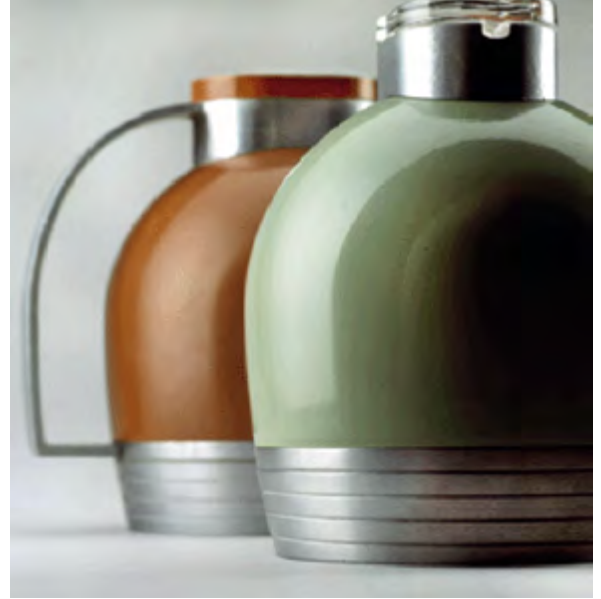
^ Генри Дрейфус. Бытовой термос, США. 1930-е гг.

«запускают» форму, а подсечки ее ловят, принимают и маркируют по месту назначения. Весь пластический язык ар-деко мог бы быть воспроизведен одной лишь игрой вставок и подсечек при условии, что вертикальные структуры уже имеются в наличии.