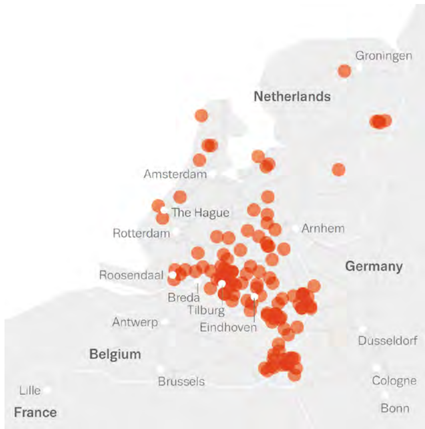
^ Илл. 6. Карта мест сброса отходов производства синтетических наркотиков в Нидерландах и Бельгии, 2013–2014 гг. (European Monitoring Centre for Drugs and Drug Addiction, 2016) / Fig. 6: Map of Dump sites of waste from synthetic drugs production in the Netherlands and Belgium, 2013–14 (European Monitoring Centre for Drugs and Drug Addiction, 2016)

The city of Amsterdam is a huge magnet for tourism. On a population of 860.000 inhabitants, it receives over 17 million tourists and visitors a year. The situation evolved to a saturation point where an increasing number of inhabitants in the capital got enough of tourists and where tourists no longer find a historic Dutch city but an overcrowded theme park instead, known for its monuments, canal district, the availability of soft drugs and its open prostitution. In 2010 Amsterdam managed to get its city centre listed as a UNESCO World Heritage. A shift in the type of tourism may occur, coinciding with more stringent policies for its red-light district that the current mayor Femke Halsema is proposing. Looking at cities like Venice or Dubrovnik, a UNESCO World Heritage site designation will most likely further fuel the influx of tourists. The Dutch tourism industry actively searches for ways to divert these flows of tourists away from the capital to other areas in the Netherlands (see Figure 8).