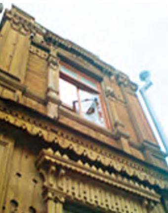
в Рис. 10. Снос дома по ул. Свободы, 71. Фото 2009 г.

Памятники архитектуры деревянного зодчества с их характерными особенностями и яркой индивидуальностью некогда создали неповторимый образ города – атмосферу красоты, самобытности и незыблемых традиций родного края, сбереечь и сохранить которые в условиях сегодняшней урбанизации очень важно. Это необходимо для воспитания культурно-эстетического восприятия у молодежи, формирования патриотических чувств и любви к Родине. Поэтому очень важно сохранять все то, что пришло из прошлого, что имеет историю, особую неповторимую эстетику и уникальность. Для всех нас, для преемственности поколений, для сохранения красоты прошлого!