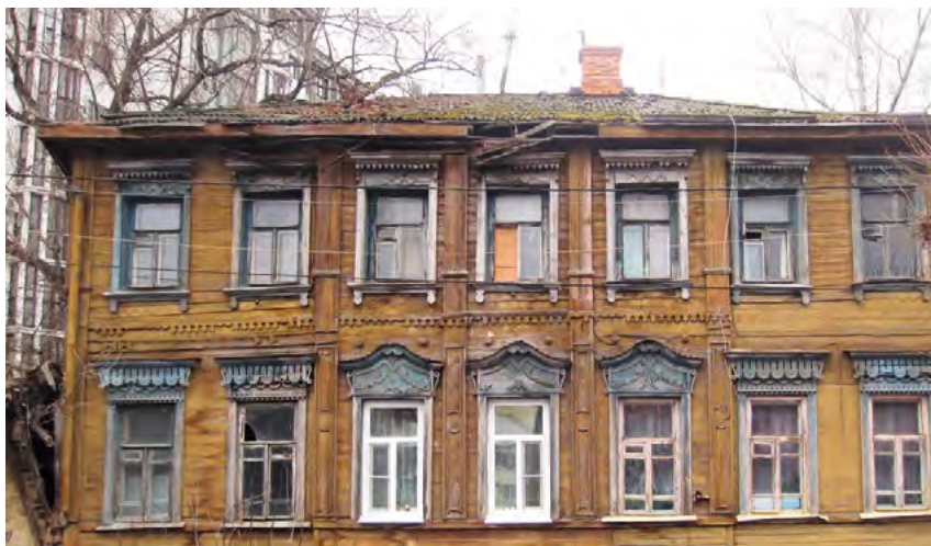
^ в Рис. 11. Дом по ул. Право-Лыбедской, 46. Фото 2019 г.