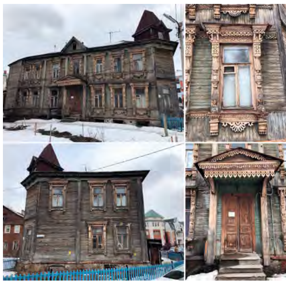
> Рис. 7. Жилой дом по ул. Семинарской, 14. Фото 2019 г.