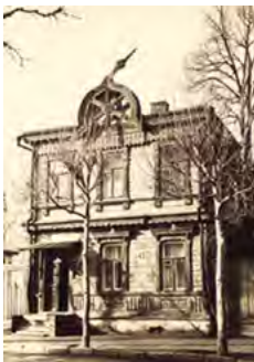
^ Рис. 4. Ул. Радищева. Исторические фото. Здания до утраты балконов

ханской). В советские годы улицы Введенская и Вознесенская были объединены и переименованы в честь революционера Карла Либкнехта.