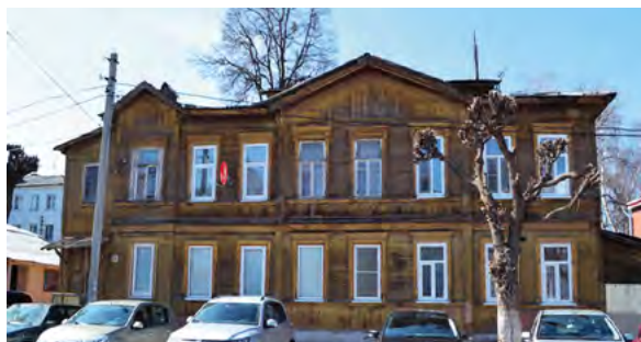
> Рис. 6. Ул. Павлова, 13, 15

Павлова, 13. Усадьба Юкиных представляет собой один из типичных примеров эпохи доходных усадеб со строениями, выполненными в формах эклектики с элементами русского стиля. Двухэтажный прямоугольный объем покрыт вальмовой кровлей. Средняя часть крыши увенчана невысокой надстройкой, имеющей в плане квадратную форму. Предположительно изначально она служила основанием для шатра. Уличный фасад асимметричен, но имеет уравновешенную композицию. Доминирующим элементом на фасаде выступает расположенный в середине фасада трехосевый ризалит, завершенный щипцом.