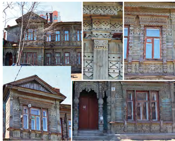
> Рис. 8. Ул. Пожалостина, 5. Фото 2019 г.

В эпоху эклектизма детали имели большое значение. Они были направлены на исторический декоративизм, т. е. на воспроизведение архитектурных особенностей, присущих той или иной эпохе. Именно детали дают возможность ощутить «дыхание» ушедших эпох, увидеть историческую среду и своеобразие именно того времени.