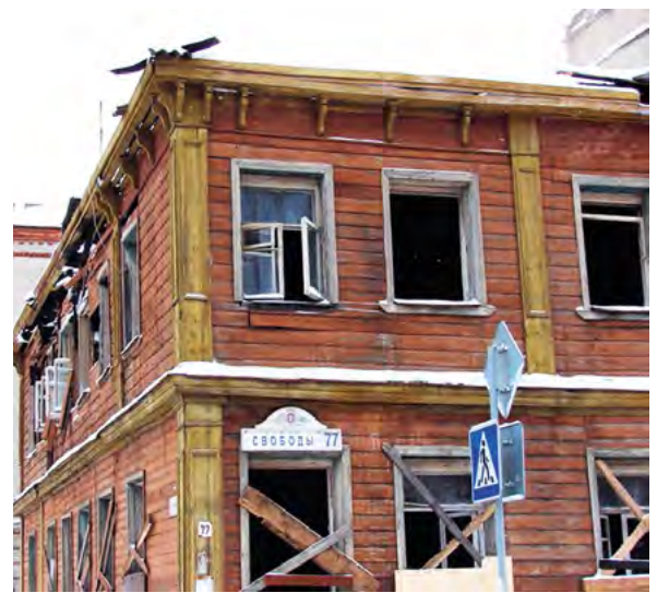
^ Рис. 2. Ул. Свободы, 77 (Слева – фото в апреле 2019, справа – фото до реставрации)