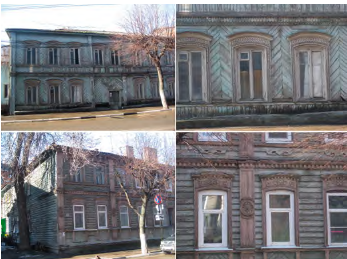
^ Рис. 3. Здания по ул. Полонского, 15 (вверху), 19 (внизу)