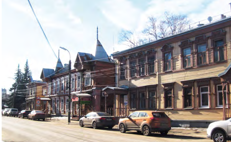
^ v Рис. 5. Улица Радищева, дома № 45, 47, 49 (слева направо)