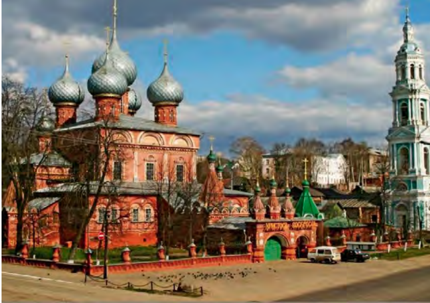
^ Церковь Воскресения на Девре