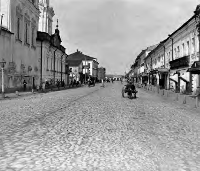
^ Улица Русина в сторону Воскресенской площади