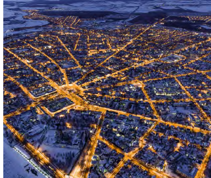
^ Кострома, веер

– все самое лучшее и значимое»; «только в центре нужно строить офисные здания и элитное жилье»; «центр – хорошо, окраина – плохо», и никакие доводы разума не действуют. Помочь может только жесткое государственное регулирование строительства в центрах исторических городов и понимание, что не отдельный памятник с охранными зонами, а целые исторические районы и традиционные улицы должны сохранять структурную целостность. Это не означает, что новое строительство в пределах исторических центров городов невозможно. Важно понимать, что ограничения неизбежны.