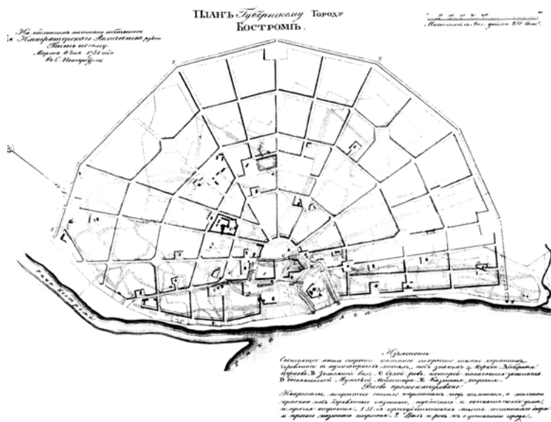
^ План Костромы