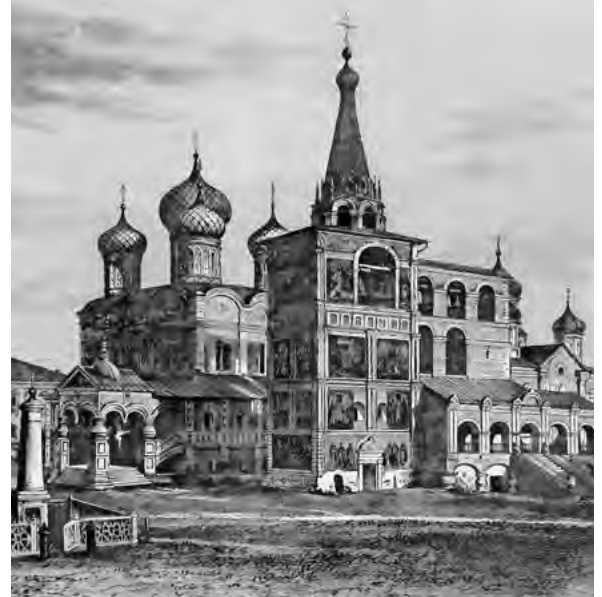
^ Ипатьевский монастырь. Гравюра