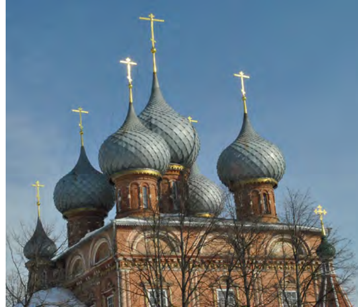
^ Кострома. Церковь Воскресения на Девре. Фрагмент

и в отдаленные районы пешком уже не доберешься. Впрочем, если жить в этих районах, то той Костромы, ради которой люди едут за тысячи километров, там не чувствуется. Обычные многоэтажные «человейники». Хотя, надо отдать должное, сегодня центр стараются не застраивать высотными домами. Сталинские трех-пятиэтажные дома уже давно стали частью городского пейзажа. Построенные на месте уютных деревянных и кирпичных особнячков, они не портят город. И по масштабу, и по фактуре эти дома не выбиваются из общего строя. Неоклассические сталинские здания – пожалуй, лучшее, что было построено в XX веке. Хотя, если бы сохранились особнячки, которые были на их месте, возможно, центр был бы гармоничнее. Но город не может оставаться неизменным. Что-то утрачивается, что-то приобретается.