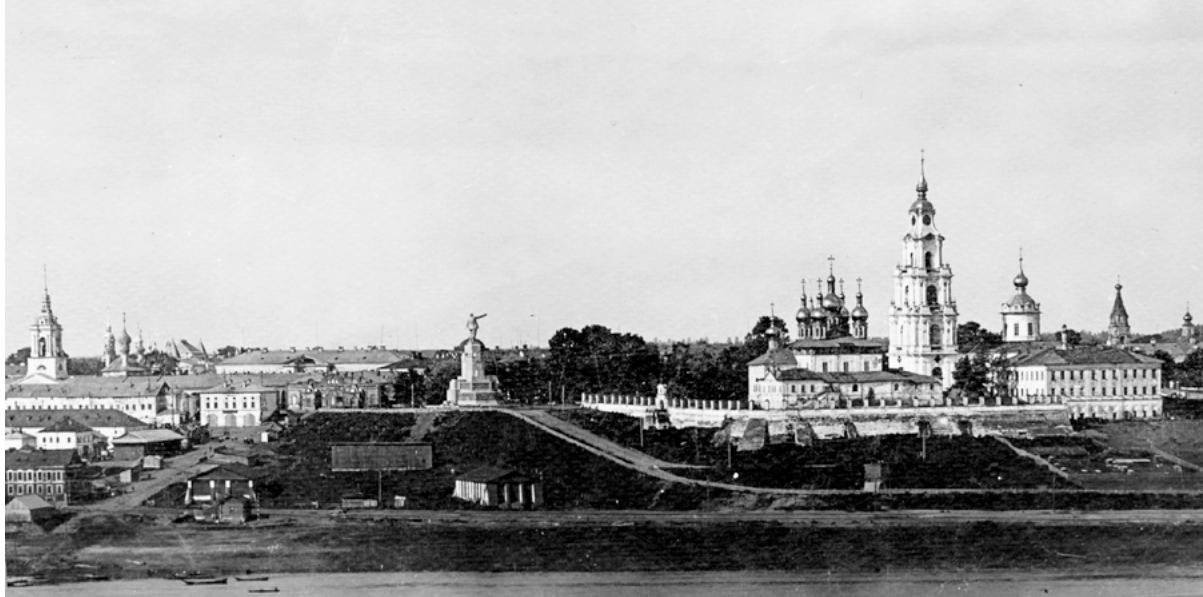
< Вид на город с Волги. 1932 г.