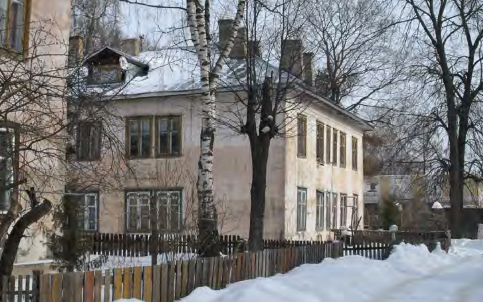
^ Кострома. Деревянные двухэтажные дома. Войкова, 20