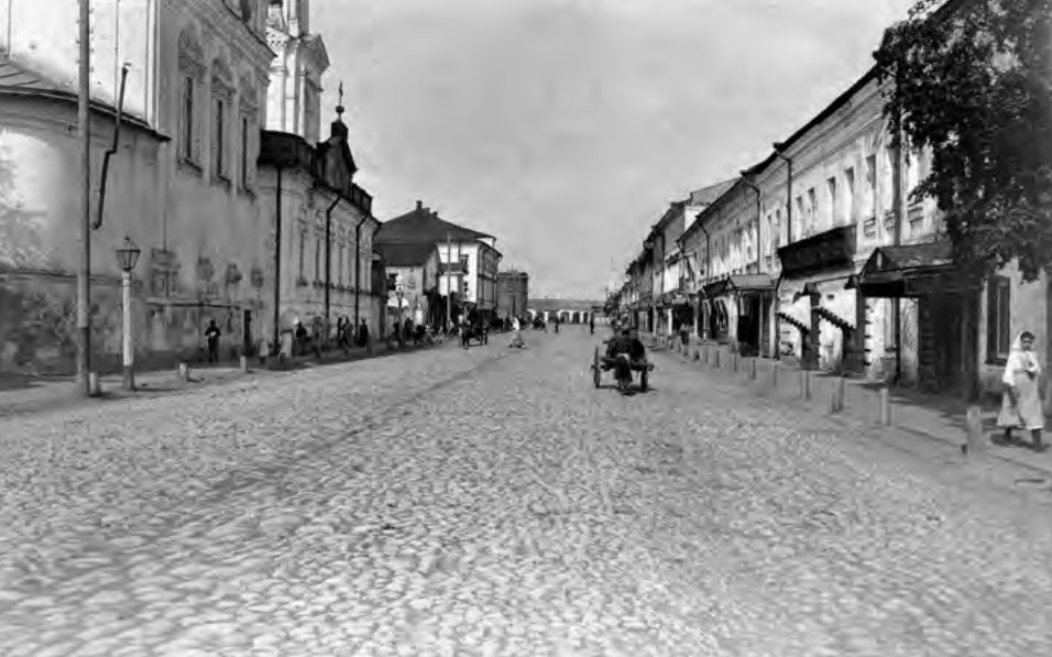
^ Улица Русина в сторону Воскресенской площади