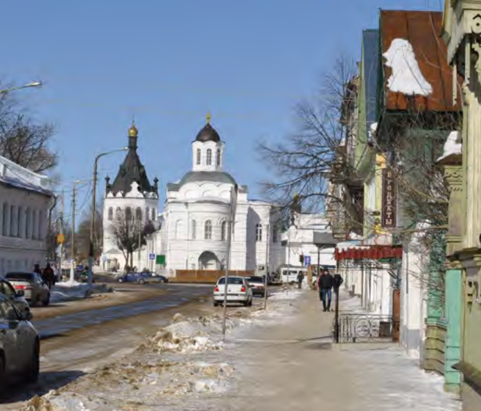
^ Богоявленско-Анастасиин женский монастырь в Костроме