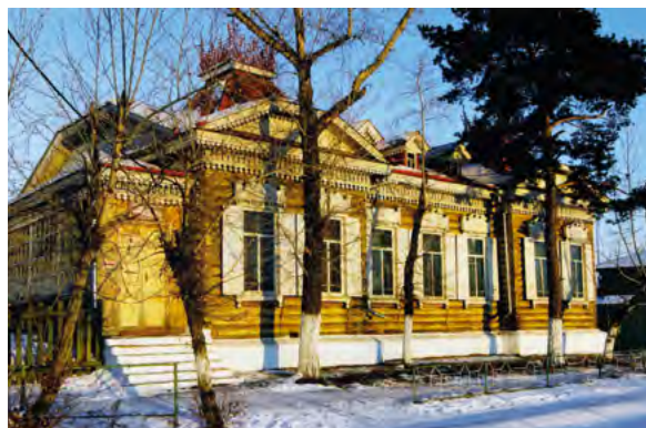
< Рис.33. Дом жилой