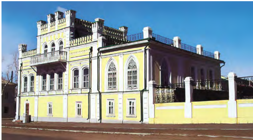
^ Рис.15. Угловая часть дворца