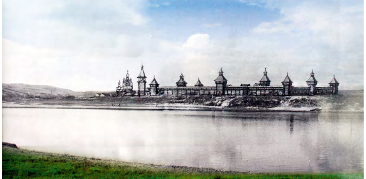
> Рис.5. Деревянная крепость Нерчинска. Реконструкция Н. П. Крадина