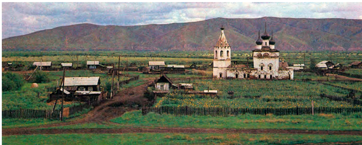
< Рис.7. Село Калинино с церковью Успения Пресвятой Богородицы. 1980 г.