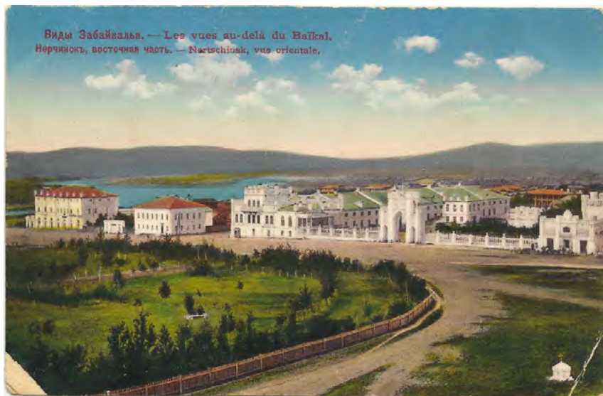
^ Рис.10. Панорама дворцового комплекса Бутиных