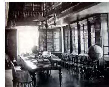
v Рис.20. Интерьер библиотеки

увеличили его стоимость в три или четыре раза и т. д. Прогуливаясь по громадным залам, спрашиваешь себя, для кого же они были выстроены. Нашлось ли в городе Нерчинске, даже во время его наибольшего расцвета, достаточное количество людей, которых можно было бы пригласить во дворец, чтобы он не казался пустым?» [9, с. 81].