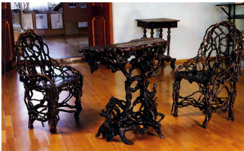
^ Рис.24. Столик и кресла из корней боярышника и березы