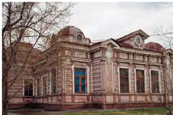
^ Рис.27. Дом М. Д. Бутина в Иркутске