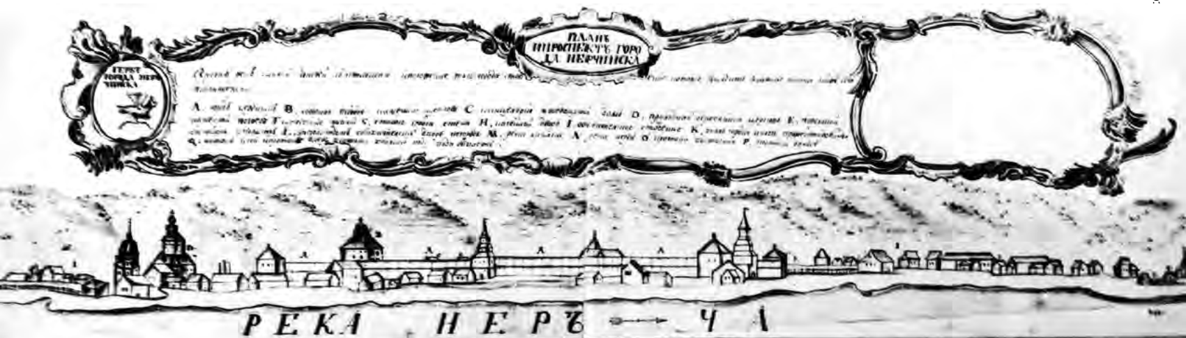
^ Рис.3. «План и проспект города Нерчинска», 1730-е гг. ААН