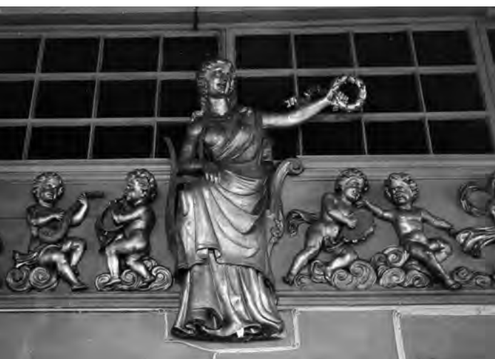
^ Рис.21. Скульптурное изображение «Муза»