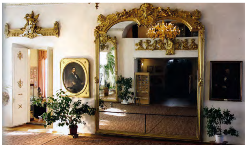
^ Рис.22. Зеркало в гостиной комнате дворца