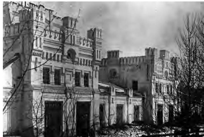
^ Рис.16. Декор фасада каретных рядов