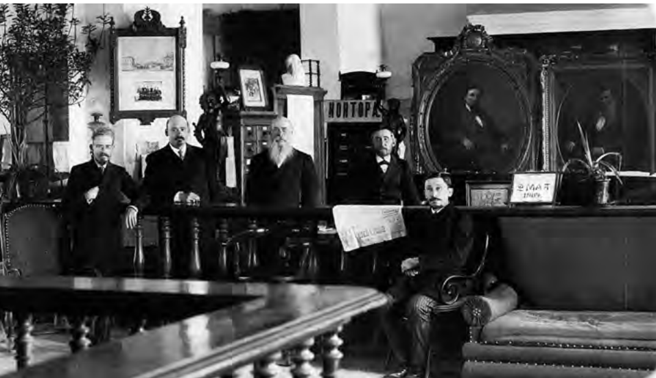
v Рис.18. Служащие ТД братьев Бутиных

в ней нашли модные в усадебной архитектуре рубежа XVIII–XIX вв. классицистические и мавритано-готические стилевые направления. Именно в мавритано-готическом духе решены уличные (торцовые) фасады усадебного дворца (Рис. 13, 15), каретных рядов (Рис. 16), монументальных парадных ворот и оранжерейного корпуса. Обращенные в сторону общественного сада, фасады этих трех зданий вместе с чугунной решеткой ограды и монументальными воротами создавали парадный фасад усадьбы, формировавшей своими размерами, архитектурой и благоустройством центральное ядро Нерчинска.