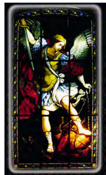
v Рис.23. Витраж «Архангел Михаил поражает дьявола»