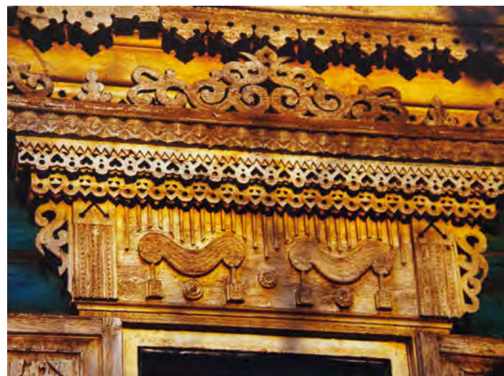
^ Рис.25. Пропильная резьба оконного наличника