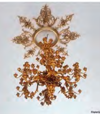
^ Рис.26. Люстра