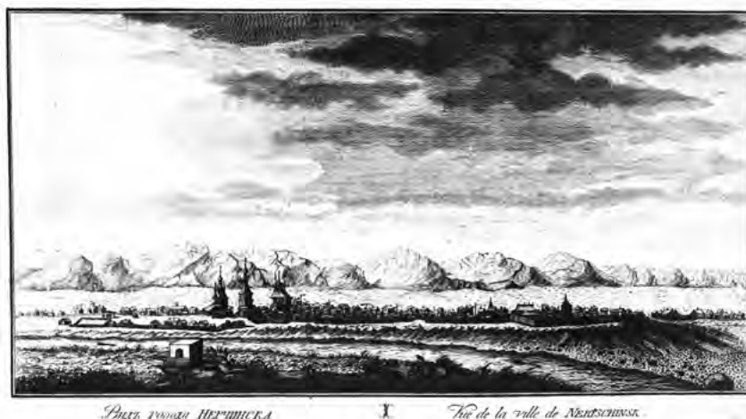
в Рис.4. Вид Нерчинска. Гравюра Н. Челнокова по рисунку И. Люрсениуса, 1770 г.

Следует отметить, что деревянный город-крепость Нерчинск, как и другие подобные сибирские города-крепости, неоднократно изображался на различных рисунках и гравюрах, в частности, на гравюре Н. Челнокова, выполненной по рисунку Люрсениуса в 1770 г. (Рис. 4), а также в реконструкциях исследователей, в том числе и автора этой статьи (Рис. 5). Поставленный на низком и неудобном месте, где река часто разливалась, Нерчинск многократно менял свое местоположение, и лишь в 1812 году, спустя полтора столетия после основания, город был окончательно перенесен на более высокое, не затопляемое место, в урочище под названием Сажиков Яр; там вскоре стали появляться и каменные строения. Вместе с тем следует отметить, что еще на старом месте, где Максим Уразов ставил первое зимовье, по указу Петра I в 1706 году был основан Нерчинский Успенский