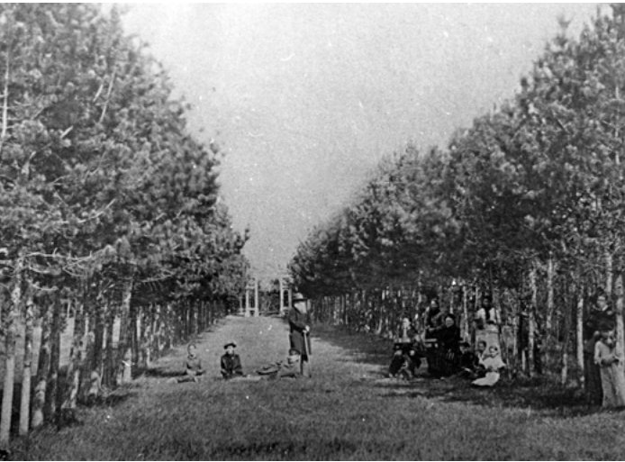
^ Рис.29. Аллея в дворцовом саду