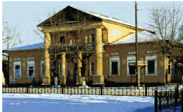
< Рис.31. Гостиный двор в Нерчинске