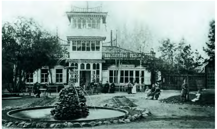
^ Рис.30. Дом Т. Д. Мауриц в комплексе дворца