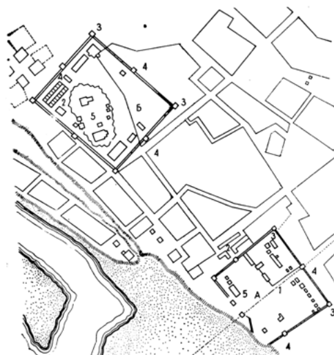
^ v Рис.1, 2. Планы Нерчинского острога, конец XVII – нач. XVIII вв.

Keywords: Ostrog; wooden fortress; Uspenskaya Church; Butin's Palace Ensemble; Archangel Michael; shopping arcade; carving; T. D. Maurits' House; stained-glass window; greenhouse; carriage rows.