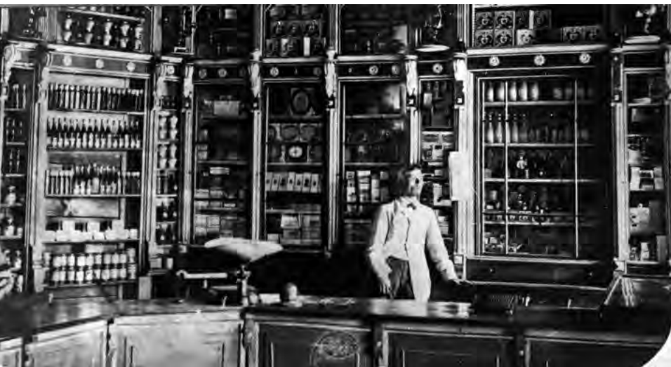
^ Рис.17. Торговая лавка дворца