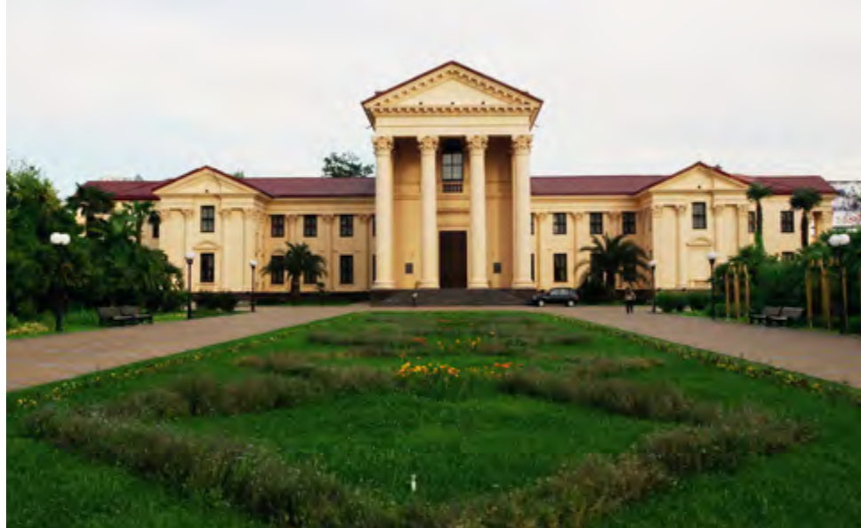
^ Художественный музей. Арх. Жолтовский И.В. 1936 г.