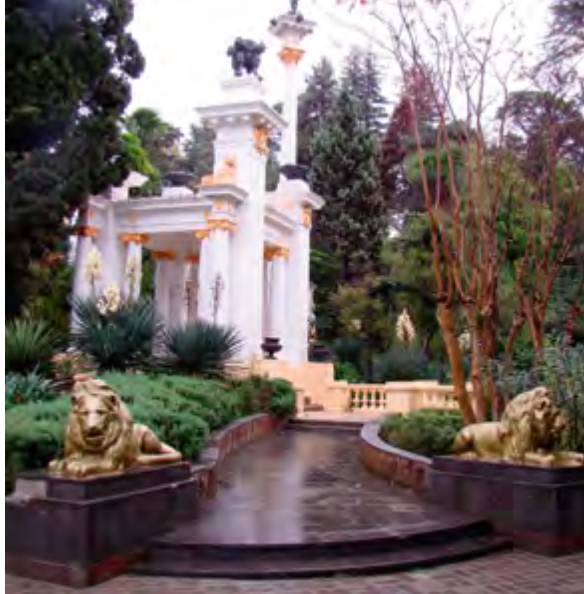
> Парк Дендрарий. Ротонда