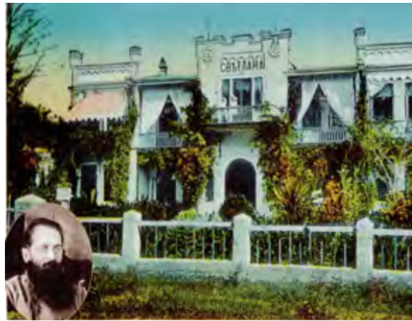
v Дача Ф. К. Трапезникова; до 1917 v Дача Якобсона. Арх. Р. И. Будник, 1902 v Дача Павлова, нач. XX в.