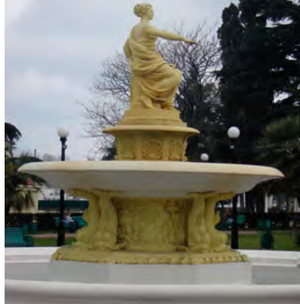
^ Фонтан у Морского порта