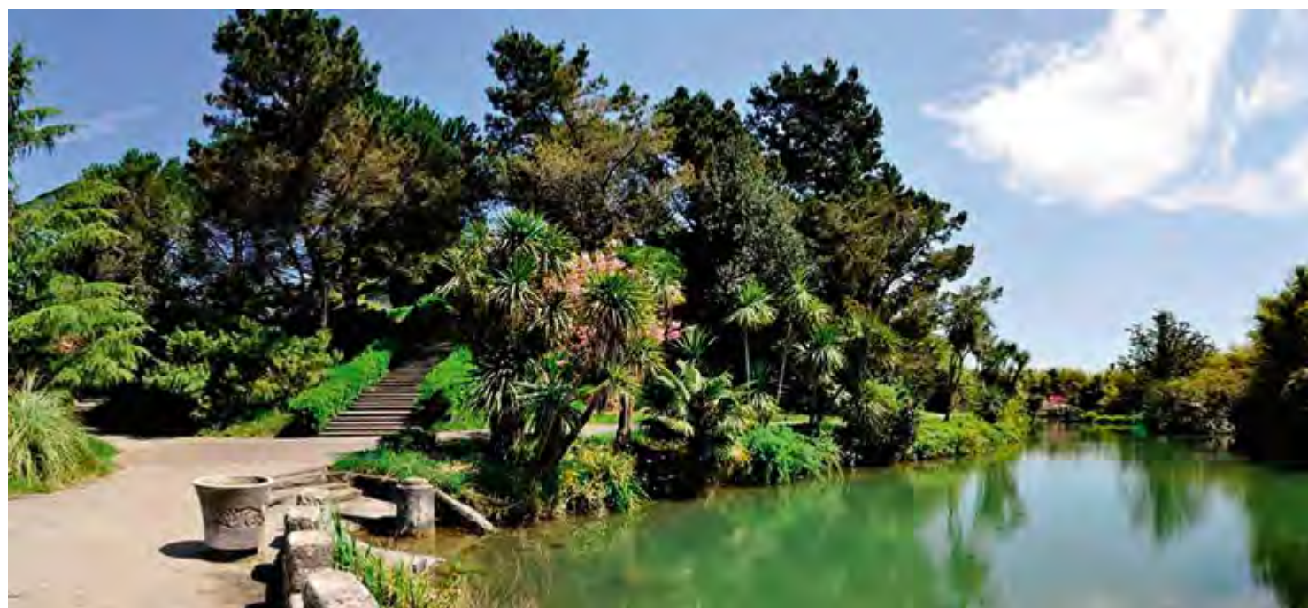
^ Парк «Южные культуры»

ства. Множество предметов вооружения и снаряжения свидетельствуют о значении военного быта в хозяйственном укладе. С XIV в. население горских племен находится под влиянием генуэзцев, затем османов; развиваются экономические и политические связи, процветает работорговля. По окончании русско-турецкой войны в 1864 году горским племенам, обитавшим в предгорьях Сочи, было предоставлено право остаться в России или уехать в Турцию.