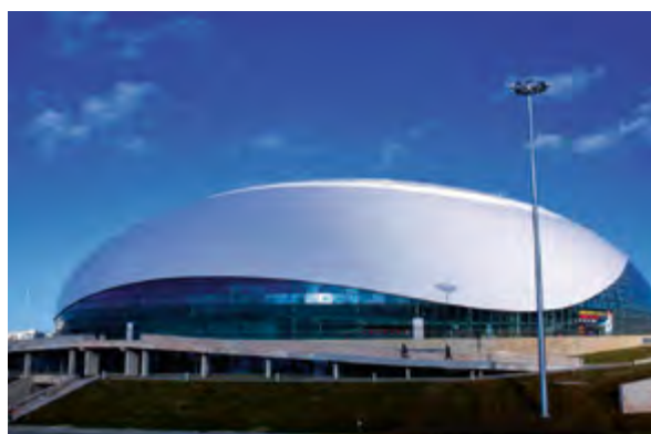
v Экспо-центр «Адлер-Арена»