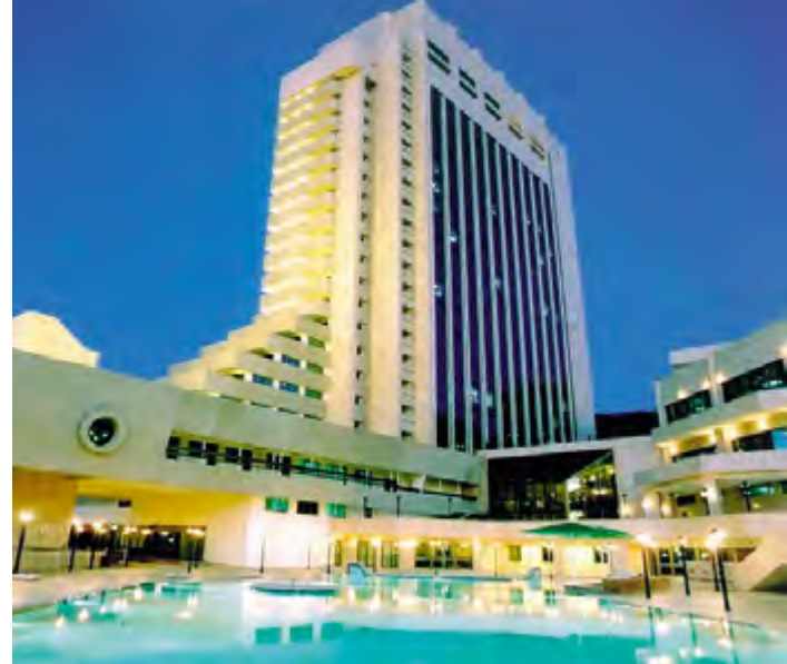
^ Гостиничный комплекс «Рэдисон САС Лазурная». Арх. Ярошевский И.В., Звуков Л.К. 1994 г.