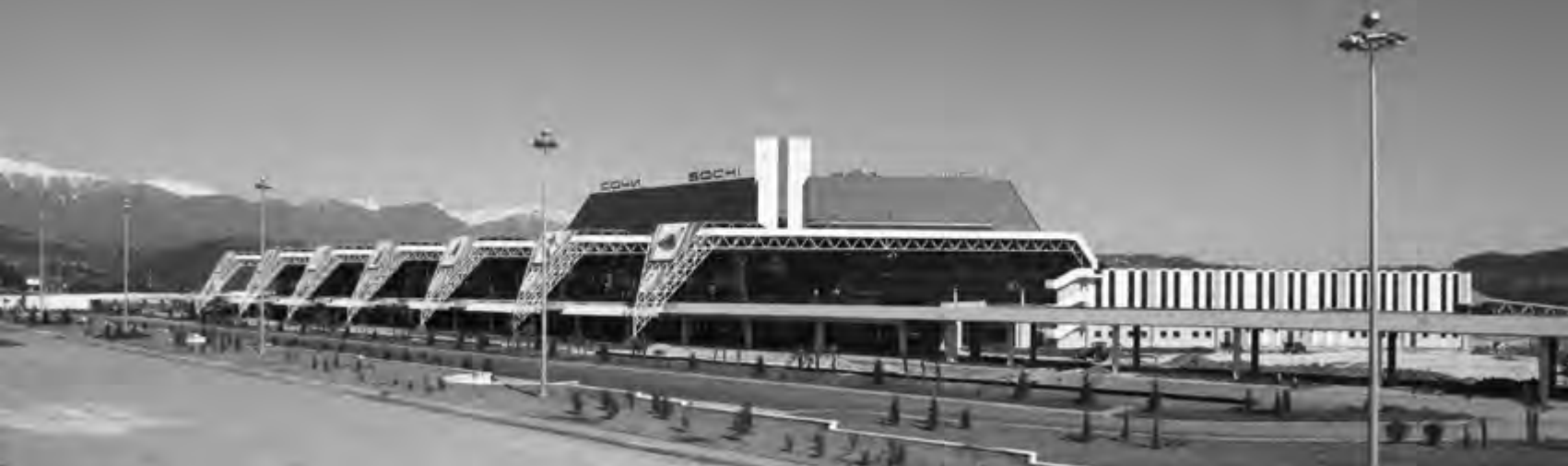
> Аэропорт Адлер. Арх. И. В. Ярошевский, О. Ф. Козинский, О. В. Ко- зинская, М. Ермолаев, 1989–1991