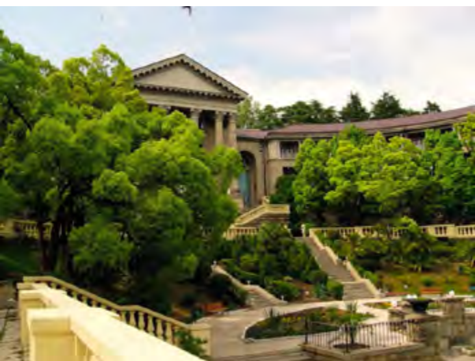
^ Парк санатория им. Орджоникидзе