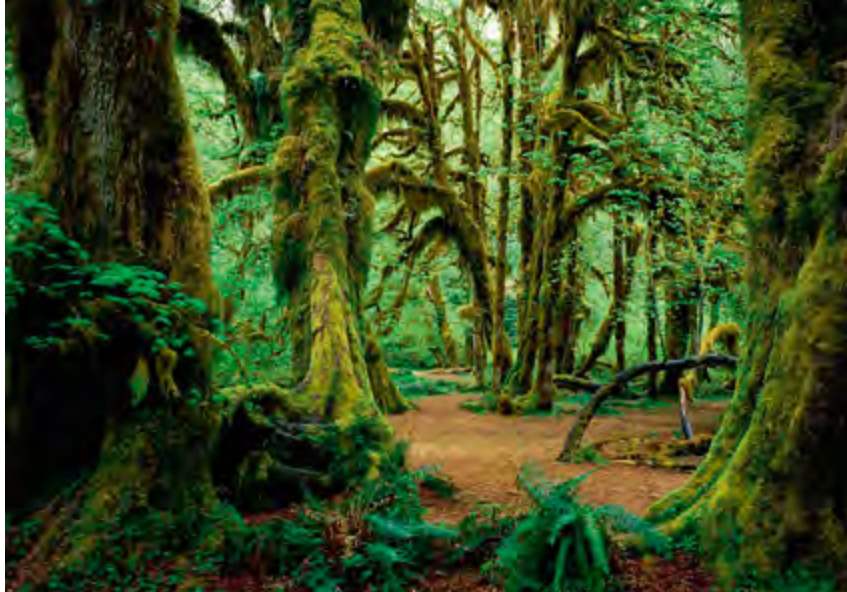
^ Тиссо-самшитовая роща

утраченные и сохранившиеся элементы исторической среды, которые не внесены в реестры наследия, хотя по своим архитектурным достоинствам не уступают охраняемым объектам, а порой их даже превосходят 19 .