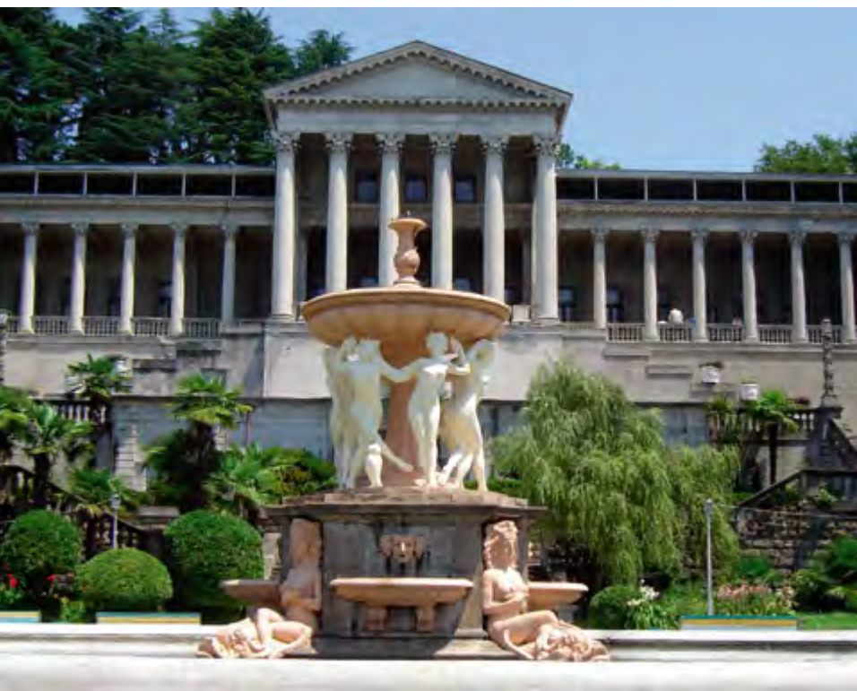
^ Санаторий им. Орджоникидзе

ятия дальних горных панорам и морских пейзажей были благоустроены терренкуры, в том числе знаменитая тропа от стадиона до Мацесты. По водоразделам прокладывались пешеходно-транспортные улицы (гора Батарейка – ул. Альпийская) или ландшафтные дороги (гора Виноградная – ул. Виноградная 21 ). Трассировка горных шоссе и туристских маршрутов, с учетом ландшафтно-визуальных связей природных доминант Большого Кавказского хребта, определяла характер и местоположение обзорных площадок в архитектурно-планировочных решениях туристской инфраструктуры. Видовые площадки оформлялись архитектурными акцентами.