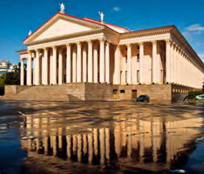
^ Зимний театр. Арх. Чернопятов К.Н. 1937 г.