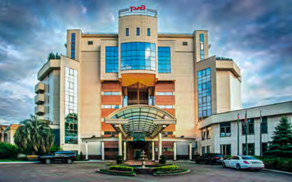
^ Санаторий «Черноморье». Арх. Л. К. Звуков, Ж. Лисичич, 2001