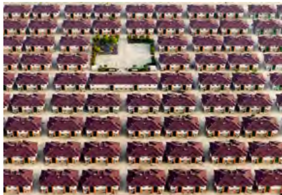
< Рис. 5. Нас лишают всякой инаковости, всякой необычности и обрекают на воспроизводство Того же самого в бесконечном процессе отождествления, в универсальной культуре тождественности. Ж. Бодрийяр. Застройка в провинции Цзянсу, Китай

Поэтому осмысленной стратегией действия с городами и средой сегодня, особенно в России, является вовсе не достижение целей, представляющихся очевидными, вроде «оздоровления», «повышения комфортности», роста/понижения плотности и пр. Имеющиеся технологии достижения всего этого не приносят социального блага, не дают удовлетворения, не защищают от втягивания в грязные манипуляции с общественным мнением и в банальное разворовывание ресурсов всех видов, включая лимит человеческого доверия. Осмысленна постановка всего известного «в скобки», постановка вопросов о происхождении наших убежденностей и ориентиров. Не стройка, но размышление; не синтез и симбиоз всего со всем, но анализ и постижение синкретических феноменов; не разбрасывание, но собирание камней. И уж точно не форсированная инноватика, демон которой все еще застит глаза администрациям, долж-