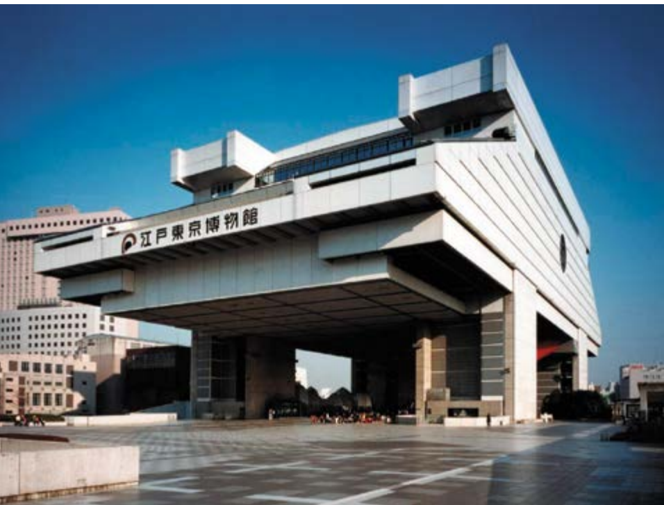
v Рис. 12а, 12в

помещения, склады для хранения вещей, а то и вовсе были заброшены. В 2007 году владельцы согласились на снос здания, но из-за финансового кризиса решение было отложено. Тогда же появилась группа активистов, стремящихся сохранить здание. Главным результатом стало привлечение иностранной помощи к сохранению башни. Немаловажную роль сыграли туристы и посетители из разных стран. Сложилась парадоксальная ситуация: постройка метаболизма стала частью достояния мировой культуры, что и подтолкнуло Японию к признанию ее исторической ценности. И только после этого началось ее непосредственное сохранение. (Рис. 13в)