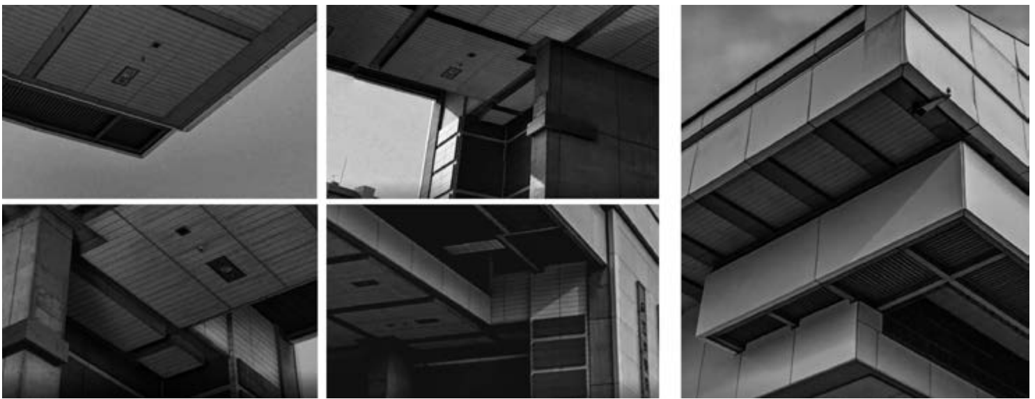
^ Рис. 12б