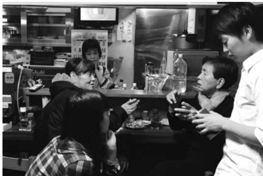
v Рис. 11а, 11б

Несмотря на то, что здание сохранилось до наших дней, оно давно пришло в негодность. (Рис. 13б) По состоянию на октябрь 2012 года, около тридцати из 140 капсул продолжали использоваться в качестве жилья, в то время как другие применялись как офисные