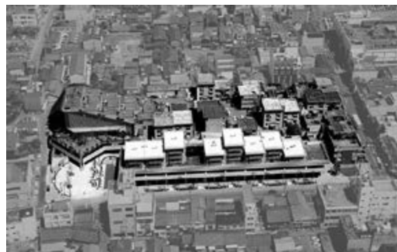
< Рис. 7а

Тем не менее, Япония славится трепетным отношением к сохранению старинных традиций и материальных ценностей. В Японии основное внимание уделяется сохранению архитектурного наследия – многочисленных храмов и святилищ, почитавшихся долгое время и многими поколениями. Методика сохранения таких памятников