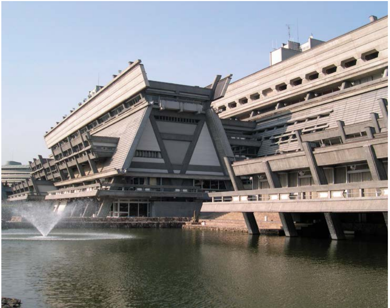
v Рис. 6

The first category that was mentioned includes buildings which are being used as museums, art galleries or art centers. By definition these buildings serve the purpose of collecting artifacts of natural history and tangible heritage, what indirectly makes them a part of this heritage. Due to promotional activities they also hold a notable value for society. Museums designed by the architects of Metabolism are often in a better condition than the buildings of other categories. These buildings include: Oita Prefectural Library (Arata Isozaki, 1964-1966) (Fig. 1a, b), Iwasaki Art Gallery (Fumihiko Maki,