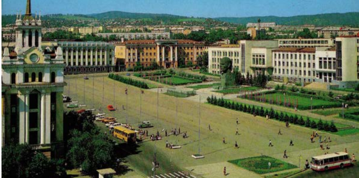
< Площадь Советов после реконструкции. Общий вид